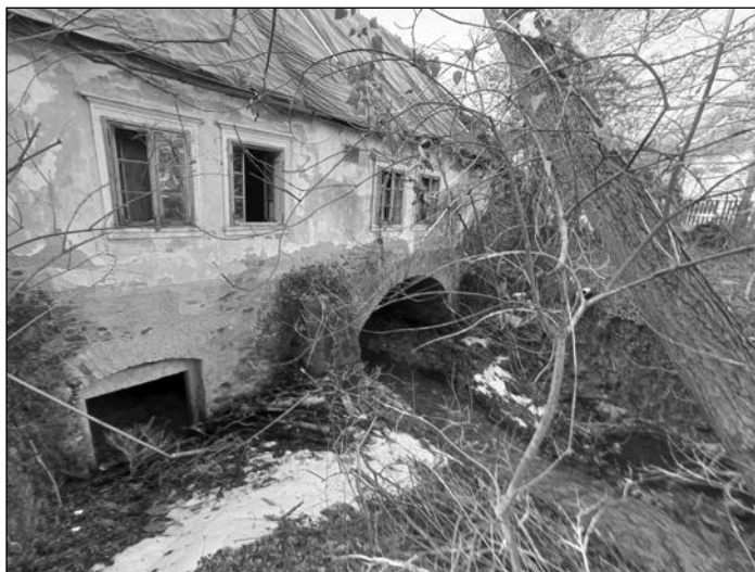
Erdei, másképpen Kárpáti-malom (Erdei Malom köz 10.) homlokzata az utca felől