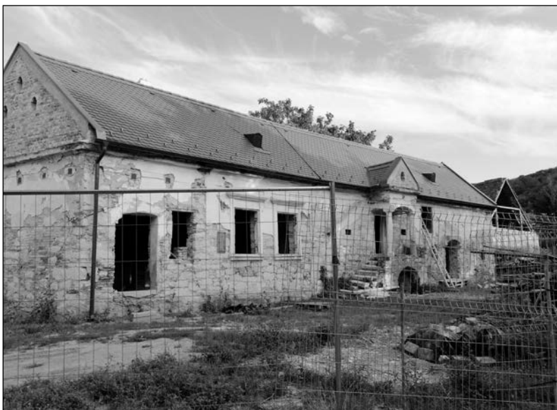
Gesztenyés körút 9. műemlék lakóépülete

A Gesztenyés körút 64. sz. a mai Pálos Pince. Emeletes lakóház jelentéktelen homlokzattal. A Gesztenyés krt. 68. késő középkori, kora újkori sziklapince. 40 Helyi védett tájértékű területbe tartoznak a Gesztenyés körút mentén a 36. sz., a 38. sz., a 40. sz., 54. sz. házak. Részházas porták még: Gesztenyés körút 1., 3., 11., 13., 45. 48., 56., 58., 58/A., 58/C, 58/D., 60., 62., 62/B. és a 65. házak.