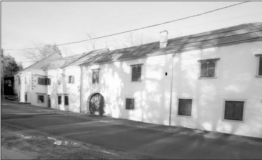
Az út másik oldalán a malomhoz tartozó lakóépület helyi védelem alatt áll

színre. Különösen a Neues Pester Journal ban Onkel Tóbiás álnéven megjelent írásai voltak népszerűek.