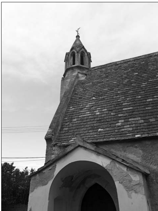
Mária Magdolna templom déli oldala a templom bejáráttal