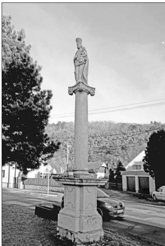
Mária-oszlop az Ady Endre út bánfalvi szakaszán

dombháton szántóföldeket, délre réteket és erdőt, északnyugatra szőlőt és gyümölcsöst említenek. 8