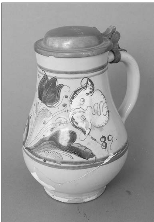
3. kép. Bokály. Északnyugat-Magyarország, 1689. A fedelén 1693-as évszám. (SoM NT 55.737.1.)

sajtár, rosta és körömvas, míg a présházból nyíló kis kamrában kisajtót találunk láncos reteszével és egy öreg vasfazekat.