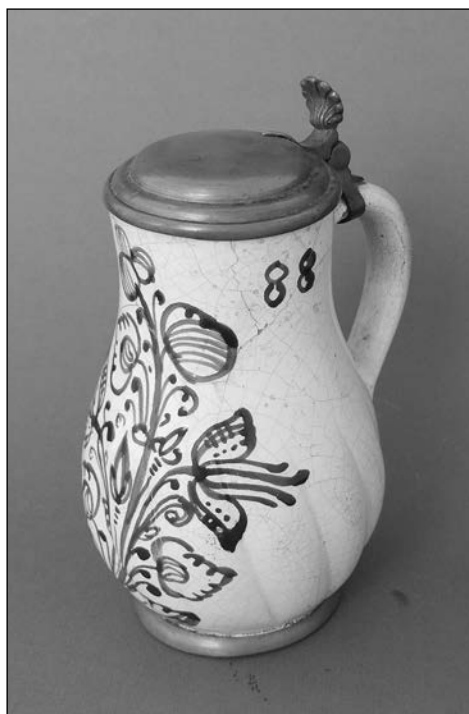
2. kép. Bokály. Északnyugat-Magyarország, 1688. (SoM NT 55.738.1.)