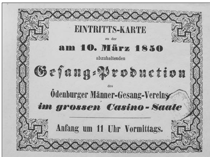
2. kép. A Männer-Gesang-Verein 1850. március 10-i hangversenyére szóló meghívó. (Soproni Múzeum, A 2012.42.2.)

a kaszinóban. Forrásaink további produkcióikat is dokumentálják: 1852 őszén közreműködtek a gimnázium egy professzorának ravatalozásánál tartott éneklésben, 1854-ben a kisdédóvó javára a líceum dísztermében, valamint 1858-ban a Ditricht-szeminárium felavatásán léptek fel, 54 de az evangélikus árvaház alapkövetésénél, és temetésekén is énekeltek, sőt jótékonyági koncerteket is tartottak, többek között a soproni óvoda, a teológiai szeminárium és a Gustav Adolf Verein javára. 55 1857-ben Ferencz József országjárása alkalmával is énekeltek. 56 A Zenészeti Lapok líceumi dalárdára vonatkozó megjegyzése miatt azonban joggal merülhet fel a kérdés, hogy vajon az 1854-es líceumi jótékonyági koncert nem az ő szereplésük volt-e, és nem pedig a Dalfűzér elődjéé. 57