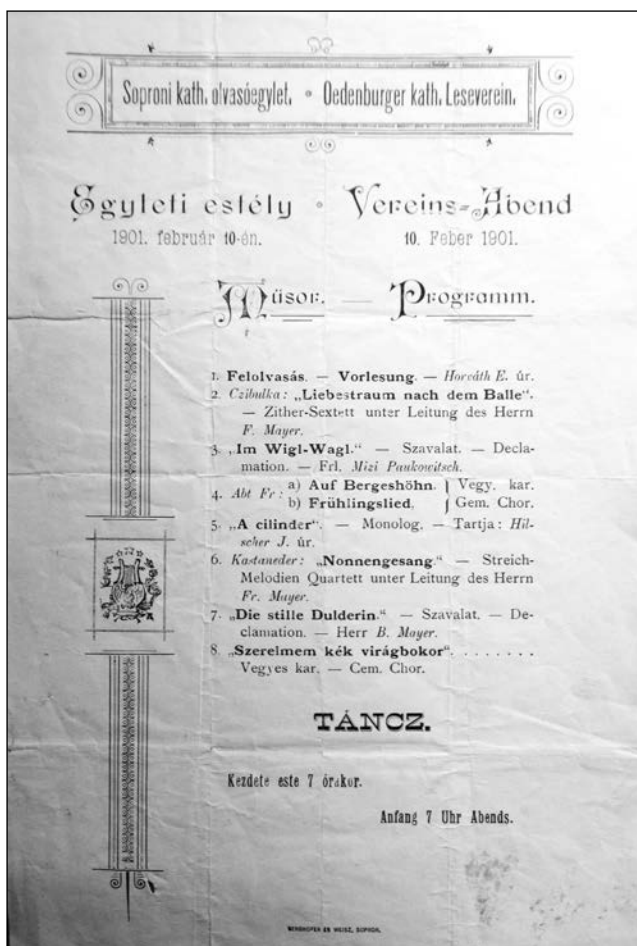
1. kép. Egyleti estély meghívó 1901.

hosszú évtizedek során alig változott. Kezdetben csak férfiak alkották, de hamar rájöttek milyen hasznosak lehetnek a nők rendezvények terén, ezért 1908-tól már nő is lehetett Vigalmi Bizottsági tag.