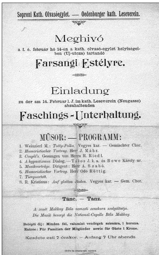
4. kép. Farsangi multság meghívója 1903-ból.