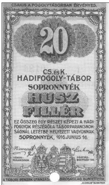
3. kép, 4. kép. A sopronnyéki foglyótáborban használt, saját gyártású készpénz.

gyalások következményeként 1918. május 1-től az orosz hadifoglyok eltérő bánásmódban részesültek, mint más nemzetiségek tagjai, amely a többi hadifogolyból több esetben zúgolódást válthatott ki. Ehhez hasonló eset történt a büki cukorgyárban, amely nézeteléréseket sikerült elintézni, de az őrségeket vagy megerősítették, vagy pedig kicserélték.