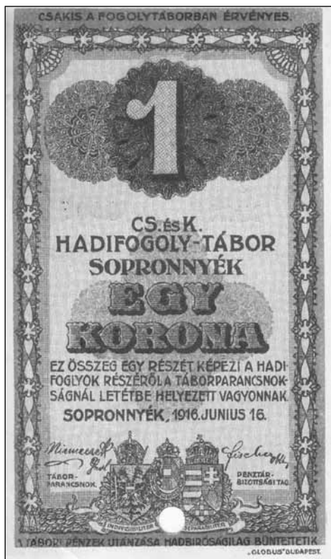
5. kép, 6. kép. 1918-tól a munkára kiadott hadifoglyok minimum bérilletménye.

szemben az 1568/VHK. számú körözést kiadta. A konkrét eseteket pedig az illetékes katonai parancsnokság vezérkari osztályával kellett közölni. 35