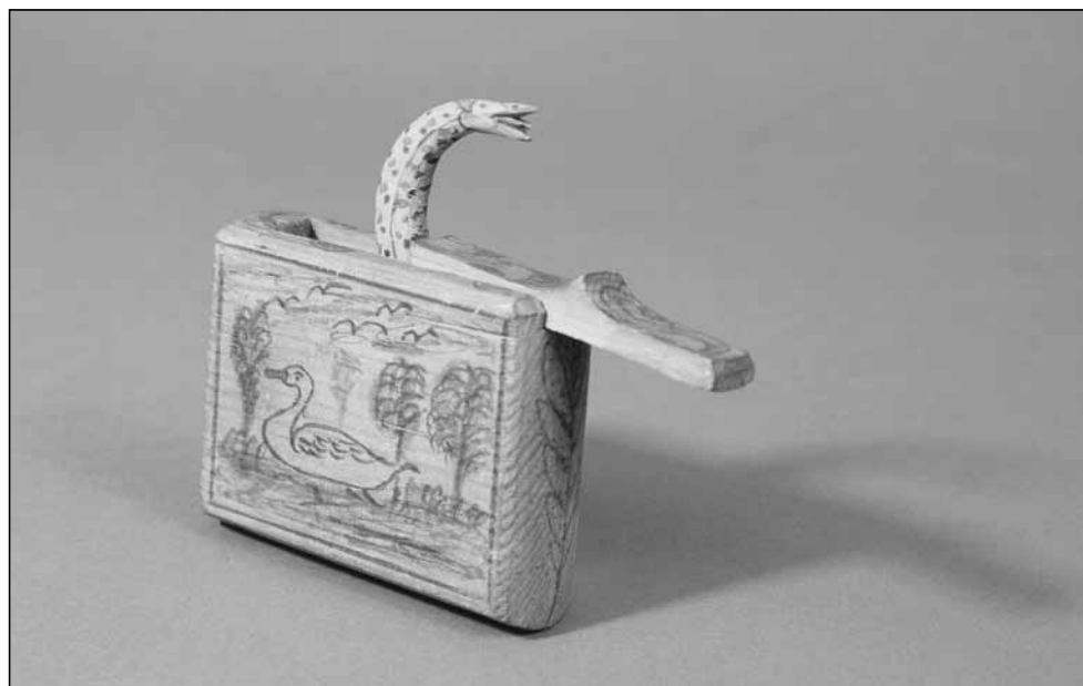
1. kép, 2. kép. Sopronnyéki orosz hadifoglyok által készített emléktárgyak a Soproni Múzeum gyűjteményéből