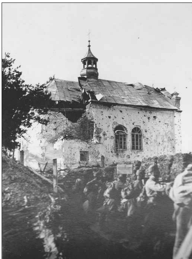
3. kép. Katonák az első vonalban Brody előtt, Sydonowka romos kápolnája mellett.

páterünk. Viccek: Egy 26-os baka szólítja meg. Nem tudja őrmester [?] úr, hol van 26-os regiment. Kutya fene egye regimentjét, mindig bujkálja magát, már 3 napja keresem. Fújnak sturmra, kidugom fejemet a deckungból, – senki sem mozdul. Fújnak megint, kidugom fejemet, senki. 3szor is. Szépen visszafeküdtem.