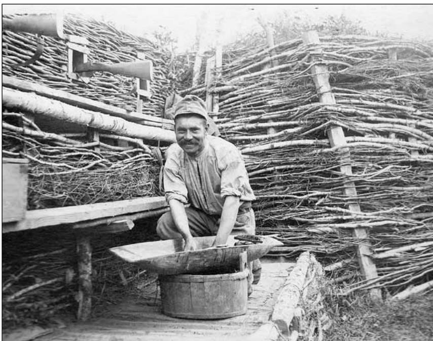
2. kép. Mosás a harcok szünetében, a lövészárokból.

meg kedves Zsiga bá'm azt a helyet, ahol a Nida beleömlik a Visztulá-ba. Másnap végre misézhettem egy templomban. Először mióta itt vagyok. Most pihenünk, hogy meddig nem tudom.” 26