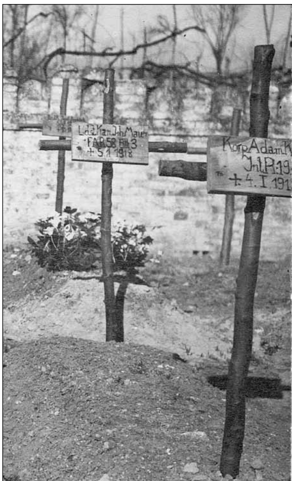
10. kép. A 19-esek katonai temetője, valahol a Piave mellett. 1918.

vagy halál. Elhatároztam, hogy ha visszavonulás lesz, – inkább a rohanó Piaveba vetem magam, de fogoly nem leszek. Elgondoltam már, hogyan vetem le ruháimat, mit vehetek magamhoz és hogyan kell úsznom, merre vegyem az irányt. Gyanús, hogy tűzerek ágyúk visszajönnek.