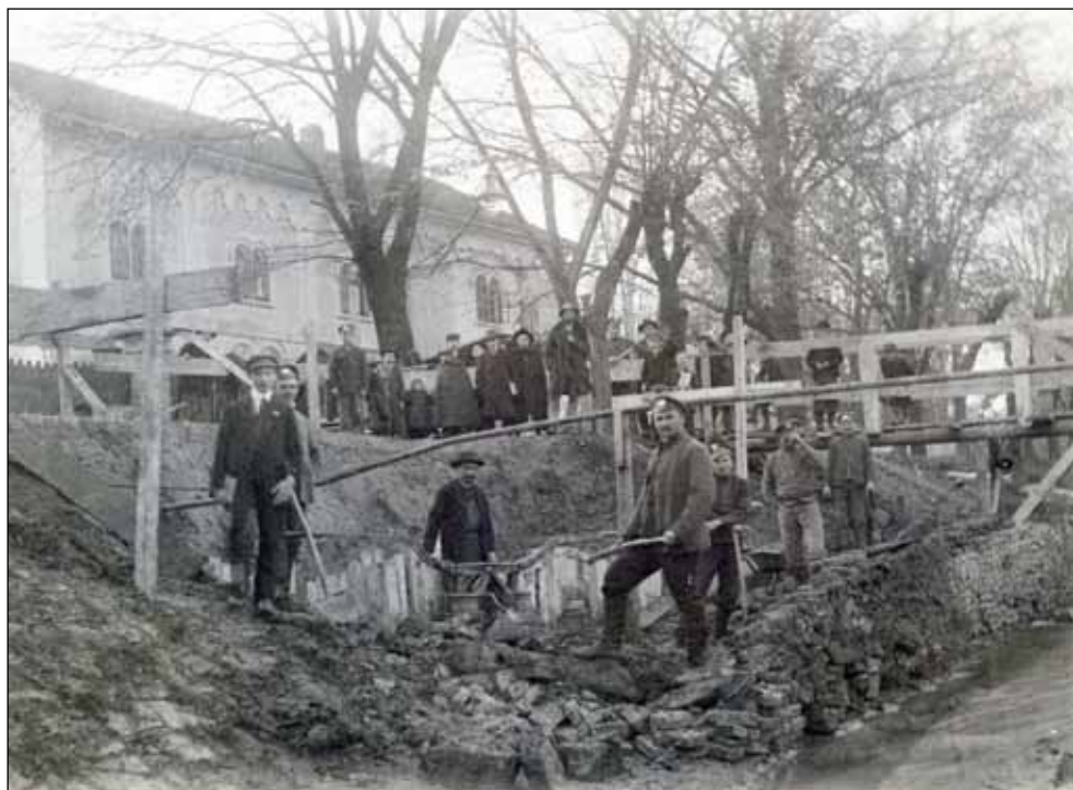
7. kép. Az Ikvahíd helyreállítási munkái orosz hadifoglyokkal. Fotós: Gantner Antal, 1915 ősz (Soproni Múzeum)

Nagymegyer, Boldogasszony (ma: Frauenkirchen, Ausztria), Nezsider (ma: Neusiedl am See, Ausztria), Ostffyasszonyfa, Zalaegerszeg. 73