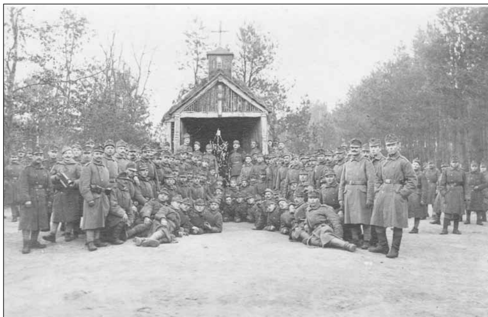
6. kép. Mise után, a Zalosce melletti fakápolnál. 1916. Gyertyaszentelő Boldogasszony napján.