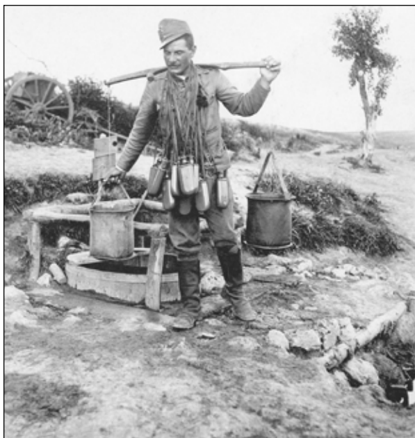
7. kép. Vízhordó baka.

hoz, ahol Kunnert találok. Mindketten igen el vannak keseredve. Akik a hínterl[and]ban vannak dekorációkat kapnak (Szabó kapit.[ány] állítólag verdienstkreuzot kap), itt, elől dolgoznak a tisztok, életük veszedelemben és dek.[oráció] helyett szidást kapnak ezrede-süktől. Általános hangulat a tisztok között. Igen káros hatású, elkészerítő, – ezredesnek az a felfogása, hogy most nincs gefecht, tehát nem jár dekoráció, a munka „hundpflicht”. [...]