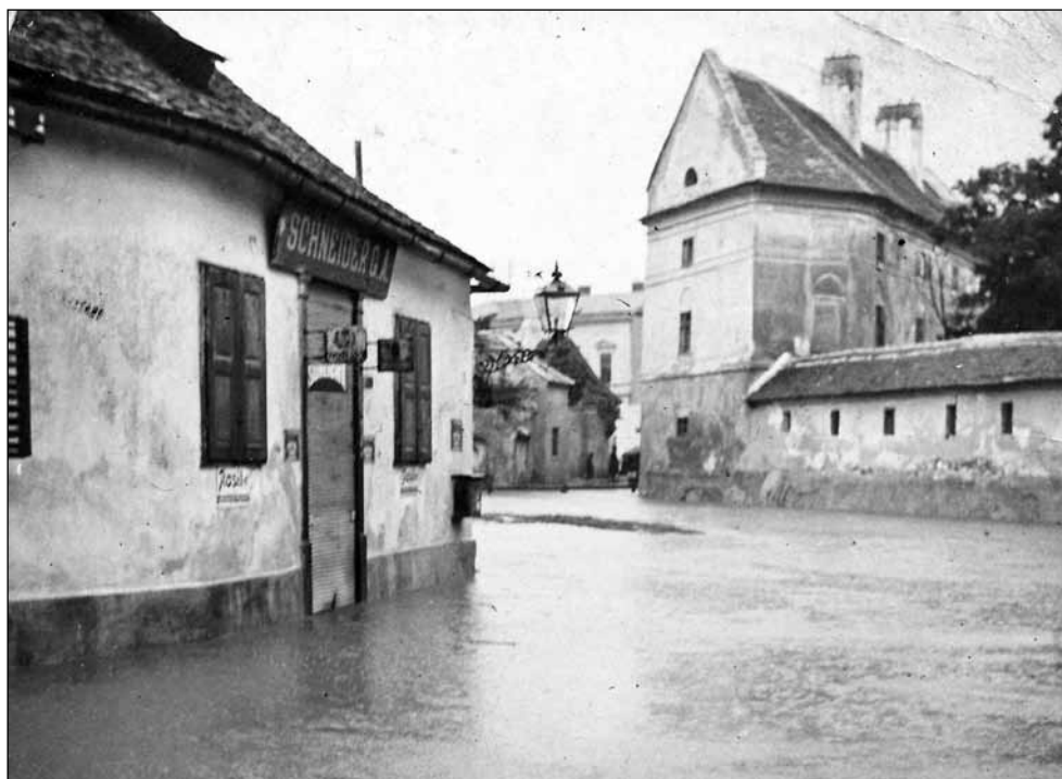
1. kép. Az Ikva áradása. Fotós: Gantner Antal, 1914. július 18. (Soproni Múzeum)

papírkereskedésében (Széchenyi tér 20.) tette ki közszemlére. 24 Az érkező hírek hatására július 26-án az utcák benépesültek. A hömpölygő tömeg éltette a királyt és a háborút. A szerbek ellen szitkok hangzottak el, és a tüntetést a rendőrségnek kellett szétoszlattani. 25 A Soproni Napló szerkesztőségét folyamatosan ostromolták az érdeklődők, és az új nyomdaépület előtt (a Röttig G. és fia nyomda 1914 nyarán költözött új épületébe – Deák tér 56. – de üzlethelyiségét megtartotta a Várkerület 72. alatt) tolongás alakult ki. A Várkerületen összegyűlt tömeg általában a Tschurl-házon keresztül ment a nyomda elé, ahol várta az új különkiadásokat. 26