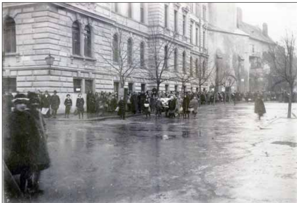
3. kép. Sorbanállás húsért a hatósági hússzék előtt. 1915 körül

kor a vásárlókat fogadták (rendesen szombaton), ezer embert tudtak kiszolgálni. 30 Ekkor már rendszeresen kigyózó sorok álltak az üzletek előtt. Mivel az árak folyamatosan emelkedtek, 1914 novemberétől rendelet írta elő, hogy a legmagasabb árak meghatározására ármegállapító bizottságot kell felállítani, amelyek a főispánok vagy helyettesük elnöklete alatt működnek. A bizottság elnöki tisztét így dr. Baán Endre főispán látta el. 31 Az áruhiány a következő év elején kezdte éreztetni erősen a hatását. A januári hidegben a szénhiánnyal szembesültek az emberek. A város gazdasági hivatala arra hivatkozott, hogy vasúti kocsik hiányában nem tudnak szenet szállítani. Drágult a petróleum, az emberek úgy védekeztek, hogy korábban feküdtek, később keltek, és várták, hogy a nappalok hosszabbodjanak. 32