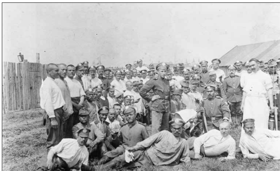
6. kép. Orosz hadifoglyok Sopron határában. Fotós: Gantner Antal, 1915 körül (Soproni Múzeum)

mester is megjelent. 65 Az Ojtozi csata évfordulójára, 1918. augusztus 11-én a m. kir. 18. honvéd-pótzászlóalj ünnepet rendezett, amelynek keretében tábori misét celebráltak az Anger-réten, zene volt a Deák téren és jótékony célú népünnepély az Erzsébet-kertben. A bevételt az ezred özvegyei és árvái számára létrehozott alapnak adták át. 66