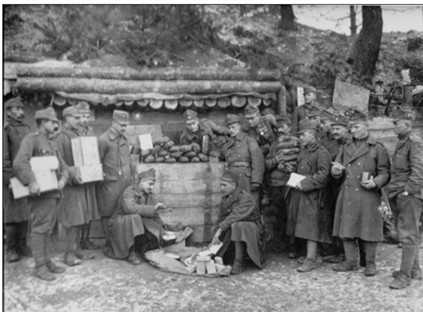
4. kép. Megérkeztek a karácsonyi csomagok. 1914, Kolosy.