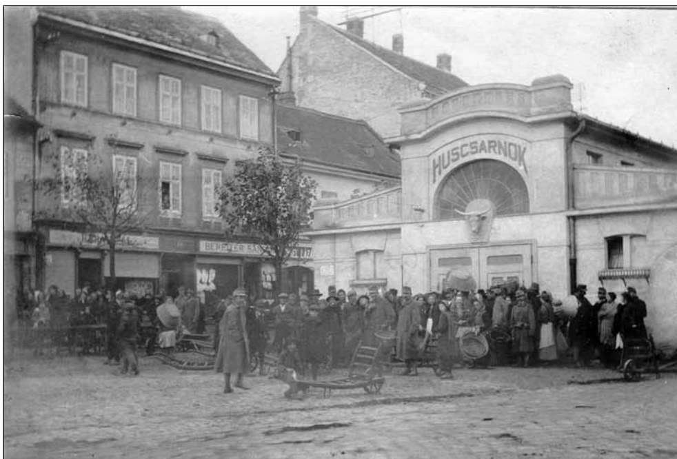
5. kép. Sorbanállás a városi Húscsarnoknál a Kisvárkerületen. Fotós: Gantner Antal, 1915 körül (Soproni Múzeum)

a másik. Az ügyben a Sopronmegyei Gazdasági Egyesület és az Iparkamara szakvéleményét is kikérték. Heimler Károly elmarasztaló ítéletet hozott az ügyben, de dr. Szilvássy Márton fellebbezett. 47