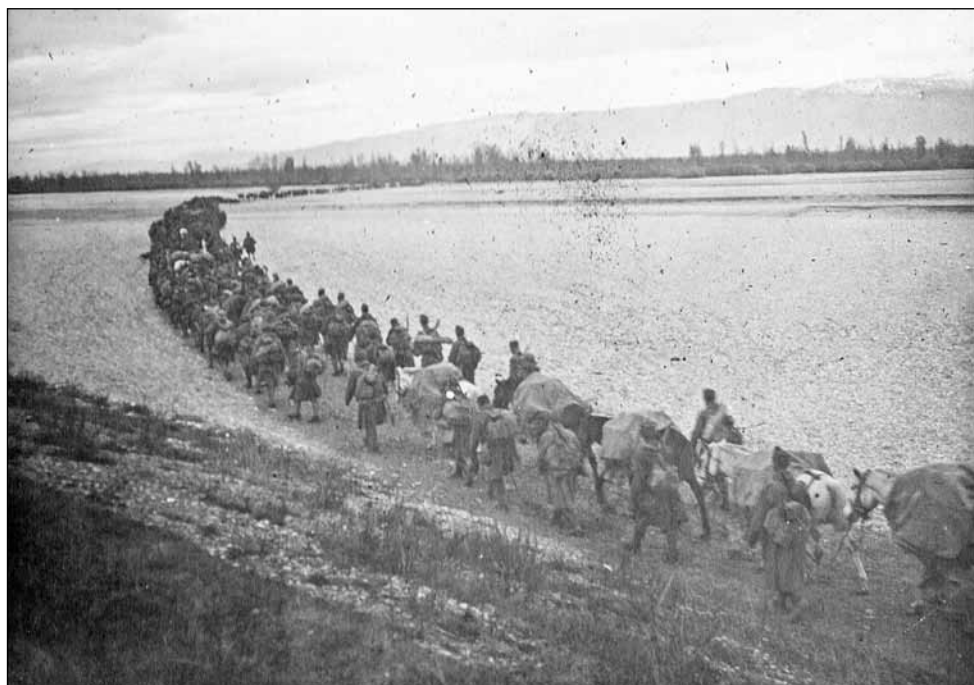
8. kép A 19-esek átkelése a Tagliamentón. 1917. november.

Déltájban menetelő oszlopunk megáll egy másik falu mellett. Elöl valahol megakadtak a szekerek, nem mehetünk tovább. A bakák beosonnak a házakba. Egyik három gesztenyével, másik körtével, legtöbb boros üveggel tér vissza. Van itt minden. Házak nagyrészt üresek, a lakók elmenekültek. Egy-pár öreg ember, gyerek, ijedt, kétségbeesett arccal álldogál a házak mellett, félénken emeli meg láttunkra kalapját. Hatalmas robbanás reszketteti meg a levegőt. Mi az? Hátralovagolok, – egy német katona játszott kézigránáttal, felrobbant, s vagy 200 kg. súlyú láda vele együtt. Jajgatás emberhús-cafatok, vér.