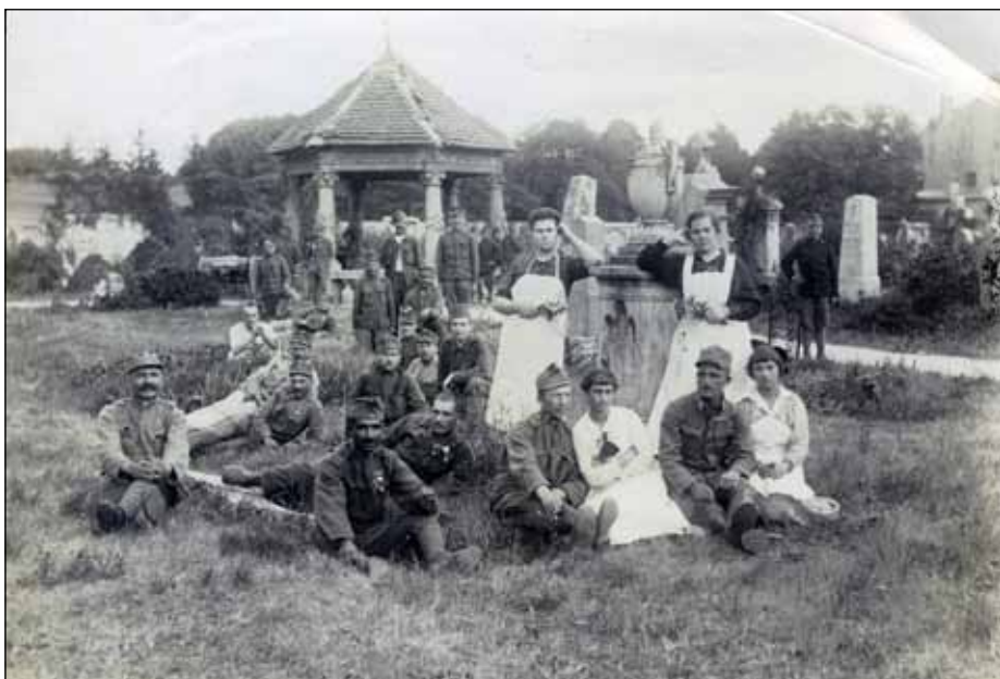
9. kép. Katonák a régi evangélikus temetőben. Fotós: Gantner Antal, 1915. körül (Soproni Múzeum)