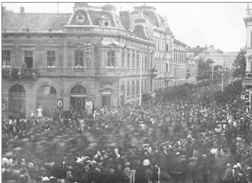
2. kép. Tüntetés a háború mellett. Fotós: Gantner Antal, 1914. július 30. (Soproni Múzeum)

énekelt. Késő este értek vissza a laktanyához. Ezután visszamentek a Royal-kávéház elé, ahol együtt elénekelték a Szózatot. Az éjszakai órákban az emberek megtöltötték a vendéglőket és kávéházakat. 28 A kezdeti eufóriát és a közelgő összecsapást pártoló közérzetet azonban a hétköznapi nehézségei követték négy éven át.