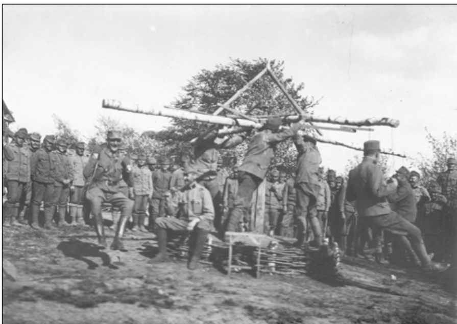
5. kép. Körhintázó tisztek.

gák. Szíves, mézes-mázos volt a pap. Misézhetem is, de ostyám nincs. Mutatta az övökét darabokra vágott zsemlyedarabok. Felmentem a templomba, – a 12-esek feldkurátja (Zsidek) is éppen akkor jött. Ikonosztázion csukva, mise alatt nyitva. Miskönyv ószláv. (Legenda, Jézus ballába lenyomata.) Sz[en]t. Miklós képe az oltár előtt egy asztalon. Breviáriumoztam. Utána Zsidekkel elmentem lakására (doktor maródivizitet tartott), ahol Bűrchner Laci öccsével találkoztam, kártyát is menesztettünk Tatára. A 12-esek jól élnek, pezsgő többször, állandóan sütemény. Egy katonai foghúzás. Délután kis alvás. E közben hozták híriül, telefonálták, hogy Hauszmann kapitány századjából egy patroutt elfogtak az oroszok Duszatin-ban (5 ember, de egy megszökött) Alezredest felizgatta nagyon a hír. Utána tüzérhadnagy és kadét jöttek, itt hálnak nálunk s holnap felderítő útra mennek az Ostrava völgyébe. Beszéltek a kézigránáról – a tüzfecskendőről (rohamok ellen, iszonyatos hatással, – eléget, megszenesít mindent. Német találmány.) Crannowi kastély, gyönyörű parkjának és épületjének összelövetése. Éjjel parancs, hogy nem maradunk itt Szmolnik an Beligrod-ban, hanem el (vissza) Maniow-ba, kantonier szolgálatra (ott lakni és ezáltal a helységet tartani.) [...]