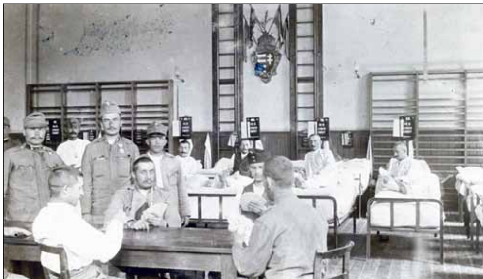
8. kép. Kórház a Felsőbb leányiskola tornatermében. Fotós: Visnya Aladár, 1915. (Soproni Múzeum)

sen 300 hadifoglyot kapott. A fölszaporodott mezei munkák miatt erősen megnőtt irántuk a kereslet, és a gazdák egymásnak adták a kilincset, hogy igényeljék őket. A hatóság próbált segíteni, de az ellenőrzésük biztosítása nélkül nem lehetett kiadni a foglyokat. 81