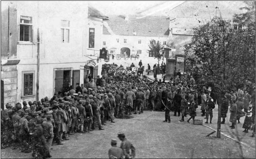
4. kép. Dohányosztás az Előkapuban a nagytrafikban. 1915.

amelyet 1916. január 10-étől vezettek be. 43 Mindenkinék naponta 240 gramm lisztet volt lehetősége elfogyasztani főzésre, illetve kenyérsütés céljára. A liszt- és kenyérjegyeket szintén a városi lisztüzletben lehetett beváltani, és a megadott kereten belül tetszés szerinti arányban válthatták ki a kenyeret, avagy a lisztet. 44