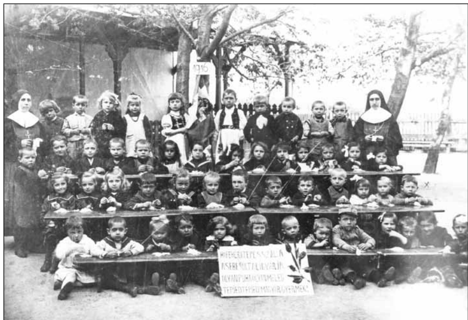
10. kép. A Katolikus konvent-óvoda a Halász utcában. (Ma: Halász utcai óvoda, Halász u. 27.) Fotós ismeretlen, 1916.