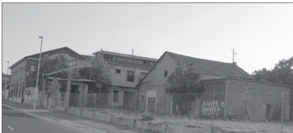
2. kép. A lebontott villanygyári épületek a Flandorffer utcában.