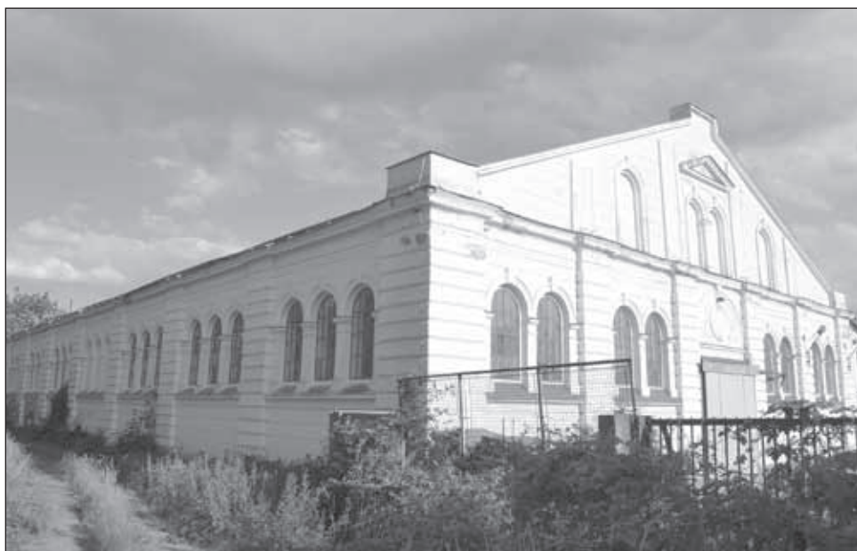
5. kép. A tüzérségi laktanya lovardája, Besenyő utca-Ágfalvi úti tömbbelső.

A Frigyes főherceg tüzérségi laktanyából (1897) több épület látható, köztük az egyik, jelenleg átépítés alatt álló főépület is. Ezek több átalakításon estek át a mindenkori funkcióknak megfelelően, de alapjában véve őrzik jellegüket. Legfigyelemreméltóbb épület e telephelyen egy vélhetően lovarda-épület a vasút mellett, amelyet melléképületekkel vettek körbe az Állami Gazdaság időszakában (5. kép). Az egykori katonai élelmezési raktár épületei 1896-ban épültek, ezekből mára egy maradt meg, a többi helyén köztisztviselői lakások épültek.