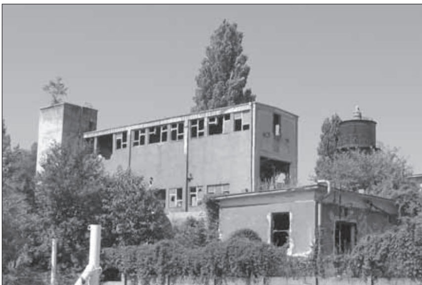
3. kép. A vasöntöde homokműve és víztornya.

Az egykori zárgyár épülettömbjének Schneider-féle tervei 1893-ban születtek, az utca vonalán álló főépület ma is áll, sajnálatos, hogy a jellegzetes téglarchitektúra nagy részét a közelmúltban történt felújításkor elfedték. A sörgyár épületegyüttesét brünni títustervek alapján 1895-re rajzolta meg az építész. Az üzem korabeli épületei jelentős bővítésekkel, és átépítésekkel, de ma is állnak. Ugyanakkor, a zárgyárhoz hasonló téglarchitektúra jellemzi a nagyjából egy időben, 1908-ban és 1909-ben tervezett és épített szőnyeggyár, illetve a vasöntöde főépületeit is. Előbbi ma is impozáns, a hozzáépítések révén viszont a főirodaépület beszorították, összeépítve az egykori munkáslakás és étkezdé épületével. Az irodaépület mögötti ún. Shed-tetős üzemcsarnok is ebből az időből való. Az egykori vasöntöde esetében Schneider Márton feltehetően csak kivitelező volt, az építész a bécsújhelyi Alois K. Lang lehetett. Az épület oromzata hasonló módon tatarozott, mint a zárgyáré. A gyár területén álló számos épület, köztük az ugyancsak korabeli víztorony nem áll védelem alatt, s ezek sorsa igencsak bizonytalan (3. kép). 32