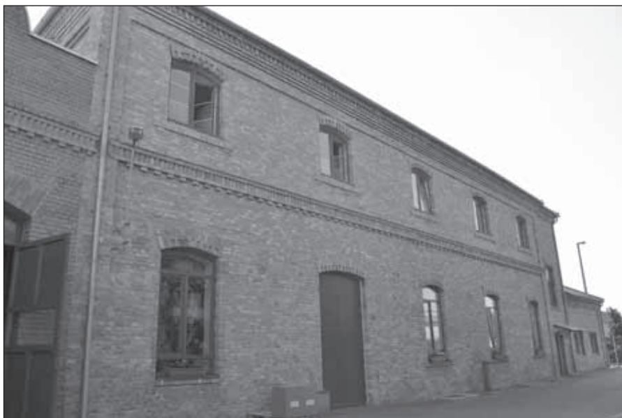
9. kép. A Weiss Manfréd gyár korabeli épülete a Csepel utcából.

A második világháború utáni évekből egy ipari komplexumot emelünk ki, amely letisztult formavilágával, egységes kompozíciójával már kiérdemli az ipari örökségvédelem figyelmét. Ez a Winkler Oszkár építész nevéhez köthető épületasztalos-árugyár, amely kisebb átalakításokkal, de őrzi eredeti jellegét. 38