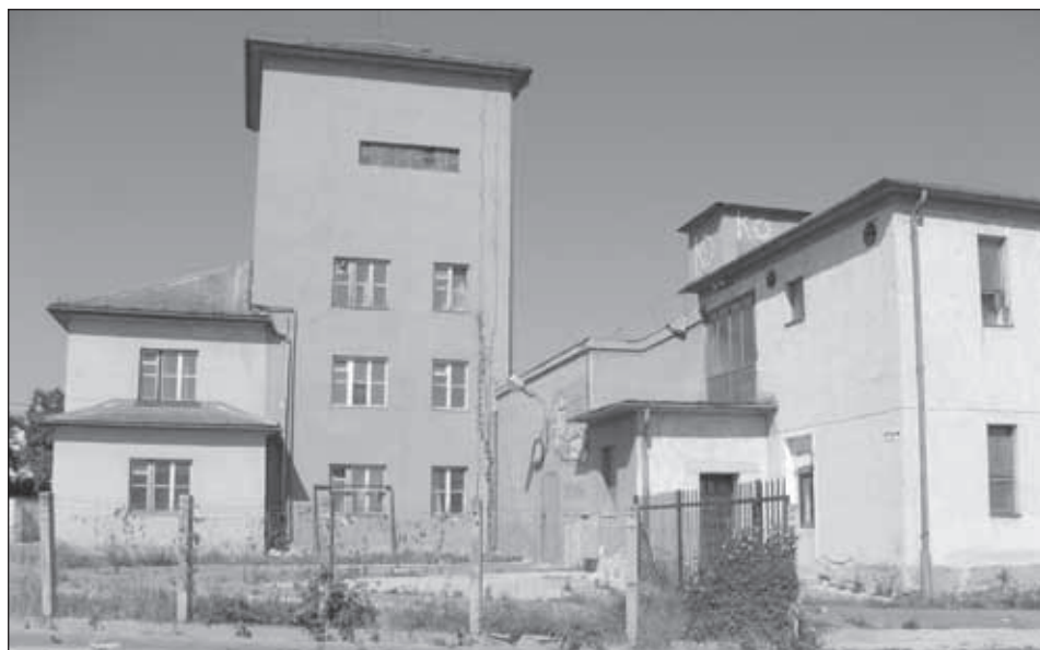
6. kép. A lebontott fésűsfonalgyár utcafrontja.