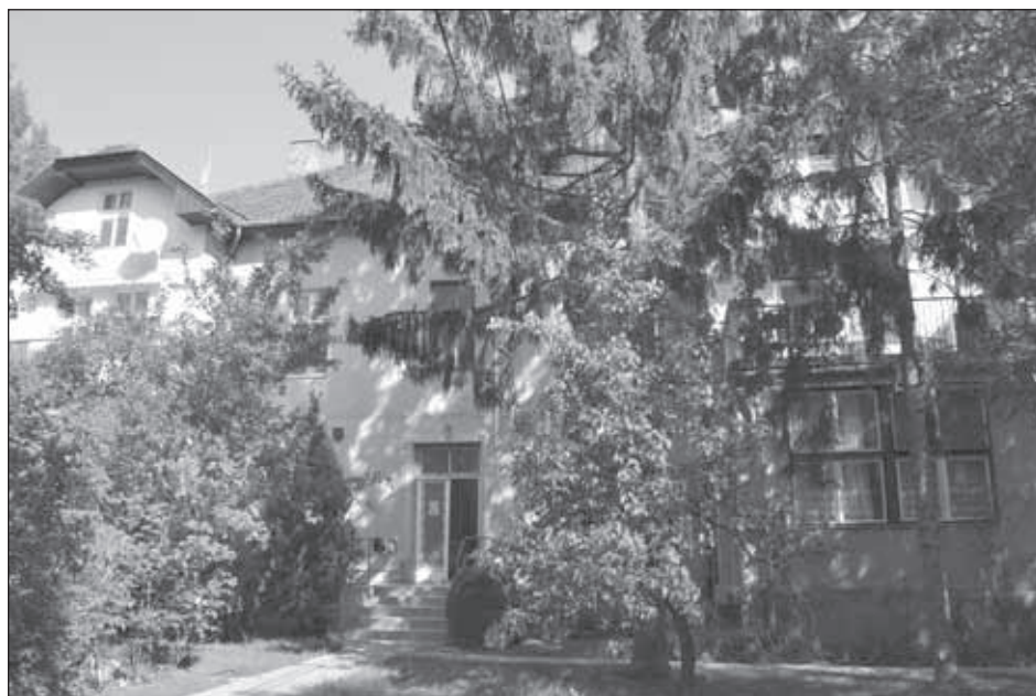
7. kép. A Wessel-Schwitzer-féle gyár igazgatói lakása a Kőszegi úti tömbbelsőben.