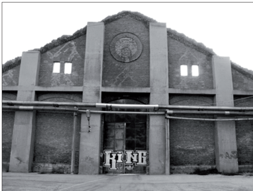
4. kép. Az egykori lovassági laktanya leégett lovardája.

Az egykori laktanyák megmaradt épületeit helyenként igen nehéz megtalálni és felismerni. Közülük a lovassági laktanya épült a legkorábban 1881–1882-ben. Winkler Gábor építészetiileg igen jelentősnek ítélte a Nádasdy huszárok laktanyájából (Baross u.) a bombázások után is megmaradt lovarda épületét, különösen annak 30 métert átívelő húzóműves fa ácsszerkezetét. A lovassági laktanyát, és így a lovarda épületét is Wender János tervezte 1882-ben. 34 Az épület a második világháború után raktárként funkcionált, a rendszerváltozást követően pedig a gyertyagyár vette használatba. 2003-ban egy tűzvész miatt azonban az említett tetőszerkezet teljesen megsemmisült, ma – megerősítve – csak az épület főfalai állnak (4. kép).