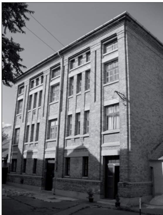
8. kép. Az egykori Forster-féle Sempronía gyár raktárépülete Magyar–Pócsi utca tömbbelsőből.

Szintén Füredi Oszkár tervezte a pamutüzem első csarnokait, amelyek ma már csak töredékükben állnak. A Gyár utcán túli bővítések és a megbújó munkáslakóházak viszont ma is láthatók. Ugyancsak a korai modern nyerstégla-építészetet képviseli a Magyar utcai tömbbelsőben megbújó 1921-es építésű raktárépület (ma már lakóház), amelynek tervezője Schármár Károly volt (8. kép). 37