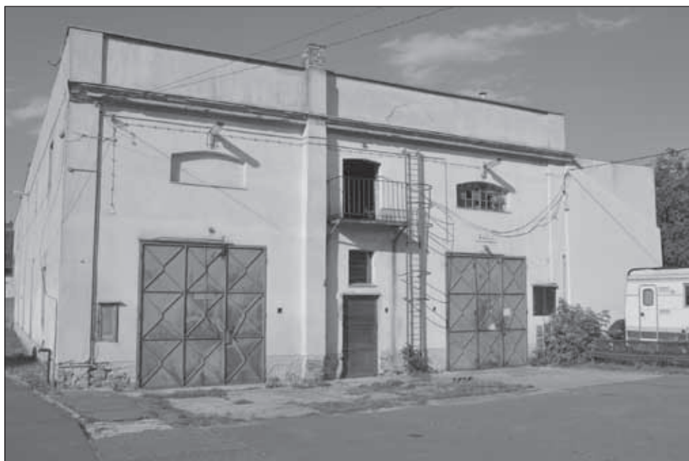
1. kép. A villamosremiz, udvari homlokzat.