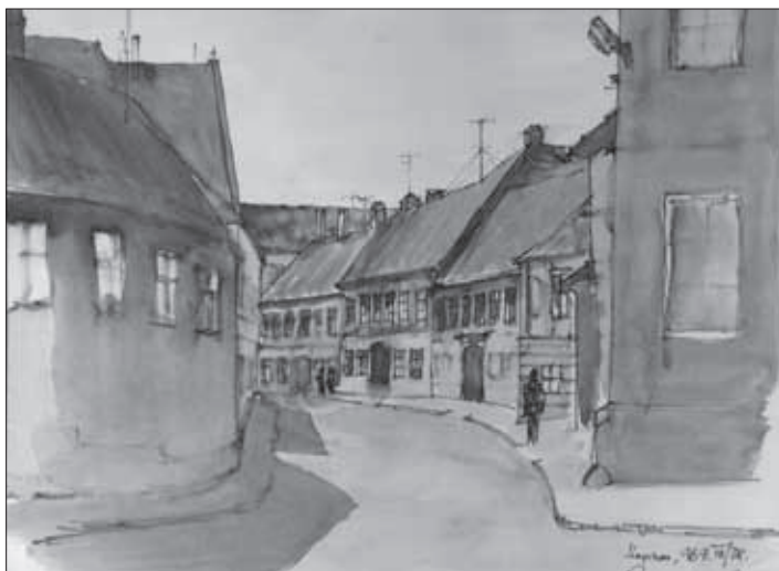
Kubinszky Mihály: Szentlélek utca, akvarell, 1969. (A Kubinszky család tulajdonában)

A városépítési tevékenység körébe tágabb értelemben mindenfajta településsel és települések környezetével, az ún. városkörnyékekkel kapcsolatos műveletek is beletartoznak. Szokásos a városrendezés szinonimájaként említeni, de a két fogalom nagymértékű egybeesése mellett a városrendezés elsődlegesen a városépítés tervezési-szervezési oldalát jelenti. Ugyancsak szokásos az urbanisztikával helyettesíteni, ennek a gyűjtőfogalomnak azonban a városépítés csupán egy szektorát képezi. [...] Elméleti alapját elsősorban a településtudományi kutatások eredményei szolgáltatják, de hasznosítja más műszaki és társadalomtudományok ismeretanyagát is.” 8