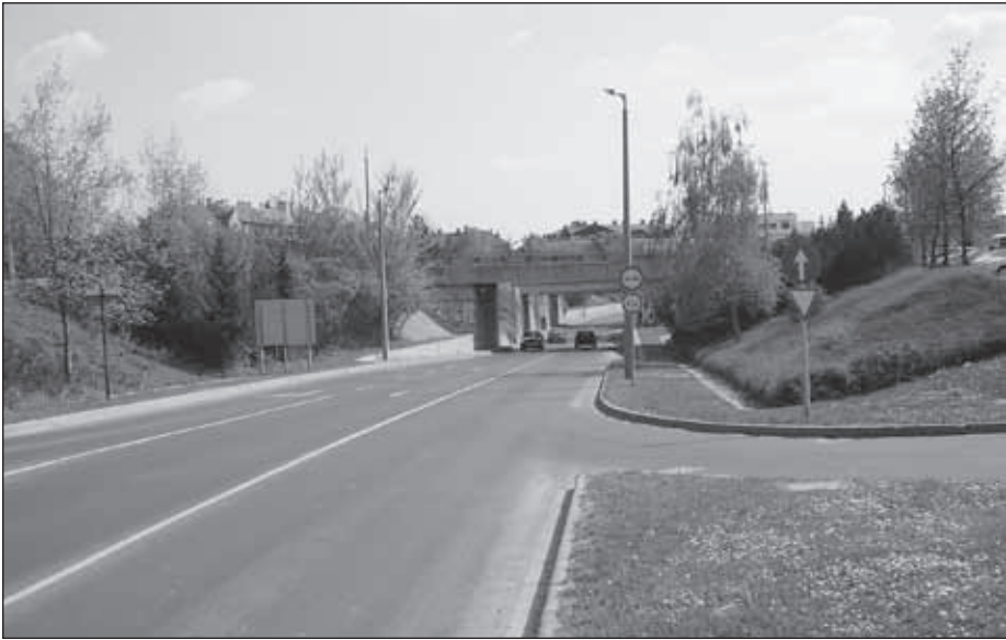
Sopron, Frankenburg úti aluljáró