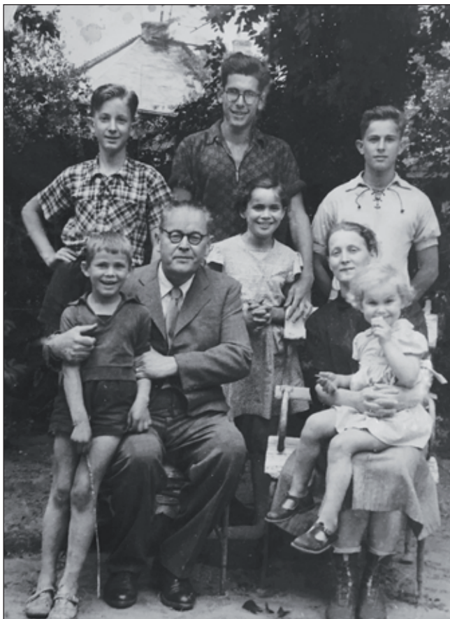
2. kép. A Kutas család az 50-es évek első felében

pincében. Az egyik öcsém, Gabi traumatikus emléke, amikor anyánnkkal sétálva a hősi temető felett látta, hogy velük szemben egy rosszul öltözött emberekből álló, nagyon fáradt menetet hajtottak fegyveresek, és egy öregember összeesett. Két fiatal felemelte, a fegyveres rájuk szólt, letették. Az öreget a katona agyonlőtte, a többieket tovább hajtották. Az öcsémnek ez az emléke volt annak idején Winkler Barnával a balfi emlékhely tervezésekor folytatott beszélgetéseink kiindulópontja. Nekem is van egy emlékem. Amikor bejöttek az oroszok, a pincében „nyemecki szoldat”-ot kerestek. A télire eltett almákat egy polcon tároltuk, függöny mögött. Azt hitték, valaki elbújt mögötte, beleeresztettek egy sorozatot. Nagypám tudott velük beszélni, így később papírt kapott a városparancsnokságtól, ami némi védeltséget jelentett a számunkra. Később persze retorziók érték a családot a báróság miatt. Csatangoltunk a szétbombázott városban. Máiig él bennem egy kép: a Zrínyi utcában, a romok között egy széttört akvárium az elpusztult, szétszóródott tengeri halakkal.