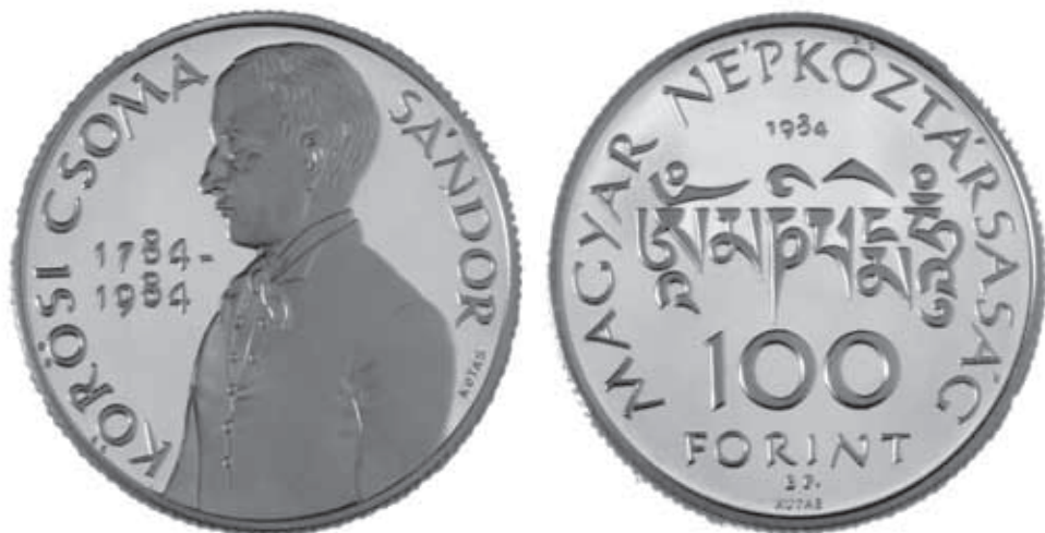
5. kép. Kőrösi Csoma Sándor emlékérmé 1984.

csak angolul valamennyire. A galériának minden évben volt két kiállítása, egy tavaszi és egy őszi. Hivatalos meghívót kaptam tőlük, ennek révén szolgálati útlevelet. Óriási dolog volt ez! Mindig vittem valamit, így lett mára százharminc féle kisplasztikám. Ennyi senkinek sincs. A szakmában van, aki szobrot készít, más kisplasztikát vagy érmekeket. Én tulajdonképpen mindent csinállok: kis szobrot, egész alakosat, emléktáblákat. Eddig több mint hetven kő és bronz szobrom áll köztereken. De szeretem az érmekeket is, nem csak a firenzei díj miatt. Huszonöt emlékpénz pályázatból tizenháromt nyertem meg. Az én munkám az Eötvös József-díj, büszke vagyok a kalapos Bartókra, az ezüst 500 forintosra. A legjobb éremnek közülük a Kőrösi Csomát tartom.