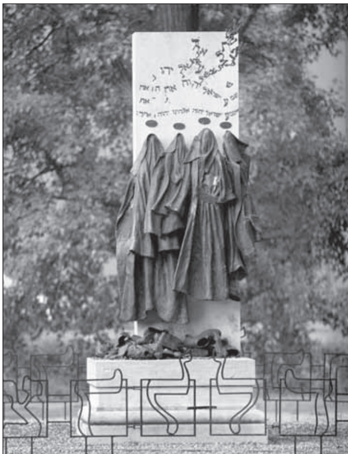
6. kép. A papréti Holokauszt emlékmű 2004.