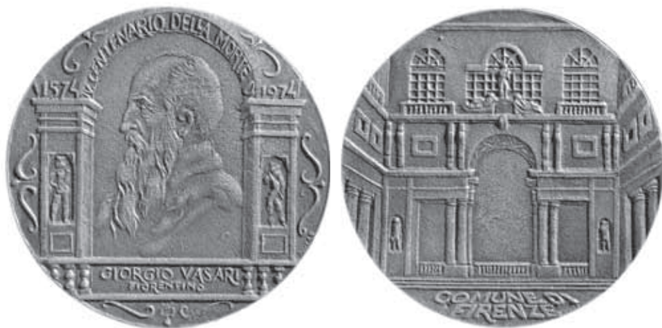
4. kép. A Firenzei Biennálé győztes Vasari érme 1974.

Ez a firenzei Giorgio Vasari érem pályázat első díja volt, amire húsz ország négyszáz szobrásza pályázott. Van, aki máig irigyel érte, sokat köszönhetek ennek az elismerésnek! A ravennai Dante-biennálé zsűritagságát, nemzetközi kapcsolatokat, amik hozzásegítettek ahhoz, hogy külföldi kiállításaim legyenek, utazhassak. Rájöttem a szolgálati útlevél titkaira, és a szobraimnak köszönhetően elkezdtem a világot járni, még jóval a rendszerváltás előtt. A 80-as években megfordultam Amerikában és Japánban, volt olyan év, amikor többet voltam odakint, mint itthon. Bejártam Európát.