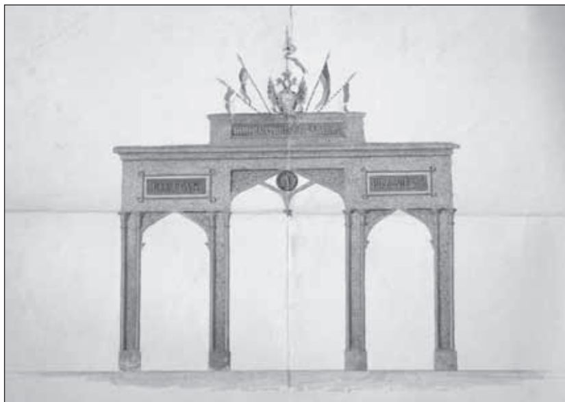
1. kép. Historizáló efemer diadalív. Handler József, 1853. Soproni Levéltár V.13063

hogy a szerkezet 5° – 4' – 3" (öl, láb, hüvelyk) magas és 6° – 5' – 6" széles volt, tehát átszámítva 10,868 méter magas és 13,073 méter széles. Az ívet alapvetően provizórikus állványszerkezetként konstruálták meg. A párhuzamos rendszerű rácsos szerkezet megegyező nézeteit vastagság irányában ismételték meg. A tartószerkezeti elemek anyaga talán fenyő lehetett, mert e fafajtából lehetett ilyen méretben korrekt ácsolt szerkezetet készíteni. A tartóoszlopokat földbe ékelték, ezzel biztosítva állékonyságukat. Ha volt kőburkolat, akkor valószínűleg azt felszedték, majd körülbelül másfél méter mély gödröt ástak. Kavicsrétegre vagy kőzúzalékra állították a tartóoszlopot, s a gödröt feltöltötték (2. kép). 16