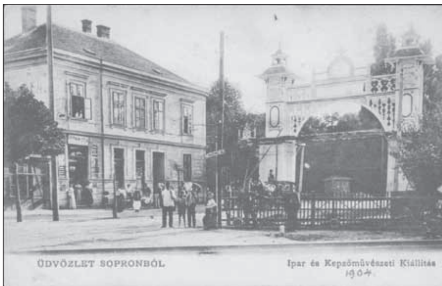
5. kép. Efemer diadalív mint kiállítási kapu 1904-ben

– országonként is eltérő – építészeti törekvéssel találkozunk. 25 Sopronban a historizmus és szecesszió jegyében születő építészeti elképzelések tanúi lehetünk. Az utolsó ismert diadalív 1904-ben állt Sopron városában, az Erzsébet-kerti iparkiállítás alkalmával. Az áttört csipkeszerű fakonstrukció a Kossuth Lajos utca elején állt, tervezője ismeretlen. A szerkezet legérdekesebb része kétségkívül a fűrészelt deszkasorral bélelt ív és attika. A pillérek tetején pagodaszerű toronysisakok (6. kép).