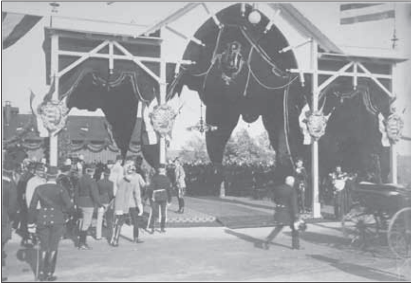
6. kép. Királyváro pavilon Vilmos német császár és I. Ferenc József átutazása tiszteletére a Déli vasútállomáson, 1893. Soproni Levéltár 1/E_VII/1-15

historizáló hangulatának megfelelően többféle stílust keverve és felelevenítve, legyen az gótika, reneszánsz, vagy éppen „magyar stíl” 27 . Komoly tervezőmunkáról ekkor már aligha beszélhetünk. A 19. század végére megjelentek az efemerekre készítésére szakosodott önálló cégek, mint például Rumbold Bernát budapesti építőcége, amely az ország bármely pontjára vállalt diadalív építést. A könnyen szállítható és többször felhasználható szerkezetek egyrésztől praktikus és olcsó megoldást kínáltak, másrésztől azonban uniformizálták az ünnepek installációit. A huszadik század történelmi fordulatainak következtében eredeti funkciójuk súlytalanná vált, kidolgozottságuk és jelentőségük is alulmaradt a korábbi szerkezetekétől.