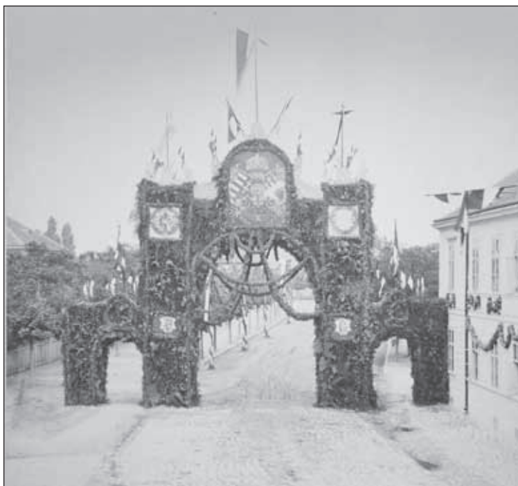
4. kép. Efemer diadalív 1884-ben az Újteleki utcában. Tervező: Hauser Károly, Fotó: Rupprecht Mihály. Soproni Levéltár: 2/S_XV/27.

A szerkezet az utca kövezetének kibontása után, körülbelül egy méternyire a földbe ásták, és faékekkel, kövekkel kiékeltek. (Egy korabeli újsághír a szerkezet elbontása után el is panaszolta, hogy a „diadalkapu felállításakor keletkezett lyukakat csak felületesen tömték be és így azok balesetveszélyesek.” 24 ) Az elkészült vázszerkezetre – hasonlóan az Albert Főherceg köszöntésére emelt 1853-as diadalívhez – növénytartó rácsot, léceket szereltek, melyre a faágakat, gallyakat és a girlandokat rögzítették. A faanyagot a lakompaki erdészettől vásárolták. (Növénnyel borított diadalépítmény már az 1700-as évek francia efemerjei között is gyakori megoldásnak számított. Az örökzöld és a virágdíszítés az édenkertet szimbolizálta.). Falapokra festett palmettás akrotérionok, csúcscsúszék és voluták között Ferenc József és Erzsébet királyné monogramjai, címeri voltak ábrázolva. Az ív felett Magyarország és Sopron város címere, felettük a Szent Korona (5. kép).