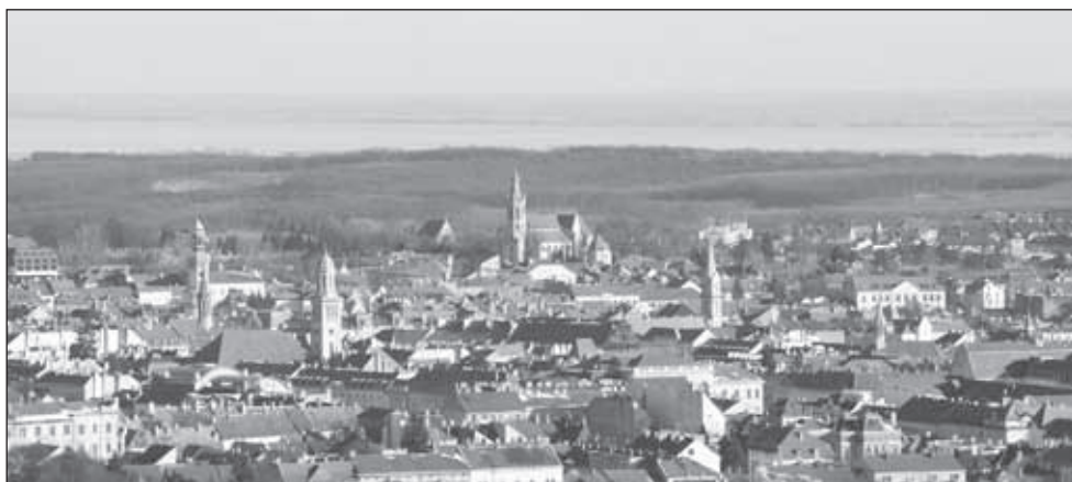
1. kép. A Belváros sziluettje a Sörházdombról. 2015 január

A belvárost a mai napig körbefogja a római alapokra épített középkori várfal-rendszer. A várfal belső oldalára települt házak utcavonala mentén alakult ki a középkorban a belvárosi utcahálózat: a Templom utca és a Szent György utca íve a fallal párhuzamosan fut. Ugyanígy épült ki a fal külső oldalán a 18. századra a Várkerület. A mai városképet tehát – annak ellenére, hogy anyagában csupán néhány helyen látható – a római városfal határozza meg. Ennek a formája tükröződik a belváros mai helyszínrajzában, ez határozza meg az utcák íves vonalvezetését, ebből adódik a folyamatosan változó, festői városkép.