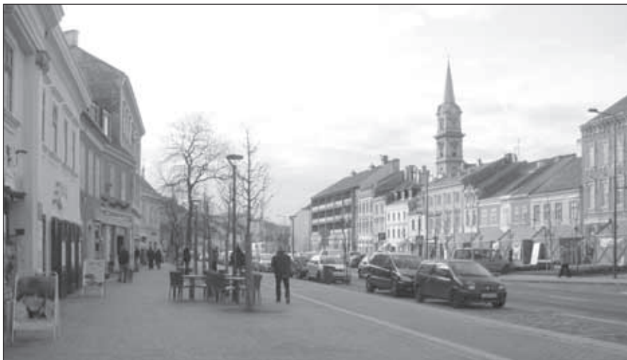
5. kép. A torony látványa a Várkerület északi szakasza felől. 2015 december

is látható (6. kép). A látvány az utca végigjárása során folyamatosan változik: ahogy közeledünk, a templomtorony eltűnik a házak párkánya felett, az utca vonala pedig balra kanyarodik, tehát a látvány fő iránya is elfordul. Pár lépés után azonban a templom másik arca, a főhomlokzat bukkan fel a házak között.