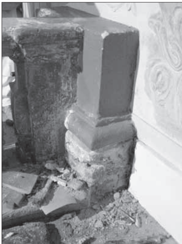
9. kép. Az áldoztatórács a kőfelület restaurálása közben. Jól látható a barokk pilaszter visszafaragott csonkja. 2011 március

őrzi a beavatkozásokat. A legfontosabb változtatás a barokk pilaszterek elbontása, a gótikus bordakötegek kiszabadítása és bemutatása volt. A töredékesen előkerülő bordakötegek közül kettőt rekonstruáltak, ezek ma is a padlóvonalig futnak le, a többit a vállpárkány magasságában konzolosan befördítették (8. kép). A barokk pilaszterek keresztmetszetét az áldoztatórács két végénél megmaradt csonkok alapján ismerjük (9. kép). További középkori részletek is bemutatásra kerültek: a szentély hármastűs ülőfülkéje, alatta a négykaréjos vakmérművekkel, és a déli oldal egy hasonló motívuma a második és harmadik kápolna közötti pilléren. Az elbontott barokk pilaszterek helyén, ahova nem kerültek vissza a gótikus profilok, Szakál Ernő által készített keresztúti stációkat ábrázoló domborműveket helyeztek el, körülöttük a rokokó stukkó szellemiségében megfogalmazott stukkódíszek készültek.