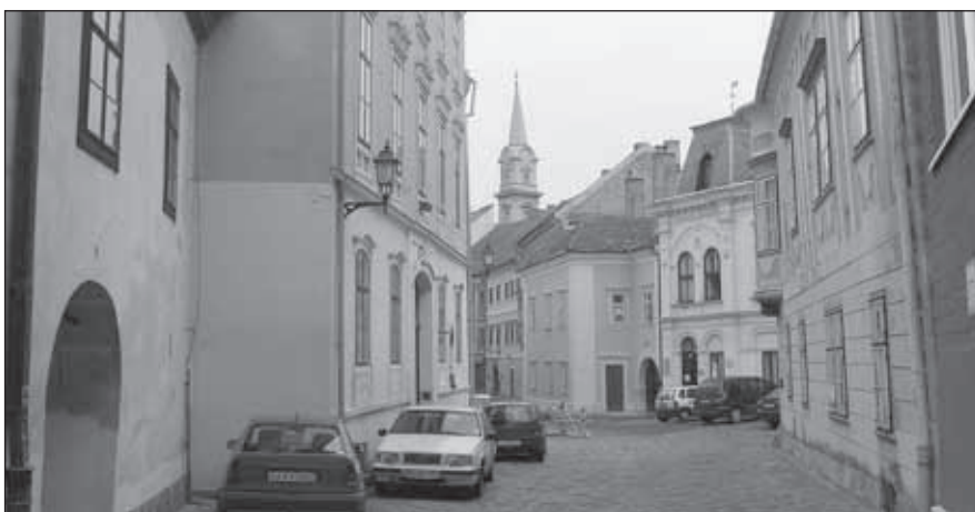
6. kép. A Szent György utca az Orsolya tér felől. Az utca tengelyében megjelenő torony a városkép meghatározó eleme. 2009 január

A barokk homlokzat a középkorira épült rá. A gótikus épület kontúráját a műemléki helyreállítás során bekarcolták a homlokzatba, ha figyelmesen szemléljük észrevehető a támpillérek élén, valamint fenn az oromzaton. 9 Első pillantásra is jól látható azonban a két 45 fokos szögben álló támpillér, valamint a barokk kori kapuzatok párkánya felett a helyreállítás során kibontott és bemutatott csúcsíves kapuzáródás, a kaputimpanonokban gótikus domborművekkel. 10 A barokk kapuzatok felett volutákkal közrefogott fekvő ellipszis alakú ablakok voltak, háromszögű timpanon lezárással. 11 A barokk tagozatok részbeni feláldozása az alatta levő középkori részletek bemutatathatósága érdekében a korszak műemlék-helyreállításának jellegzetes gondolkodásmódját mutatja. A tervezőnek mesterien sikerült a két korszak bemutatásának arányát megtalálni, mérlegelve azt, hogy milyen értéket minek az érdekében kell elbontani. A 20. század közepén még egyértelműen a középkori emlékek bemutatásának szándéka élvezett elsőbbséget. A 19. századi purizmussal szemben azonban itt csupán annyit vettek el a barokk homlokzatból, hogy annak összképe jelentősen ne változzon meg, ugyanakkor a templom korábbi építési korszaka is egyértelműen érzékeltethető legyen. 12