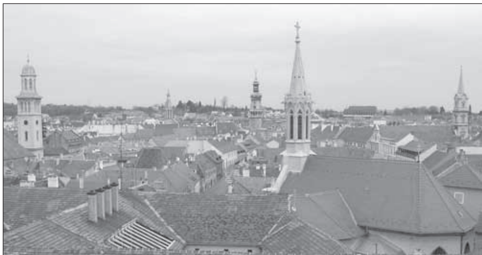
2. kép. A Belváros tornyai az Orsolya téri csillagvizsgálóból. 2007 február

Lejjebb ereszkedve, de még mindig a belvárosi háztetők fölött maradva, a Tűztorony loggiájáról vagy az Orsolya téri csillagvizsgálóból a belvárosra tekintve a torony már fölénk magasodik, átböki a horizontvonalat, érezzük magasságát, tömegét (2. kép). Az evangélikus templom tornyából szinte karnyújtásnyira látjuk a homlokzatot és mögötte a tornyot. Ez az egyetlen nézőpont, ahonnan a templom mindkét látványeleme együtt látható (3. kép).