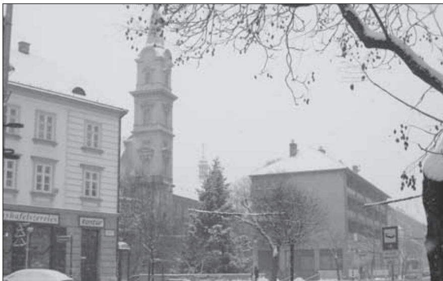
4. kép. A térfal megszakításával kialakított Bástyá tér. A Szent György-templom tornya uralja a városképet, mögötte a Tűztorony sisakja. 2010 január

világháborús bombázások során megsemmisült, 6 a tér egy város-seb helyén alakult ki. Ugyanakkor be kell látnunk azt is, hogy a hatvanas évek szakemberei felismerték a térfal eltűnésével a városfal, a Nagyrondella, és felette a Szent György-templom tornya által meghatározott városkép festőiségét, és ennek a látványnak az érvényre juttatása határozta meg döntésüket, ami szerint a térfalat nem állítják vissza. A látvány őket igazolja, a fiatalabb generációnak – közvetlen emlékei nem lévén – már nem hiányzik a térfal, az innen feltáruló városkép, melyben a templomtorny mellett a Tűztorony sisakja is megjelenik, Sopron egyik szimbólumává vált (4. kép). A Várkerület északi szakaszán alacsonyabbak a házak, innen sokkal jobban érvényesül a torony látványa, mely a városkép meghatározó elemévé válik (5. kép).