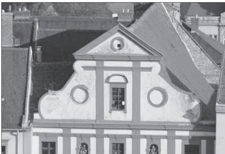
7. kép. A templom oromzata az evangélikus templom tornyából nézve. Az oromzatot lezáró timpanonos párkány golyvázódó koronázópárkánya alatt, a megszakadó architráv mellett jól láthatóan hiányzik egy alátámasztó építészeti elem. 2012 november

A második szinten a homlokzat már egy síkban folytatódik, vastkos pilaszterek tagolják öt szakaszra. A két szélső és a középső tengelyben a padlástérbe nyíló egyenes záródású ablakok, közöttük félköríves szoborfülkék. A fülkékben elhelyezett szobrok hangsúlyos plasztikus elemei a homlokzatnak. A szintet arányaival a teljes magassághoz igazított háromrészes, golyvázott főpárkány zárja le.