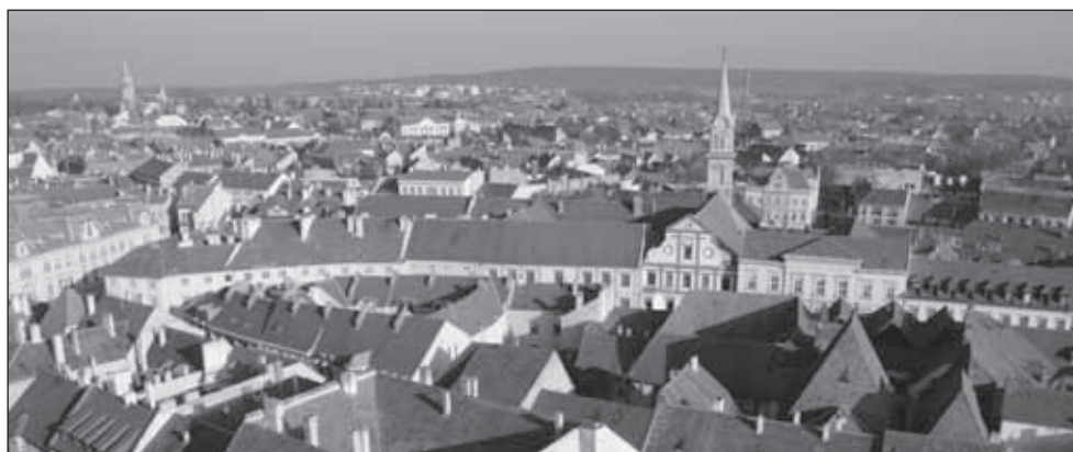
3. kép. A Szent György-templom látványa az Evangélikus templom tornyából. 2012 november

A város tornyaiból való látvány nem tartozik a mindennapi nézőpontjaink közé. Az utcákon sétálva, a természetes magasságból a torony már nem látható a város minden pontjáról, hiszen az épületek, a térfalak kitakarják. Sétáljunk végig gondolatban a Belvároson és nézzük meg, hogy melyik utcaszakaszok, melyik városképek hangulatában játszik meghatározó – vagy éppen mellékszerepet – a torony.