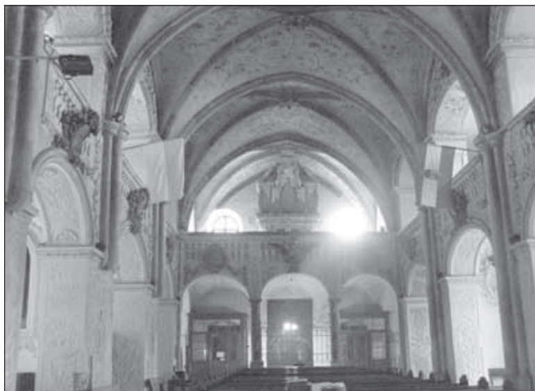
8. kép. A templombelső mai képe. Jobb oldalon a rekonstruált, padlóg vezetett gótikus bordakötegek, balra pedig a konzolosan befordított bordák láthatók. Alattuk a keresztúti stációk domborművei, rokokó szellemben fogant, 1940-es évek végéről származó stukkókkal övezve. 2010 november

tettel arra, hogy az egyszerű karbantartási munkákat 14 leszámítva a felújítás utáni állapot a legkritikább esetben egyezik meg az épület történetében egyszer korábban már fennállott állapottal, azt kell mondanunk, hogy szinte minden esetben új építészeti alkotásról beszélhetünk. Az egyszerű karbantartási munkák nagyságrendjét meghaladó változtatás már megváltoztatja az épület építészeti megjelenését, tehát kisebb vagy nagyobb mértékben új építészeti alkotást hoz létre. Az új építészeti alkotás elvben megegyezhet az épület valamely korábbi állapotával, de ezekben az esetekben nagyon ritka az, hogy a korábbi állapot minden részletét hitelesen rekonstruálható módon ismerjük. Az újonnan kialakuló építészeti alkotás szerencsés esetben az épület műemléki értékű részleteit megőrzi, azokat az új épületbe belekomponálja.