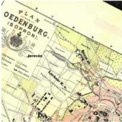
2. ábra: A bécsi országút hatása a beépítésre (Plan von Ödenburg, 1891; műholdfelvétel, 2005, NYME EMK GEVI)