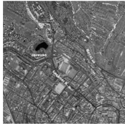
3. ábra: A Virágölgy egykor és ma: az 1856-os kataszteri térkép telekvonalai a 2005-ben készült műholdfelvételre vetítve