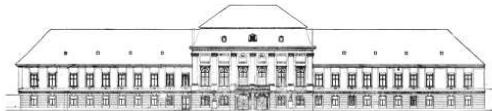
2. kép. A csornai prépostság nyugati homlokzata a déli szárny tervezett bontása után (Csatkai – Dercsényi 195.3, 410 alapján)

A műemléki hatóság ebben az időben még azt szorgalmazta, hogy a később épült déli szárnyat egy szerkezeti egység teljes bontásával válasszák le a késő barokk épület tömbjétől. 12 Erről a megoldásról később a megbízóval egyetértve lemondtak. A 19. század derekán az emeletes szárnyakhoz hozzáépített saroktoldások – utólagosan kialakított mosdók – lebontásában mindenki egyetértett. Ezek az épületrészek nem kapcsolódtak szervesen az épülethez, homlokzatukat szerény, gótizáló vakolati ornamentika díszítette. Bontásuk után a korábban a padlástér által takart homlokzati felületeken előtűnt az épület eredeti, 19. század elején felhordott sárga színezése. A helyreállítás során ezeket a színeket használtuk a felületek megújítására.