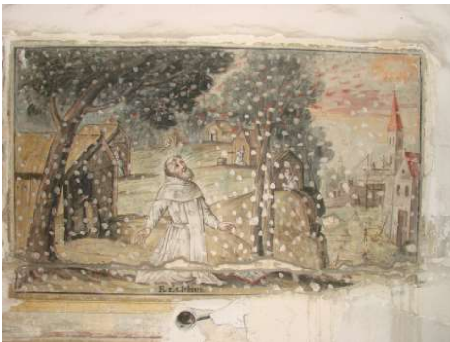
6. kép. Szent Özséb. Falfestmény a bánfalvi pálos kolostor refektóriumának oldalfalán.

Igényes kialakítású a kolostor északkeleti sarkánál lévő lépcső fordulójának boltozatán a díszítés, ahol a szalagkeretes mező közepén húzott keret látható, a négy sarokban pedig egy-egy szívmotívum van. A rövidebb, alsó lépcsőszakasz feletti boltozaton egy, a hosszabb, felső dongaboltozatos lépcsőszakasz felett pedig két sarkos négykaréj látható.