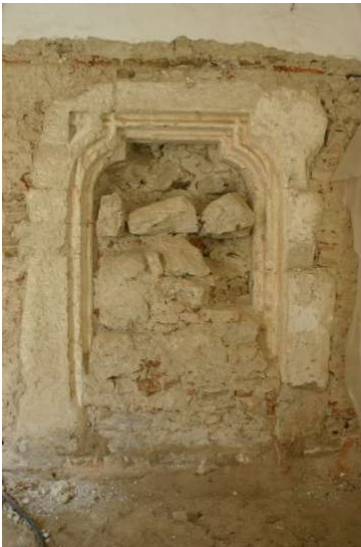
2. kép. Sopronbánfalva, pálos kolostor. Gótikus ajtó a templomhajó keleti falában.

A pálos rendház a 16–17. században a történeti források tükrében