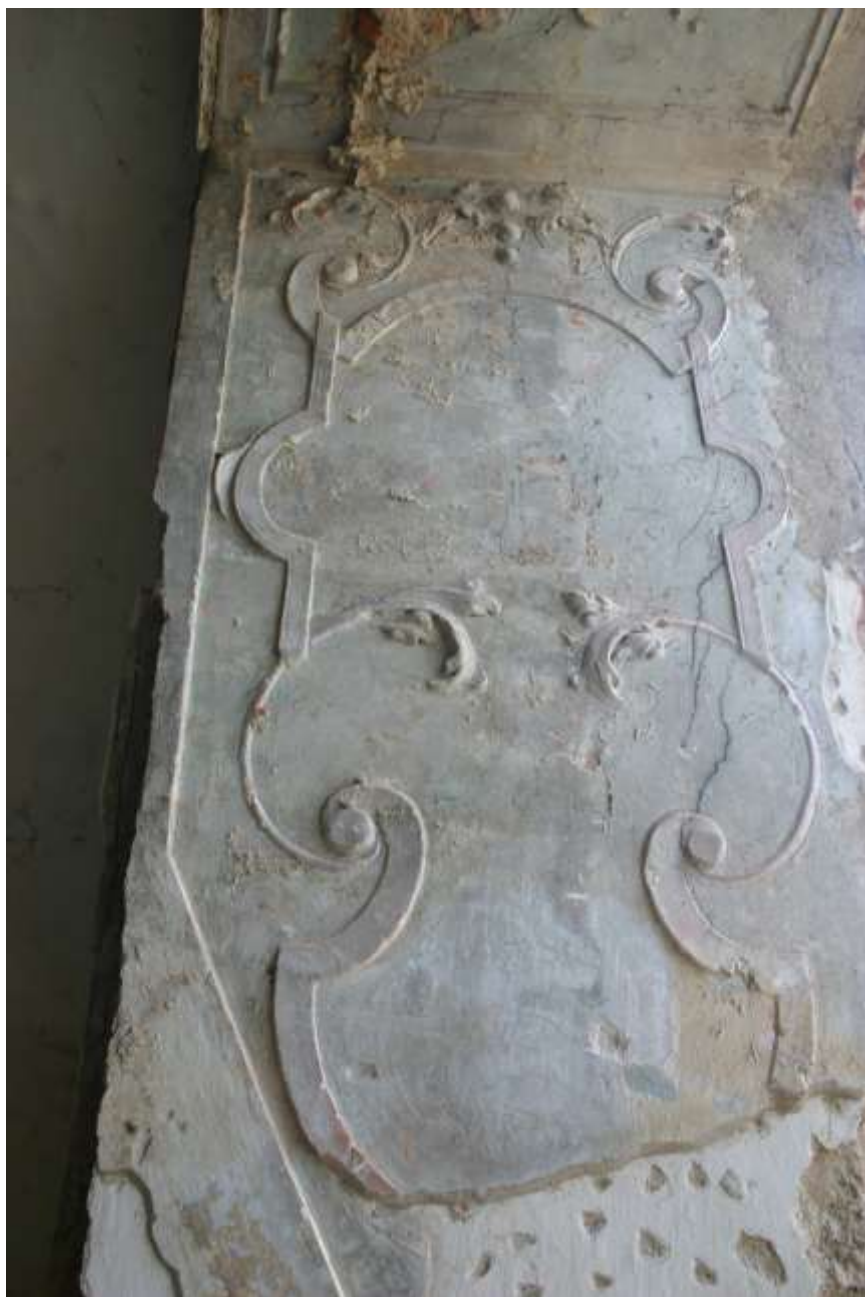
3. kép. Sopronbánfalva, pálos kolostor. A refektórium stukkójának részlete.