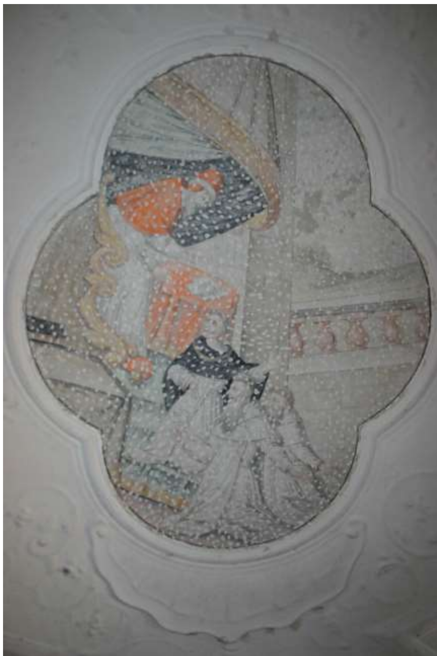
5. kép. A pálos rend pápa általi megerősítése. Falfestmény a bánfalvi pálos kolostor refektóriumában.