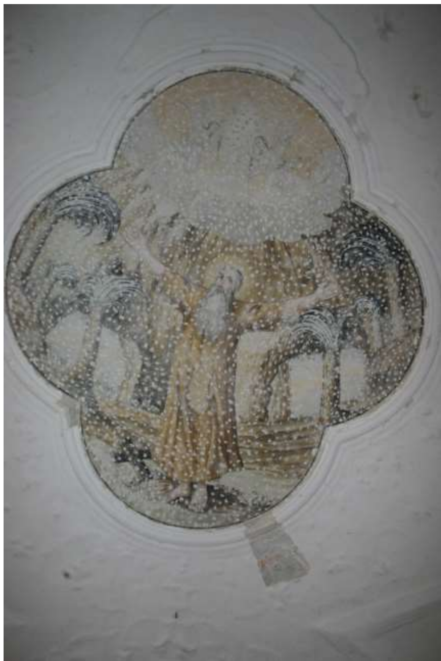
4. kép. Remete Szent Pál. Falfestmény a bánfalvi pálos kolostor refektóriumának boltozatán.