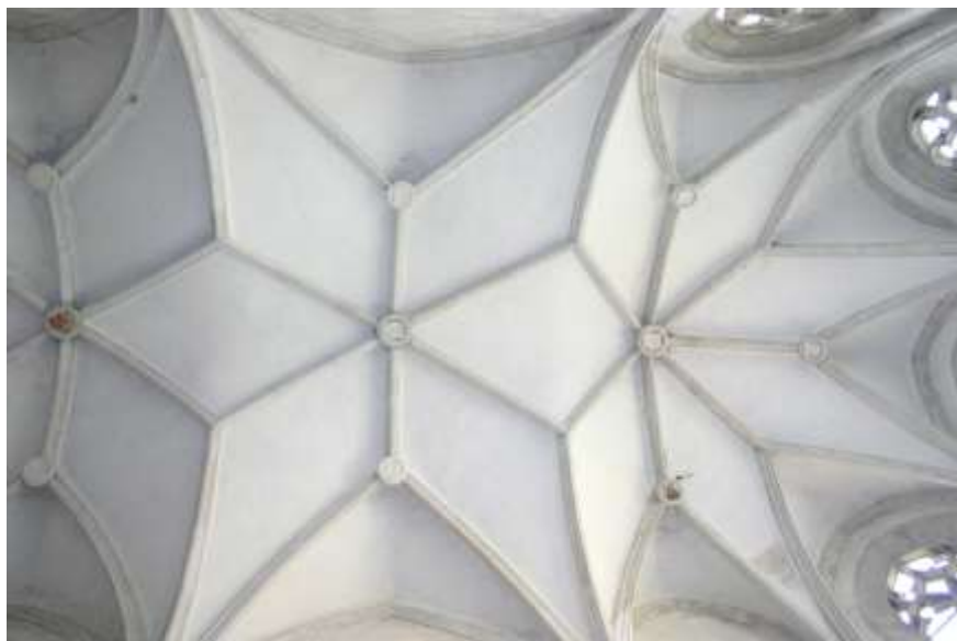
1. kép. Sopronbánfalva, pálos kolostor. A szentély gótikus boltozata.

negyven napos búcsúban részesítette. 9 A búcsújáráhely népszerűségét az is fokozta, hogy a rendi feljegyzés szerint a szerzetesek 1483-ban a csestochowai kegykép mintájára festett Mária-ikont hoztak. 10 A templom szentélyében látható kegykép a csestochowai kép egyik legkorábbi másolata lehet. 11 Házi szerint a kápolna élén kezdetben világi oltárigazgatók és plébánosok álltak, mígnem ez a tisztség 1520 körül a pálosok kezébe került. 12 A kolostor krónikája szerint az 1483-at követő években felépült ( rudi arte ) a kolostor és az elég nagy templom. 13