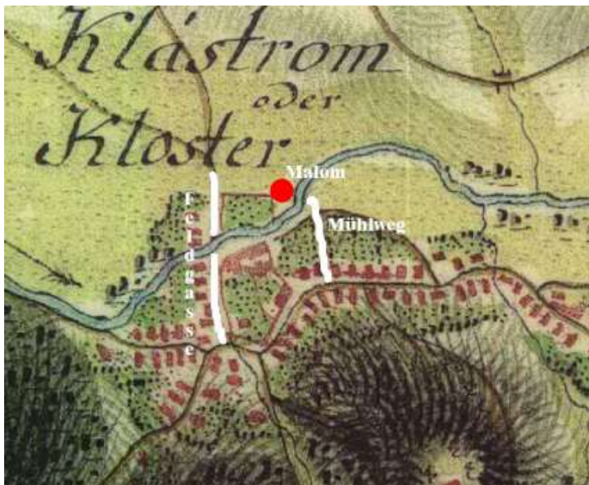
2. kép. Borsmonostor (Klostermarienberg) a kolostorudvar területével az 1. katonai felmérésen

mellett, visszakanyarodva a Répce déli partjára. A kolostorudvar eredeti határa keleten esetleg kijebb is lehetett (ti. a mai Mühlweg mentén), mint ahogy az a katonai felméréseken látható (2. kép).