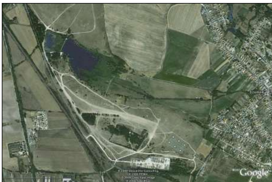
5. kép. Szomód – a malomhellyel, illetve a grangia feltételezett helyzete a Google műholdfelvételen

Gazdasági jellegű iratok hiányában az is eleve kérdéses, hogy az egyes majorságok esetleg specializálódtak-e bizonyos gazdálkodási ágakra – hiszen a táj, a környezet adta lehetőségekkel számoló gyakorlat a külföldi példák alapján