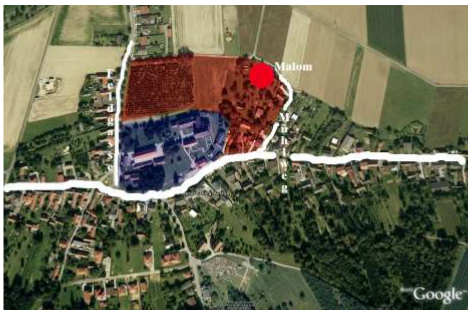
1. kép. Borsmonostor (Klostermarienberg) a kolostorudvar területével a Google műholdfelvételén

1671-ig a protestáns Nádasdyak tulajdonában maradt, akik már csak a majorokat működtették. Birtokaikról részletes urbárium készült 1608-ban, 1647-ben pedig a rend részéről vizitáltak, illetve vagyonleltár is készült. 1672–76 között az uradalom Draskovich Miklós, 19 majd Esterházy Pál birtokába került, aki 1680-ban Borsmonostort magát visszaajándékozta Lilienfeld számára, de a többi falu az ő tulajdonában maradt. 20