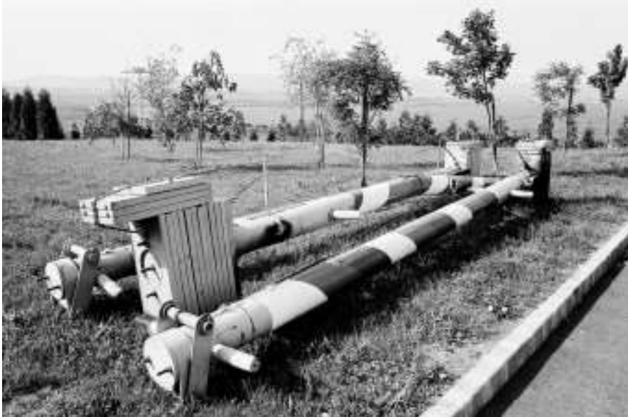
3. kép. Leszerelt határsorompók.

egyre inkább került volna, hogy az akkor igazán fontos lépésekbe beavassa őket. Más irányból közelítve: épp úgy demoralizáló volt számukra, hogy egyfelől munkájuk alanyai és tárgyai – a megfigyeltek – egyre kevésbé méltóztattak félni tőlük, másfelől pedig munkaadóik, a hatalom ismert reprezentánsai azokkal „paktáltak”, akiket nekik megbízhatatlanokként, horribile dictu „ellenségként” kellett szemmel tartaniuk. A kommunista állambiztonsági szervek kényszeredetten és fokozatosan benuvva nézték a vasfüggöny egyre gyorsuló erodálódását, az addig ennek révén biztosított tevékenységi köreik elenyészését, miközben az átalakításban részt vállaló politikai elit is a rendszerváltási deficit egyik „nem kár értük” tételeként tekintett rájuk.