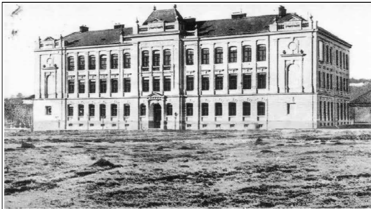
2. kép. Az ág. h. ev. főgimnázium épülete Felsőlövön, megnyílt 1911-ben