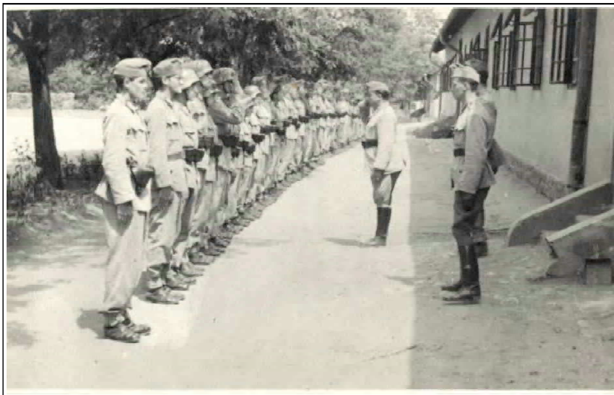
5. kép: Szabadságkérés az esztergomi táborban az Akadémia utolsó évében

45320 éves volt akkor. Sok beosztottja idősebb lehetett Magánál.