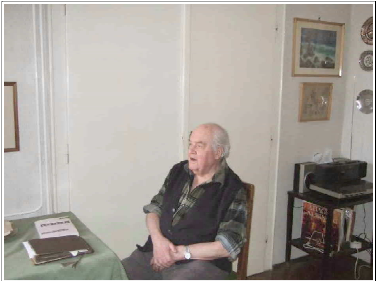
9. kép: Otthonában, az interjú készítésekor (2006 március)