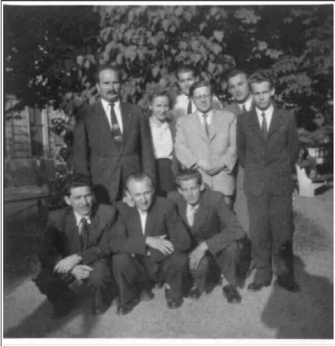
4596. kép: A dolgozók textilipari technikumának növendékei.

Amikor a soproni gyárat 1965-ben összevonták a szombathelyivel, oda helyezték. Annak idején Kádár megígérte Szombathelynek az iparfejlesztést, így a szombathelyi takarógyárhoz, vagyis a gombhoz varrták a kabátot. Ott lett a központ, annak ellenére, hogy műszakilag sokkal fejletlenebb volt, mint a soproni gyár. A szállítást még 1964-ben is lovas kocsival végezték.