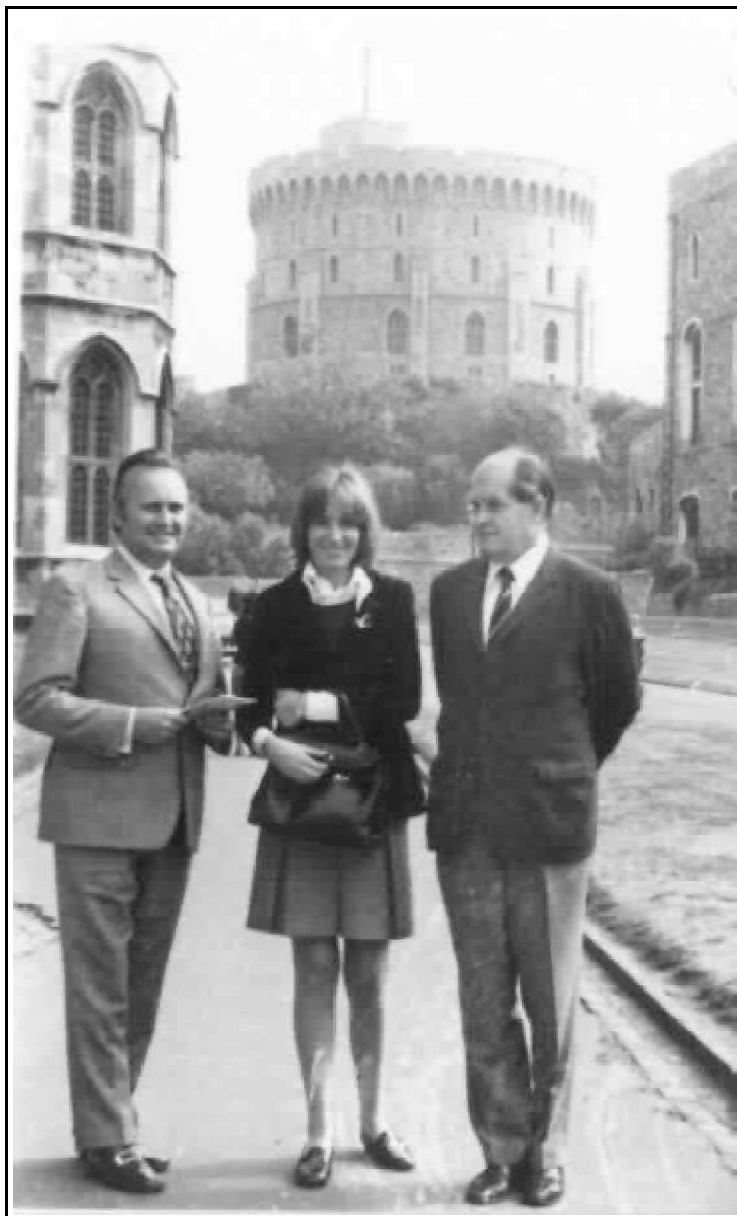
7. kép: Munkahelyi úton Windsorbán, 1972.