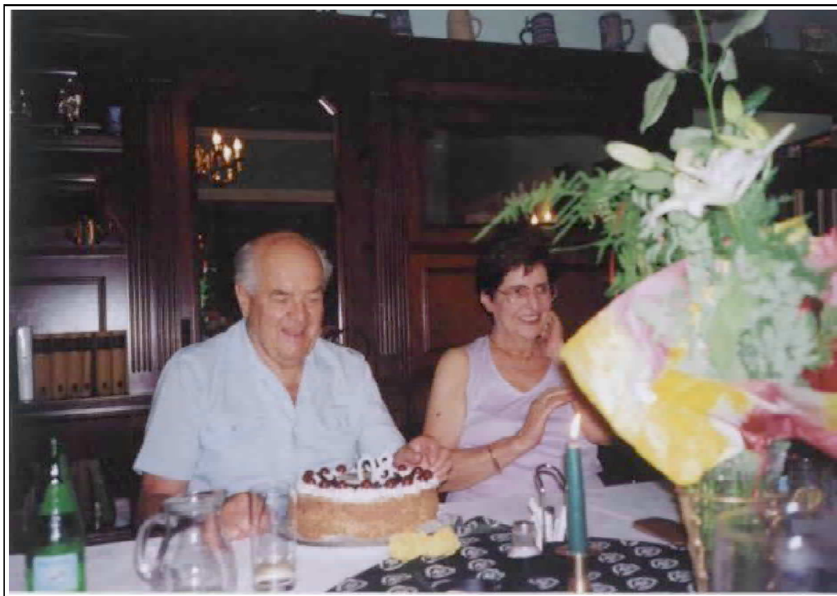
8. kép: Feleségével a 80. születésnapon, 2003.