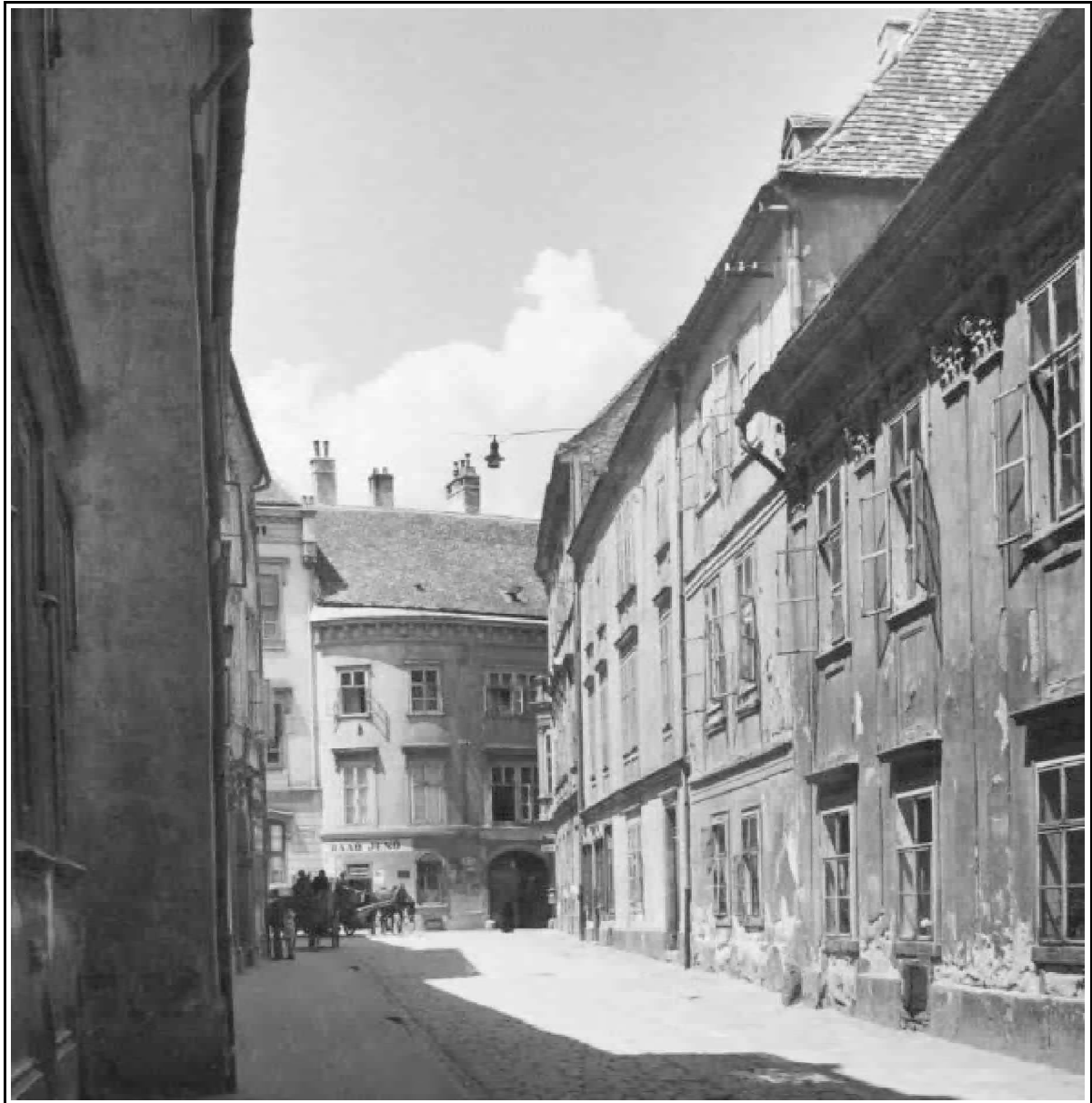
214 Sopron, Fegyvertár utca 1945 előtt. (Diebold K. felv. 1943. k., Kulturális Örökségvédelmi Hivatal [KÖH] Fényképtár 29.139)