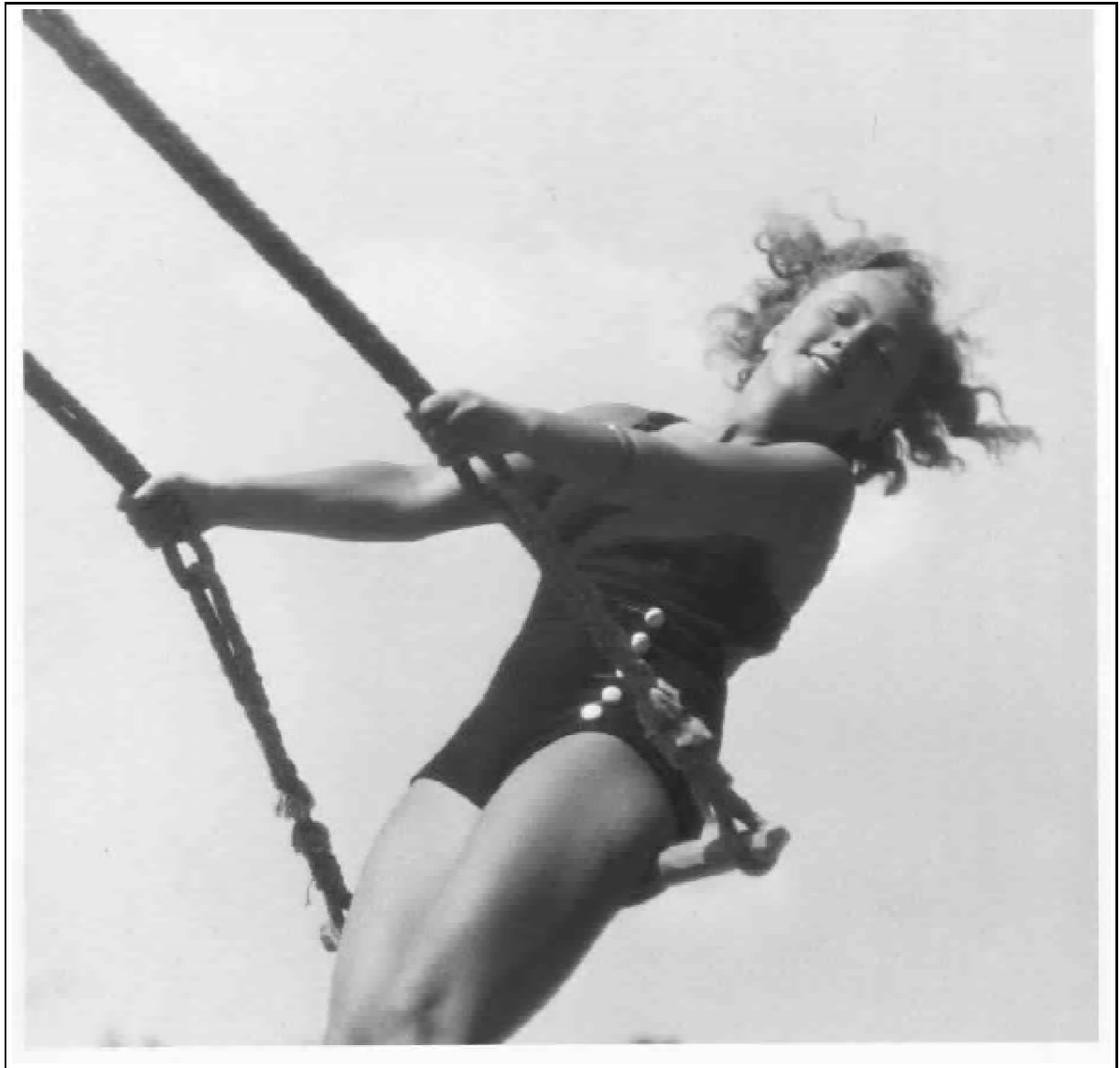
"Schwung" (Lendület).