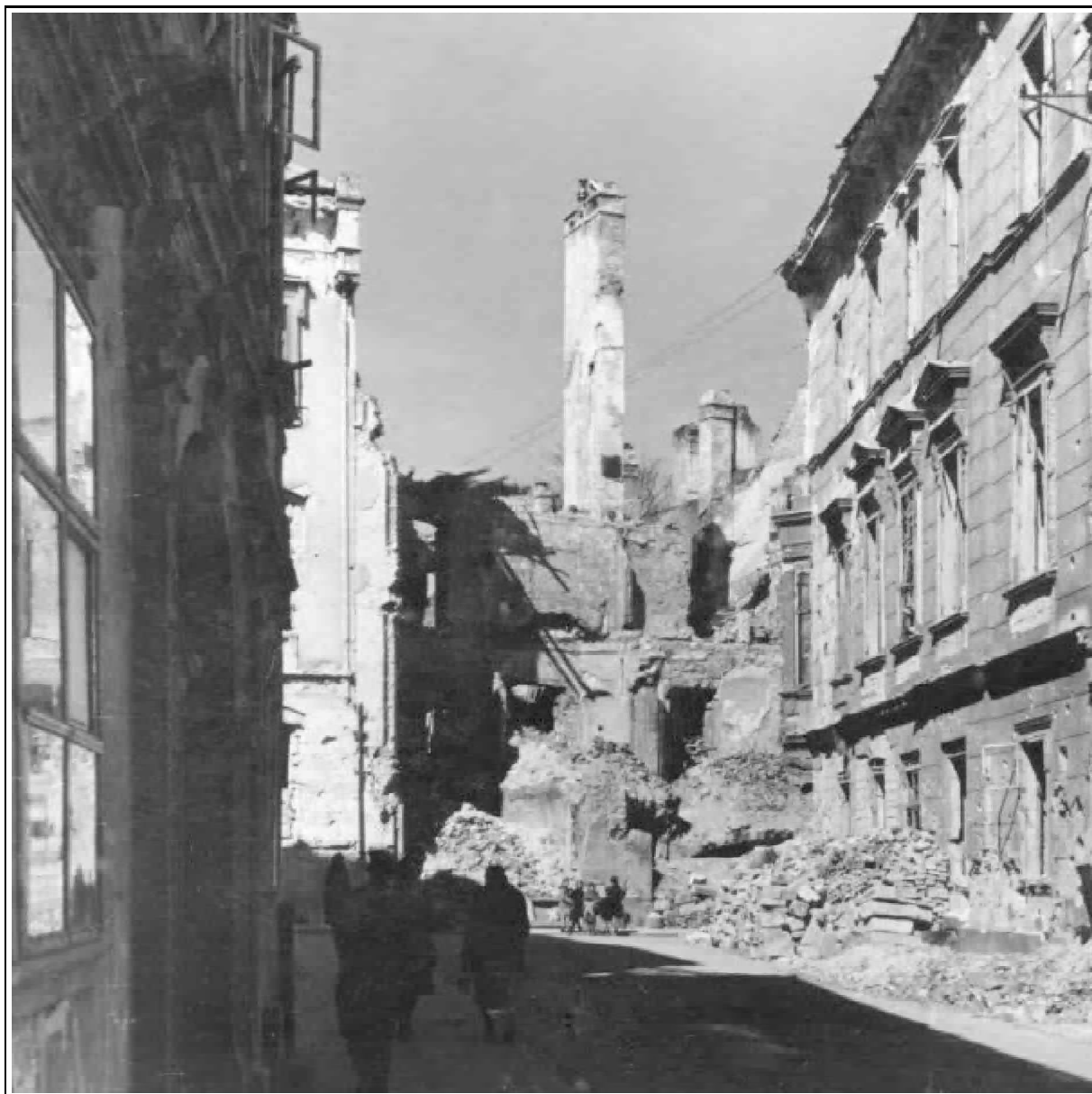
Sopron, Fegyvertár utca 1945-ben. (Diebold K. felv. 1945., KÖH Fényképtár 29.139)

215 Mindez rendben is volna, de a kérdést továbbra sem tudjuk lezárni. Milyen ismérvek alapján lehet megállapítani azt, hogy az életműben melyik a jó fénykép és melyik a rossz? Rövid ideig úgy tűnt, hogy pusztán a technikai ismérvek alapján is el lehet dönteni a kérdést. Ez a felfogás azonban hamar csődöt mondott, és kialakult egy jóval átfogóbb elképzelés, ami a fotós látását helyezte az ítélkezés középpontjába, és a nem a szépséget. Ma már semmiféle téma és semmiféle technika nem vonhatja el a fényképtől a létezés jogát. Különösen érvényes ez a múzeumokra hagyott fényképhagyatékokra, mert azoknak szinte minden egyes darabja más és más. Az egyik alulexponált, a másik nem. Ilyen esetekben a téma érdekessége lehet az értékelés szempontja, nem is beszélve a felvételek dokumentatív jelentőségéről.