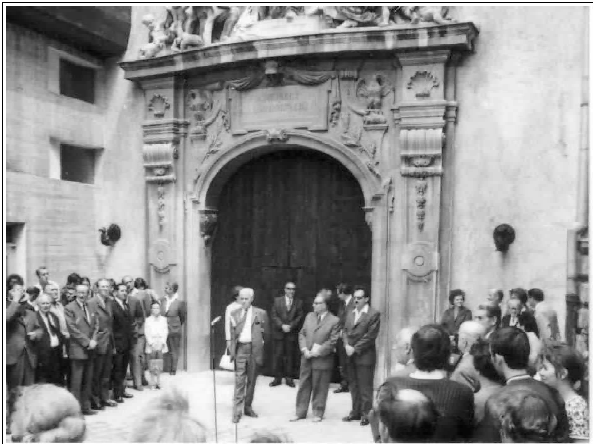
1. kép A helyreállított Tűztorony avatási ünnepsége 1973. július 5.