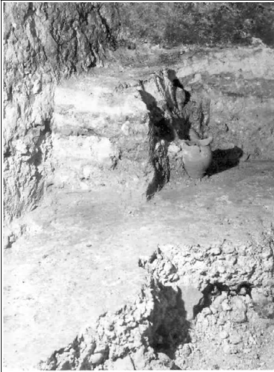
3. kép A Fabricius-ház utcai pincéje, barokk építési áldozat edénye a római kori terrazzora állítva