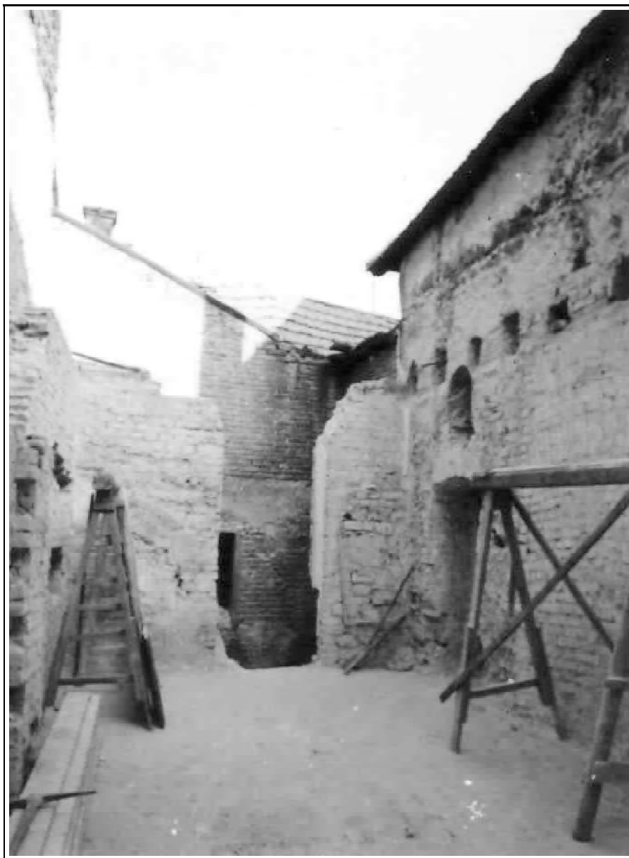
5. kép A zsinagóga külső fala feltárás közben (Új utca 22-24.; 1972)