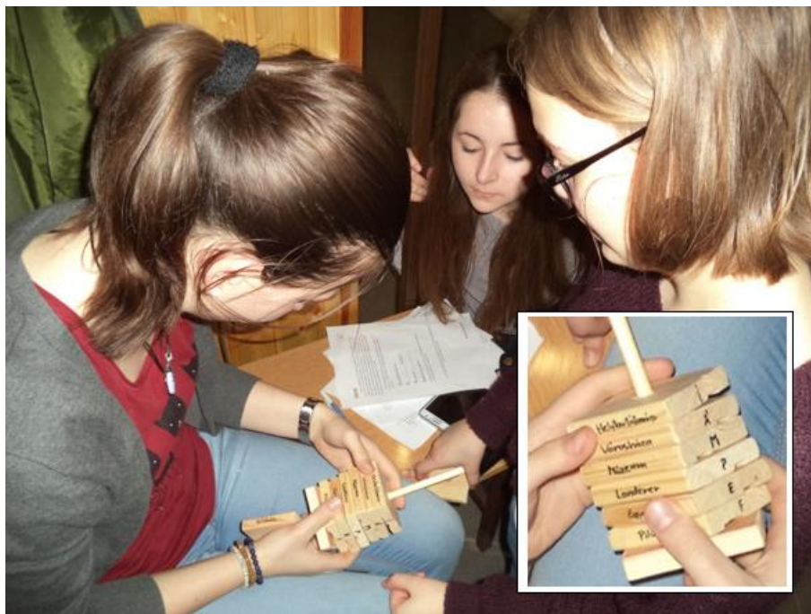
2. kép: Hogy is történt? Mi lehet a következő állomás?

Egy következő állomás iskolánk kollégiumának klubhelyiségében került berendezésre. A terem tökéletesen elsötétítettük, így igyekeztük bemutatni, milyen lehetett egy föld alatti börtöncella. A versenyzőknek tapogatózva kellett megtalálni egy „rabort”, akitől megkapták a következő utalást rejtő zsákot. A zsákból előkerülő fa lapokat egy tengelyre kellett felfűzniük Petőfiék március 15-ei helyszíneinek helyes sorrendjében. A 7 falapot ezután addig kellett forgatni, míg ki nem adta a következő állomás helyszínét. (2. kép)