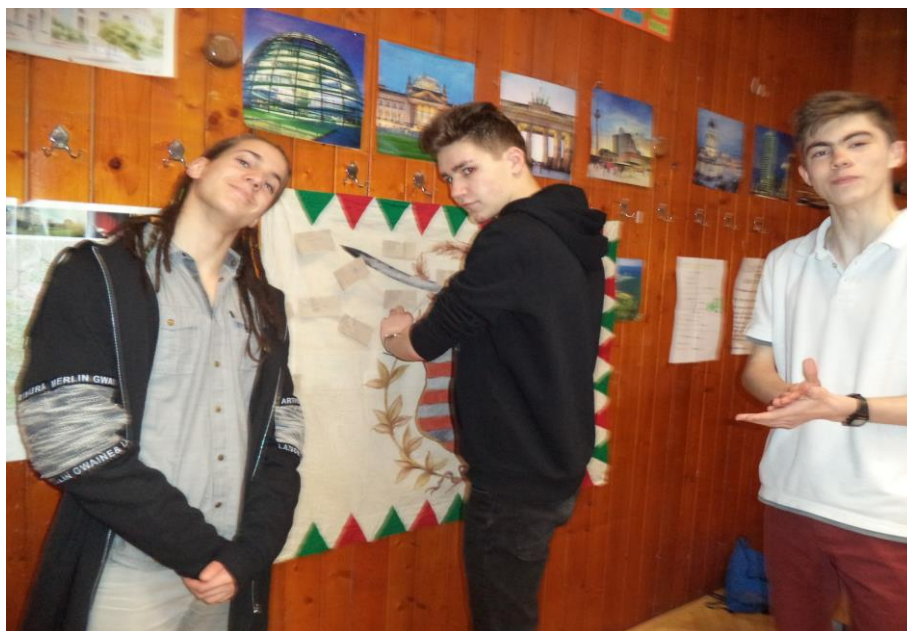
4. kép: A cél a megtalált hadilobogó