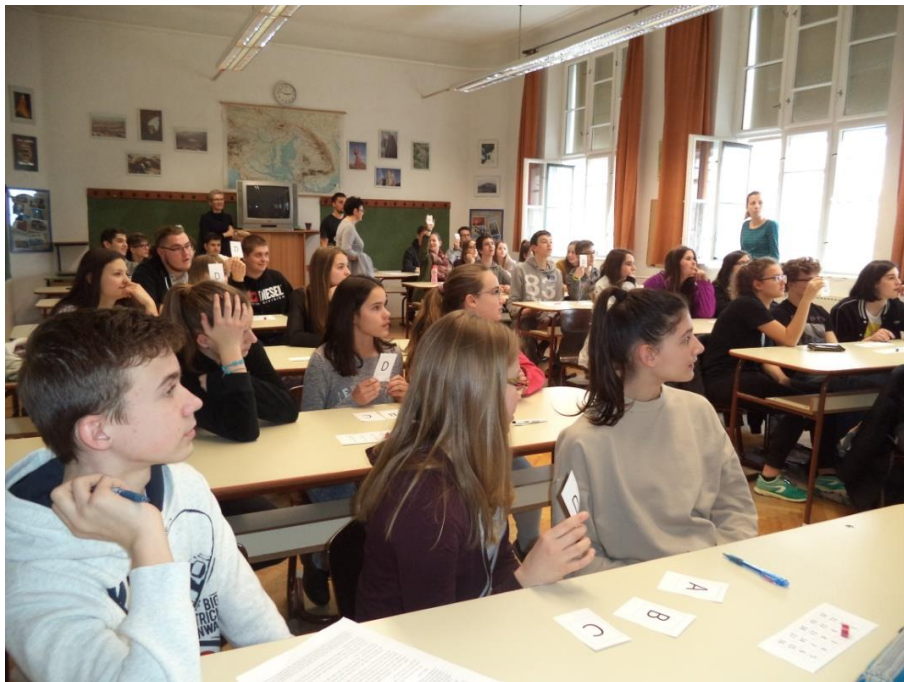
3. kép: Kezdődik a történelmi kaland ... Indul a kvíz

Reményeink szerint a továbbiakban is kitart az alkotói kedv, és a fiatalok pozitív hozzáállása. Szeretnénk ugyanis folytatni a kalandversenyek sorát.