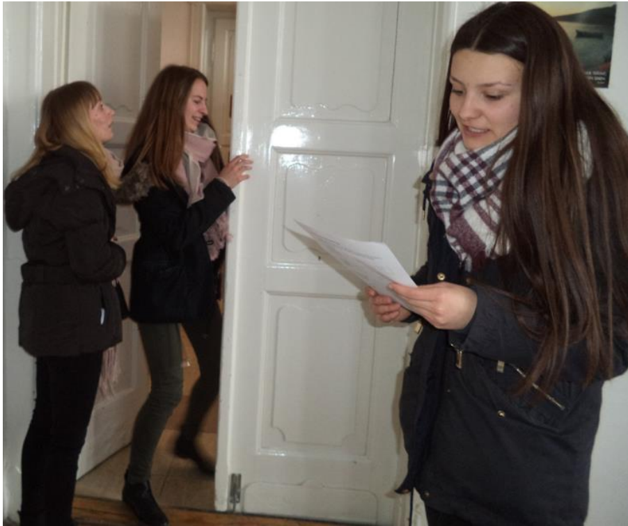
1. kép: Kódfejtés közben / Megfejtés: AJTÓ (3. melléklet)

A kalandverseny első állomása mindig egy történelmi kvíz (3. kép), majd a háromfős csapatok útnak indulnak az iskolában, ahol nyolc állomáson keresztül vezet az útvonal. Legfontosabb feladatuk, hogy kiderítsék, hol találják a következő állomást. Ehhez talányokat, kódokat, rejtvényeket kell, hogy megfejtsenek, illetve utalásokat helyesen értelmezzenek stb. (1. kép) Mindenütt más és más típusú feladat vár rájuk. Az állomásokon feladatlapokat is kapnak, melyeket a végállomáson kell kitöltve leadniuk. A verseny időre megy. Amikor egy csapat megtalálja a célt, felírjuk a játékban töltött idejét, majd hozzáadjuk a feladatlapok hibás megoldásaiért járó időbüntetést. Ezáltal kialakul a végső sorrend, és a verseny objektíven értékelhetővé válik.