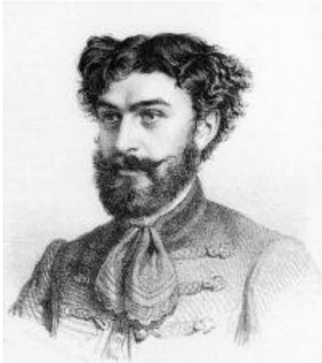
7. kép: Thaly Kálmán (1839–1909)

különösen annak leglényegesebb részei: „nem ... megalázó”, „a hősök tusája nem maradt meddő” szinte parafrázisa Thaly, illetve Acsády véleményének, s egyben bizonyítéka annak is, hogy a századforduló tankönyvei már hű tükörképét mutatják a korabeli tudománynak.