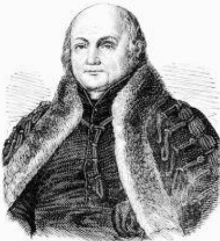
2. kép: Budai Ézsaiás (1766–1841)

A közoktatást azonban nagymértékben meghatározta a politika. Az iskolaügy – Mária Terézia híres kijelentését idézve – „politikum”, azaz államhatalmi kérdés. És ez az általunk tárgyalt időszakokra szinte végig érvényes. Vegyük például a XVIII. század legsikeresebb magyar tankönyvét, a Losontzi István által 1773-ban készített Hármas Kis Tükört (TANKÖNYVTÁR 1.) 4 , mely népiskolai tanulók számára íródott. Mit ír ez a munka a Rákóczi-szabadságharcról? Nem sokat! „ Ennek [ti. Leopoldus, azaz I. Lipót] idejében támadott-fel Rákóczi Ferentz Bertsényi Miklóssal 1703. és sok pusztításokat kezdett tenni az Országban, de e' szélvész-is idővel a' Királyi hatalom le-tsenedesítette. ” 5 Majd – ez a nem túl szívderítő kép – Iosephus I., azaz I. Józsefnél azzal folytatódik, hogy „ Birodalmának kezdetében azon volt, hogy a' Magyarokat le-tsenedesítse az Angliai és Hollándiai követek által: de a' Magyarok Jósef Királynak kegyelmes ígéreteit meg-vetvén, tovább is folytatták a' hadakozást, nem kevés károkkal: mert Trentsin táján igen meg-megverettenek, G. Heister, és Pálfi János Vezérek által 1708. Eszt. ” 6 Carolus VI., azaz VI. Károly „ Spanyol Országból