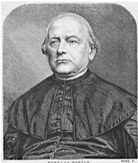
5. kép: Horváth Mihály (1809–1878), a „demokrácia történetírója”

Immár a katolikus történetírók tankönyvei sem egyértelműen Habsburg-pártiak, bár kétségkívül „visszafogottabbak”, időnként saját egyházuk múltját illetően is. A piarista Spányik Glycér például tankönyvében (TANKÖNYVTÁR 3.) 20 , melyben a szabadságharc előzményeinek ismertetése bizonyos megértést, sőt burkolt rokonszenvet árul el Rákóczi és hívei iránt. A következőket sorolja fel: A törökkel kötött béke megtárgyalására egy magyart sem hívtak meg; a Habsburg-ház örökösödési jogának megállapítása, az ellenállási jog eltörlése, a papi és világi hivatalok idegenekkel való betöltése, az állandó adózás bevezetése, a külföldi katonaságnak az országban való állomásoztatása; hogy “a Protestánsoktól újra sok templom elvételét, s a Protestánsok által lakott városokban a Jezsuitáknak Collegiumok és Gymnasiumok építtettek, s más több efélék a nemzet