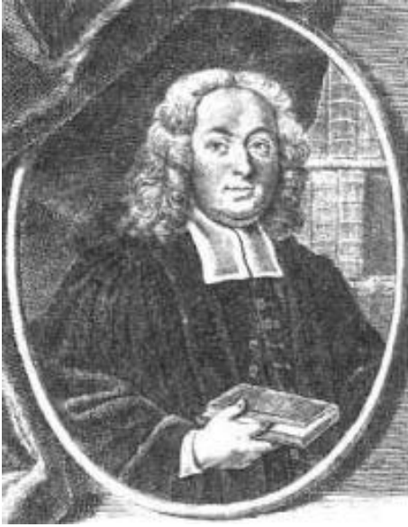
1. kép: Béla Mátyás (1684–1749)

Ami a Rákóczi-szabadságharc XVIII. századi történetírói feldolgozását illeti, azokat meghatározta, hogy nem a kor békekötési normái szerint fejeződött be az összecsapás. Egyrészt a Habsburg kormányzat elvárásai csak részben érvényesültek, másrészt I. József császár váratlan halálát eltitkolva hozták a megállapodást tető alá. „A század folyamán két szemlélet, a folyamatosság és felvilágosodás tengelyén alakultak ki az első történeti összefoglalások. A század első felében általában a folyamatosság, mint legfőbb érték kategória érvényesül ...”, míg, „A század utolsó évtizedeiben már nyilvánvaló, hogy olyan alapvető kérdések várnak megoldásra, amelyeket a Rákóczi-szabadságharc idején már elrendeztek, mint a vallási tolerancia, a nemesség közteher-vállalási kötelezettsége, a közhatalmi jobbjogvédelem, Erdély és az országegység, a kulturális önrendelkezés és a magyar nyelv kultúrája.” 3