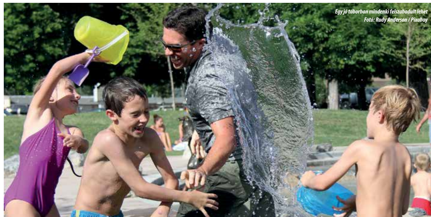
Egy jó táborban mindenki felszabadult lehet