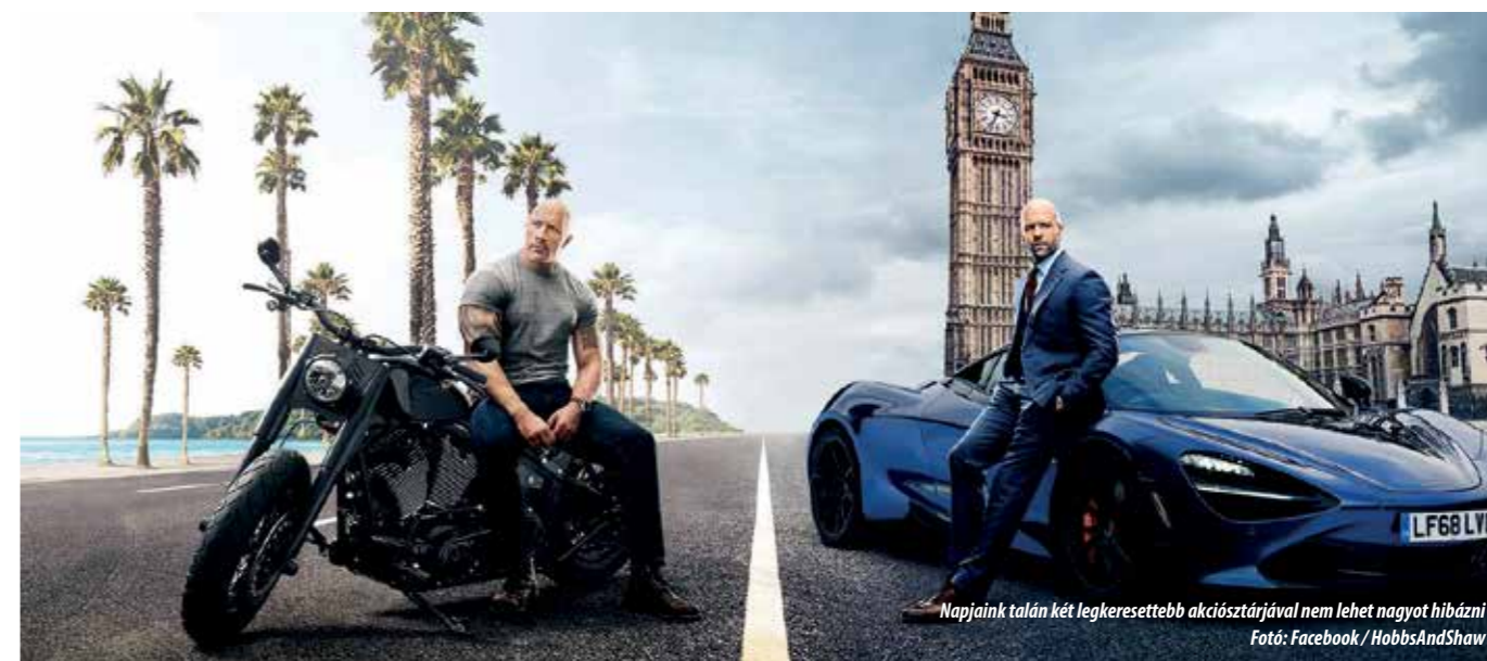
Napjaink talán két legkeresettebb akciósztárjával nem lehet nagyot hibázni