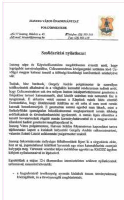
Az Isaszeg Város Önkormányzatának képviselő-testülete által aláírt szolidaritási nyilatkozat

A képviselő-testület egyetértett az al, hogy a Pest Megyei Önkormányzat 22/2019. (04. 26.) PMÖ határozata alapján – a Pest megye területfejlesztési koncepciója 2014–2030 és a Pest megye területfejlesztési programja 2014–2020 megvalósításához nyújtandó célzott pénzügyi támogatás felhasználásának feltételrendszeréről szóló 1517/2016. (IX. 23.) Korm. határozat alapján bizto-