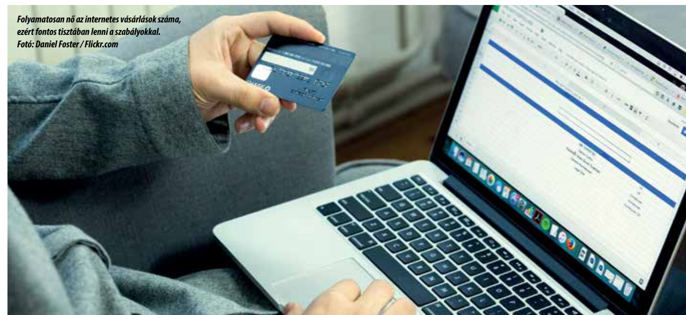
Folyamatosan nő az internetes vásárlások száma, ezért fontos tisztában lenni a szabályokkal.