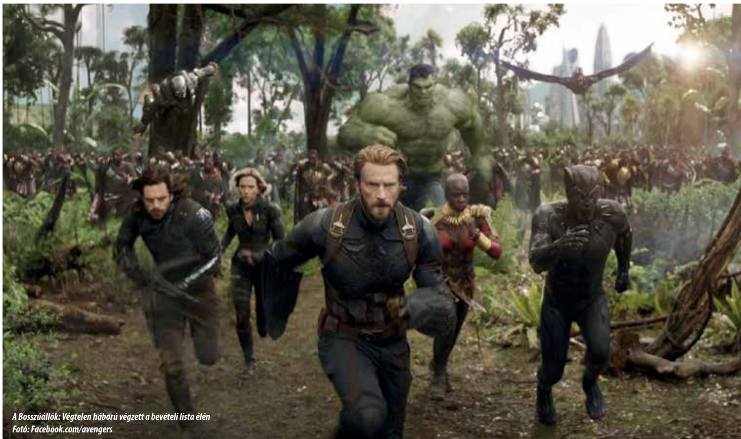
A Bosszúállók: Végtelen háború végzett a bevételi lista élén