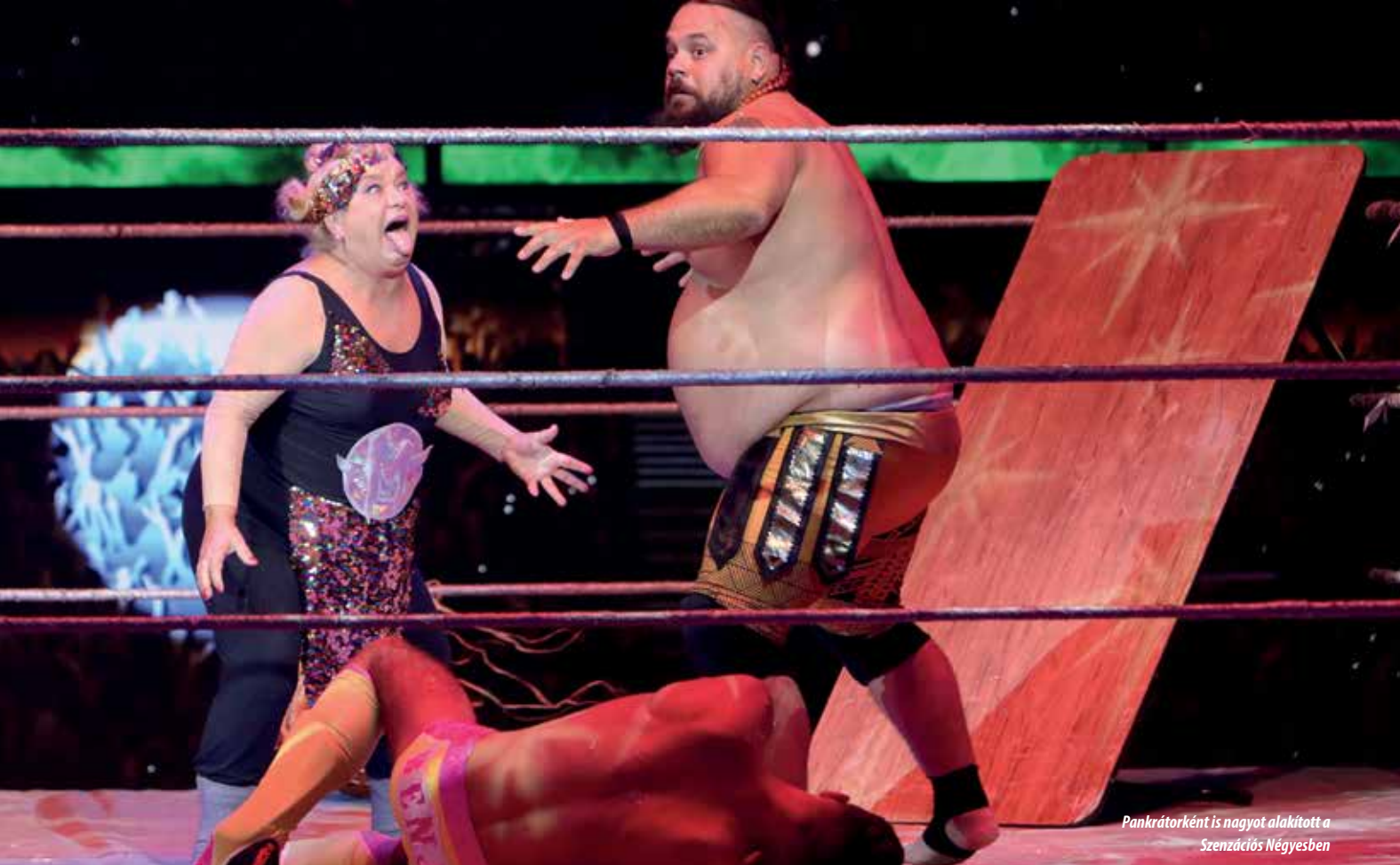
Pankrátorként is nagyot alakított a Szenzációs Négyesben