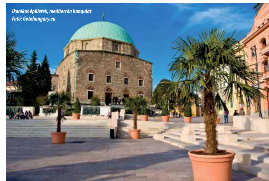
Ikonikus épületek, mediterrán hangulat

Második nap. Amennyiben úgy érezzük, hogy sikerült minden imént említett helyszínt alaposan feltérképeznünk, ismét kocsi ülhetünk, és keressük fel az alig ötven percre található Bikalt. A Reneszánsz Élménybirtok fallal körbevett óvárosa mesebeli hely, ahol szinte életre kel a történelem, amelynek