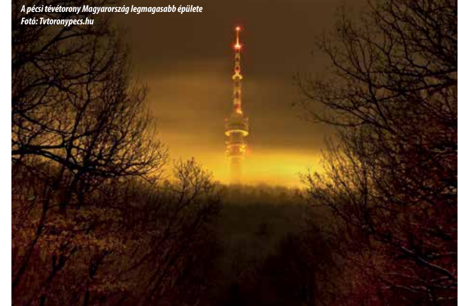
A pécsi tévétorony Magyarország legmagasabb épülete

a vendég is részese lehet. Az autentikus épületek között megbúvó hangulatos, kicsi utcák garantáltan elvarázsolják az idelátogatót. Találkozhatunk jó néhány középkori iparosműhellyel is, amelyeknek szinte mindegyikében kitanulhatunk egy-egy mesterfogást. Térjünk be a középkori ajándékboltba, ahol korhű ruhákba öltözött eladók fogják segíteni vásárlásunkat a múltat idéző, ám sokszor napjainkban is praktikus használati tárgyak terén. Ha már kellően átítatott minket a történelem szele, induljunk vissza szállásunkra, de közben ejtsük útba Abaligetet. A 18. század óta ismert cseppkőbarlang ötszáz méteres szakasza látogatható, így bizonyítottan gyógyhatású levegőn sétálva tekinthetjük meg a gyönyörű természeti képződményeket.