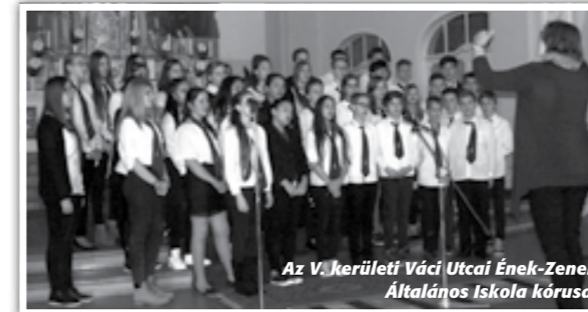
Az V. kerületi Váci Utcai Ének-Zenei Általános Iskola kórusa

Az elmúlt évben indítottunk egy újabb kezdeményezést, amelyből szintén hagyományt szeretnénk teremteni. Öröme-éneklés címmel hívtuk a vendégkórusokat a római katolikus templomba, hogy egymás énekét hallgatva egy hétköznapi estéből csodát varázsoljunk. Boldogan hallgattuk testvériskolánk, a Budapest V. Kerületi Váci Utcai Ének-Zenei Általános Iskola műsorát, a Gaudium Carminis kamarakórust, valamint