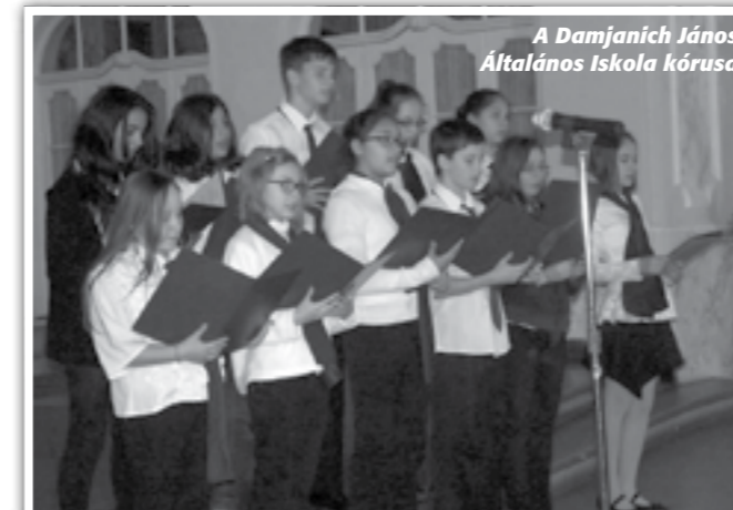
A Damjanich János Általános Iskola kórusa