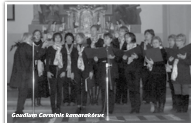
Gaudium Carminis kamarakórus