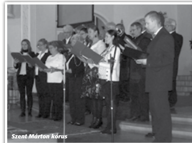
Szent Márton kórus