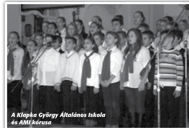
A Klapka György Általános Iskola és AMI kórusa

a Szent Márton kórust. Külön öröm volt számunkra, hogy elfogadta meghívásunkat az Isaszegi Damjanich János Általános Iskola kórusa is. Reméljük, jövőre ismét találkozunk.