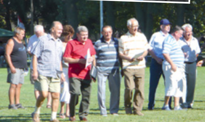
A 100 éves egyesület korábbi sportolóit köszöntötték a pályán