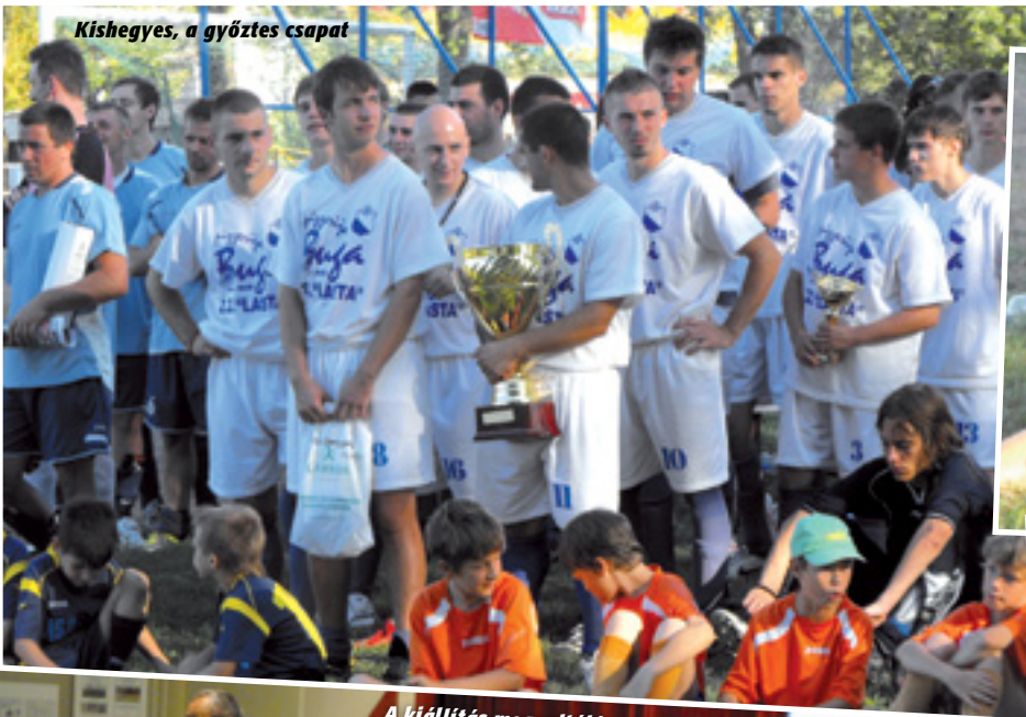
Kishegyes, a győztes csapat