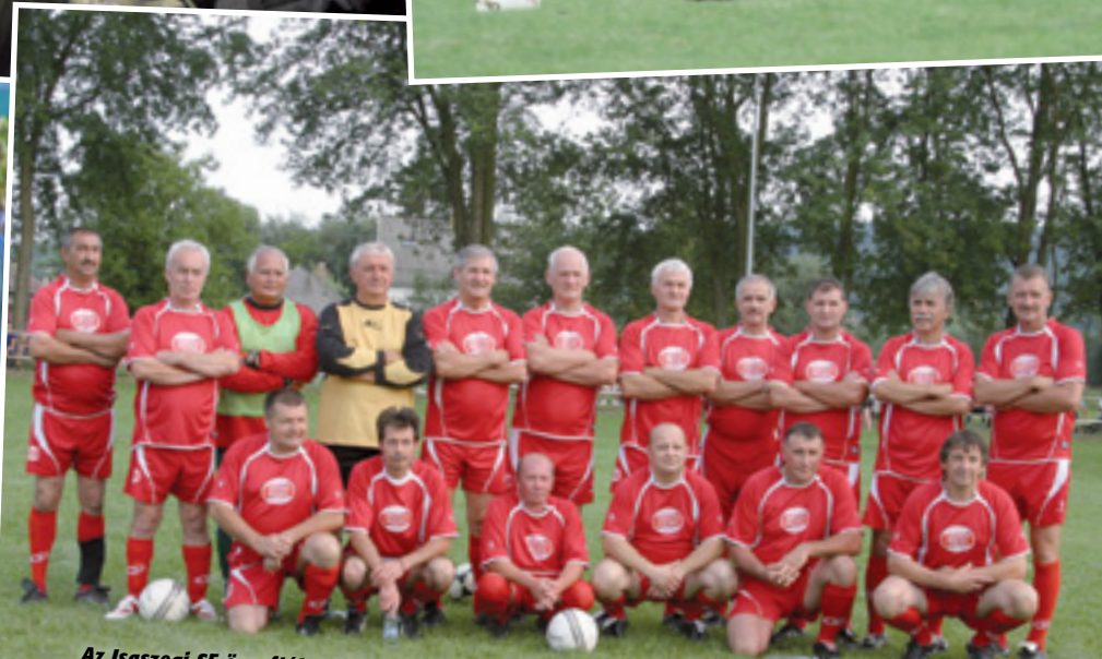
Az Isaszegi SE öregfiúk csapata fiatalos lendülettel játszott a labdarúgótorlán