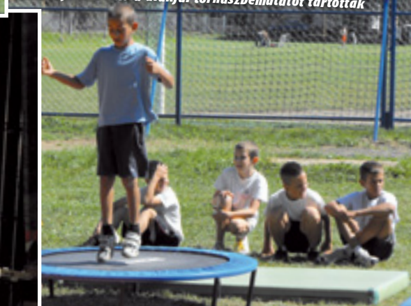
A Damjanich iskola diákjai tornász bemutatót tartottak