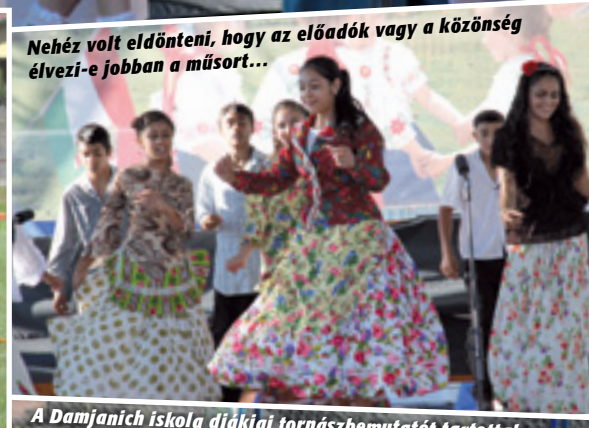
Nehéz volt eldönteni, hogy az előadók vagy a közönség élvezi-e jobban a műsort...