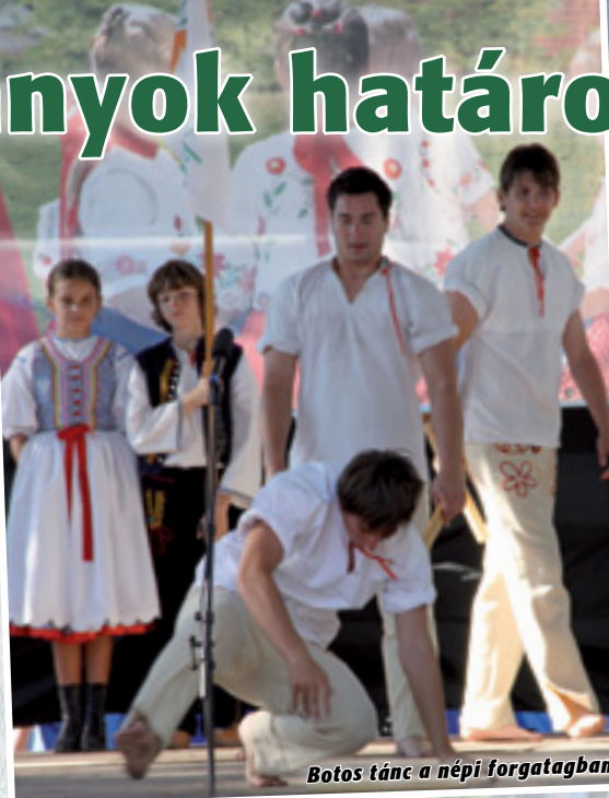
Botos tánc a népi forgatagban