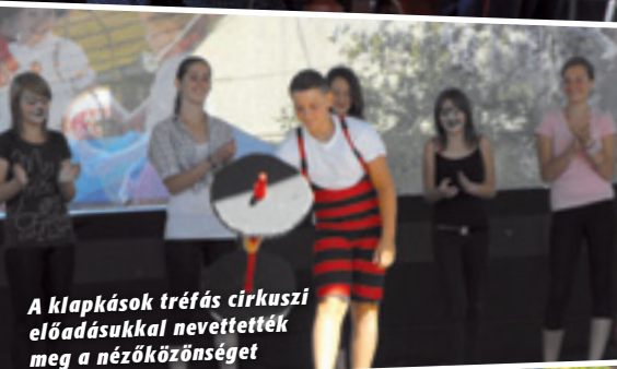
A klapkások tréfás cirkuszi előadásukkal nevtették meg a nézőközönséget