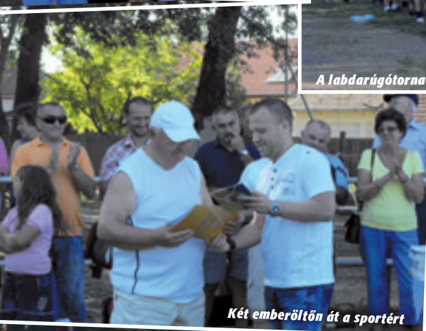
Két emberöltőn át a sportért