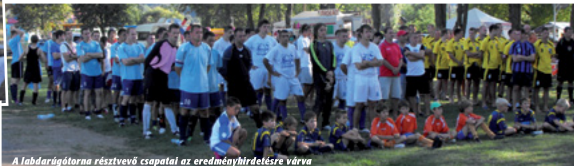
A labdarúgóturna résztvevő csapatai az eredményhirdetésre várva

Az augusztus 20–21-i rendezvény keretén belül – Isaszeg történetében először – nemzetközi felnőtt labdarúgóturna vette kezdetét, amelyen Zselíz, Kishegyes, Bojanów csapatai és az Isaszegi SE baráti mérkőzései tették emlékezetessé a centenáriumot.