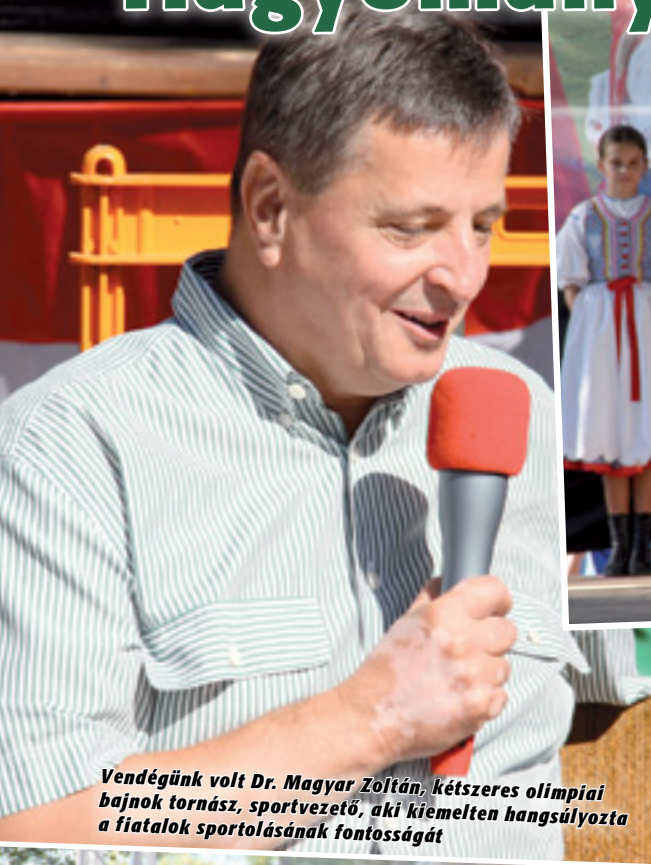
Vendégünk volt Dr. Magyar Zoltán, kétszeres olimpiai bajnok tornász, sportvezető, aki kiemelten hangsúlyozta a fiatalok sportolásának fontosságát