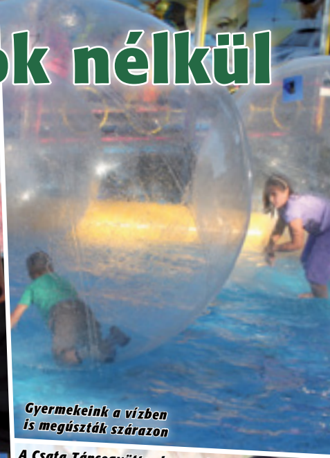
Gyermekeink a vízben is megsúzták szárazon