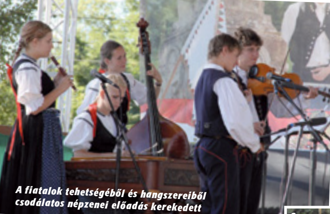
A fiatalok tehetségéből és hangszereiből csodálatos népzenei előadás kerekedett