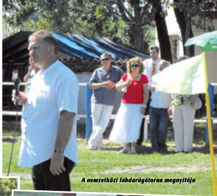
A nemzetközi labdarúgótorna megnyitója

A város életében jelentős eseménysorozat lezártaival reméljük, hogy újabb sikeres időszak kezdődik Isaszeg sportéletében!