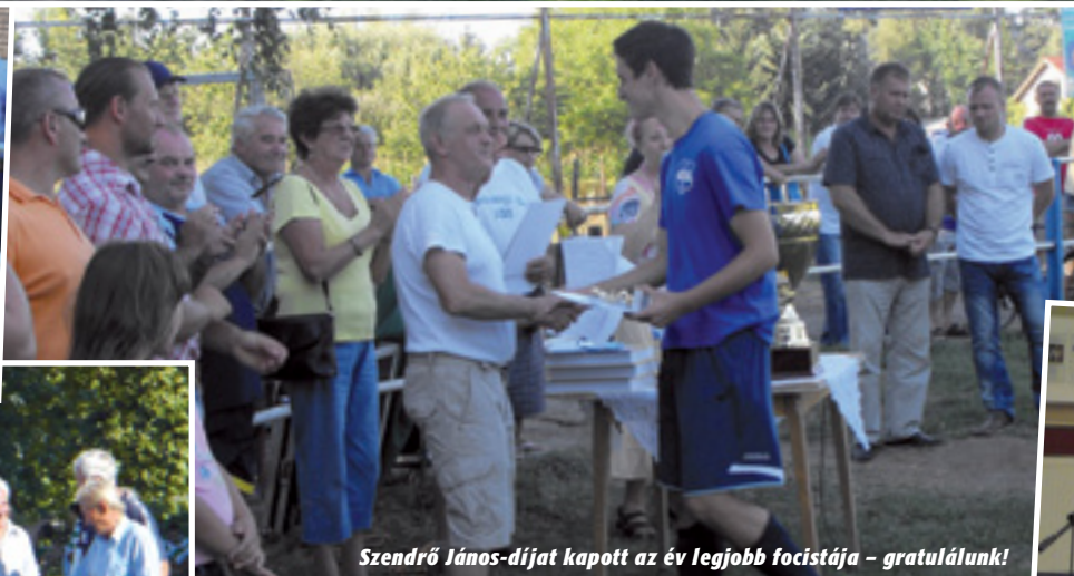
Szendrő János-díjat kapott az év legjobb focistája – gratulálunk!