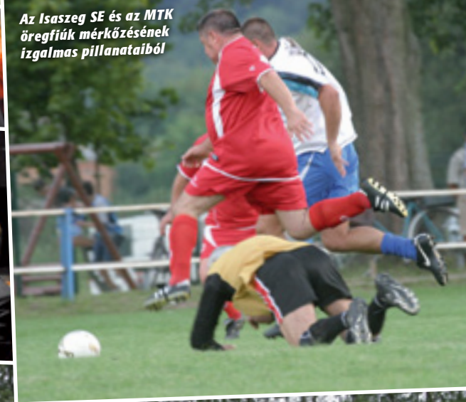
Az Isaszeg SE és az MTK öregfiúk mérkőzésének izgalmas pillanataiból