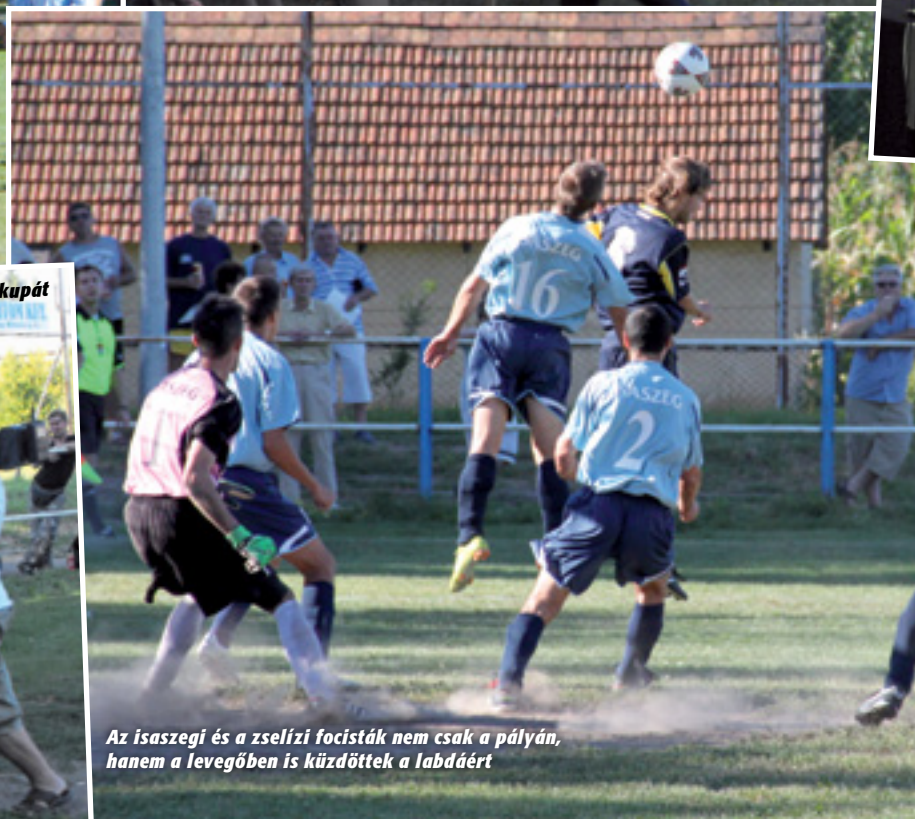
Az isaszegi és a zselízi focisták nem csak a pályán, hanem a levegőben is küzdöttek a labdáért