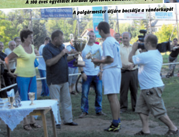
A polgármester útjára bocsátja a vándorkupát