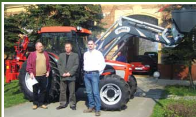
A géppark bővítése