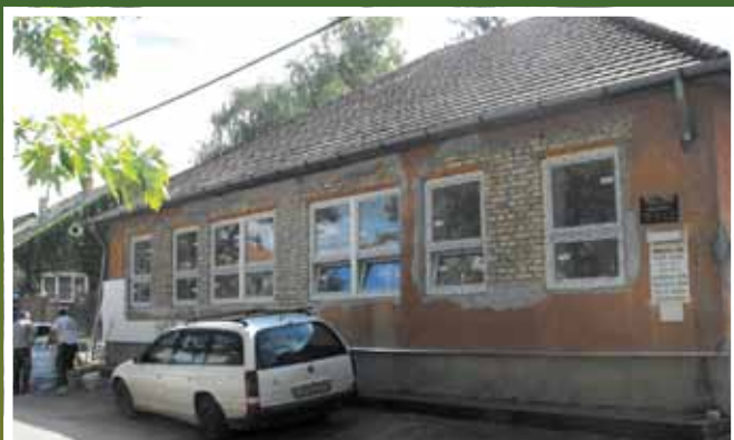
Felújítás alatt az Aulich utcai orvosi rendelő