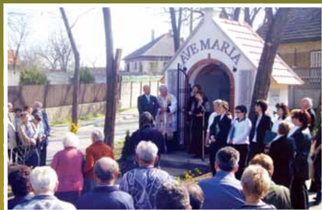
A szlovák önkormányzat kápolnaavatása