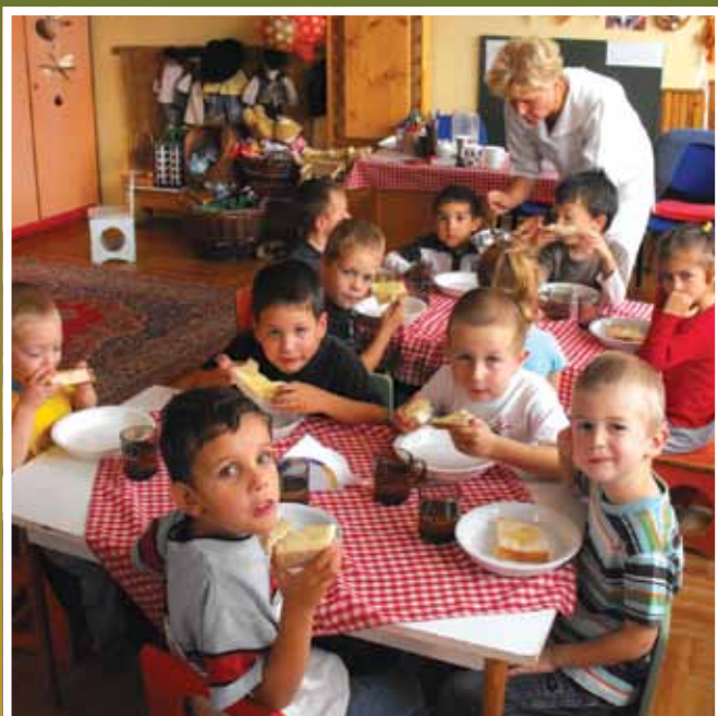
Jó gazda módjára működtetett intézmények