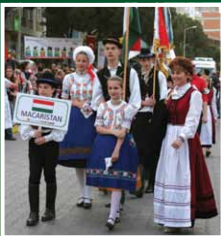
Művészeti csoportjaink külföldre is jó hírünket viszik