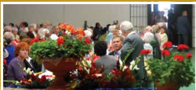
A nyugdíjasok megbecsülése