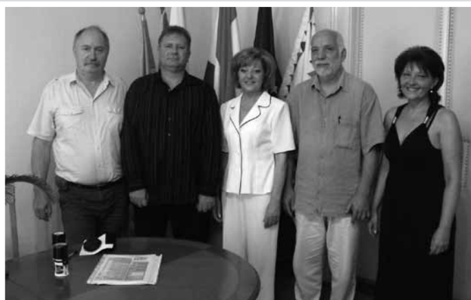
A két város vezetői