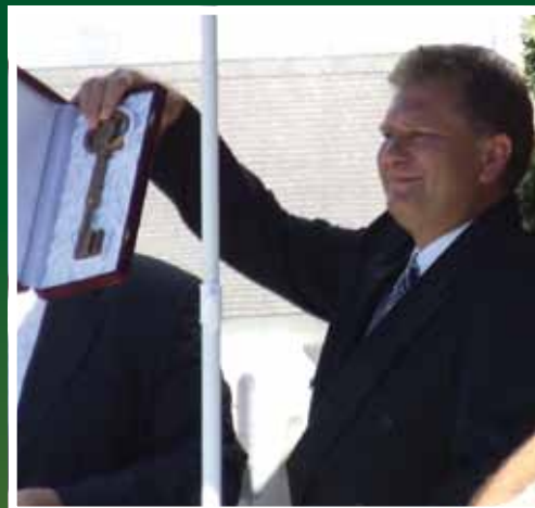
A város kulcsának átvétele