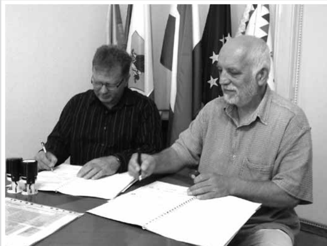
A polgármesterek aláírják a pályázati szerződést

Három rendezvény – a „ Hagyományok határok nélkül ”, a „ Franz Schubert Napok ” és a „ Gyermekek a gyermekekért ” – Zselízen valósul meg. A „ Hagyományok határok nélkül ” fesztiválon hagyományos ételekkel, termékekkel, népzenevel, mesterségekkel, de jelenkori zenével és a két baráti város hagyományaival is megismerkedhetnek a résztvevők. A rendezvény része a „ Gyermekek a gyermekekért ” elnevezésű műsor, amely különféle attrakciókat, workshopokat, versenyeket és játékokat kínál, majd diszkrét zárja a rendezvényt. A „ Franz Schubert Napok ” a zeneszerző emlékének tiszteletére valósul meg. A klasszikus zenei fesztiválon zselízi és isaszegi zenészek szerepelnek. Mind Franz Schubert zselízi tartózkodása, mind az 1848–49-es isaszegi események köre hozzájárul a saját hagyományok megismeréséhez. Mindkét város bevonja a rendezvényekbe a művészetekkel foglalkozó szervezeteit.