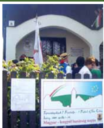
Testvértelepülések I. Fesztiválja