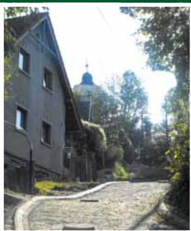
A temetőhöz vezető utak, parkolók megépítése