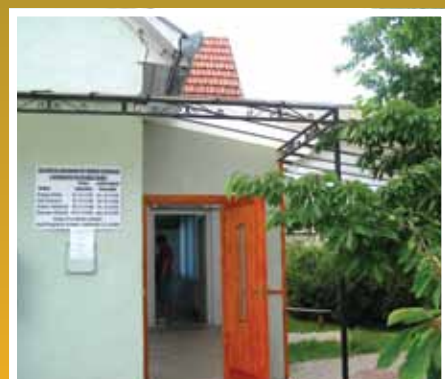
Szélfogó és iroda kialakítása az egészségházban