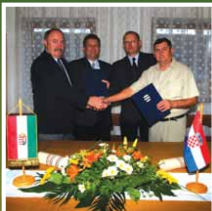
Dinamikusan fejlődő nemzetközi kapcsolatok