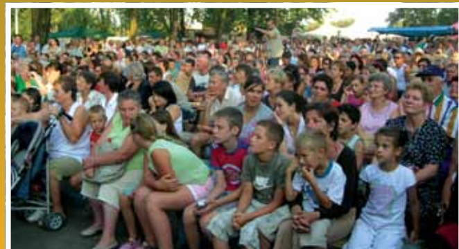
Egy a sok sikeres rendezvény közül