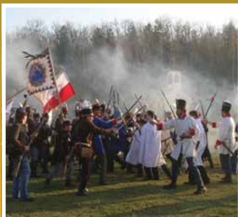
Isaszeg legnagyobb ünnepe