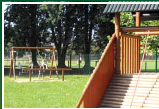
Az új játszótér