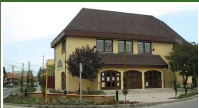
Új díszburkolat a művelődési otthon előtt