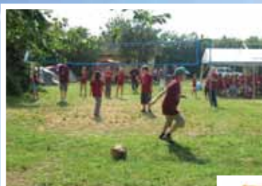
A Damjanich iskola fotói