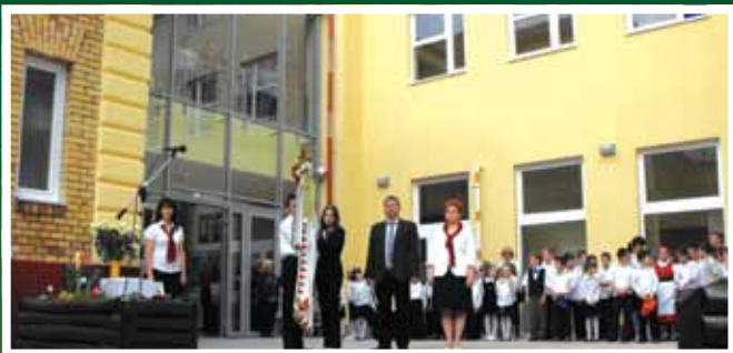
A Damjanich iskola átadása