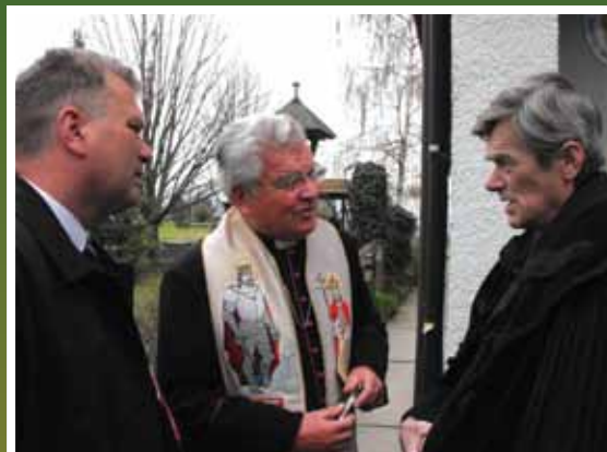
Együttműködés az egyházakkal