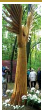
Példa a civilek támogatására