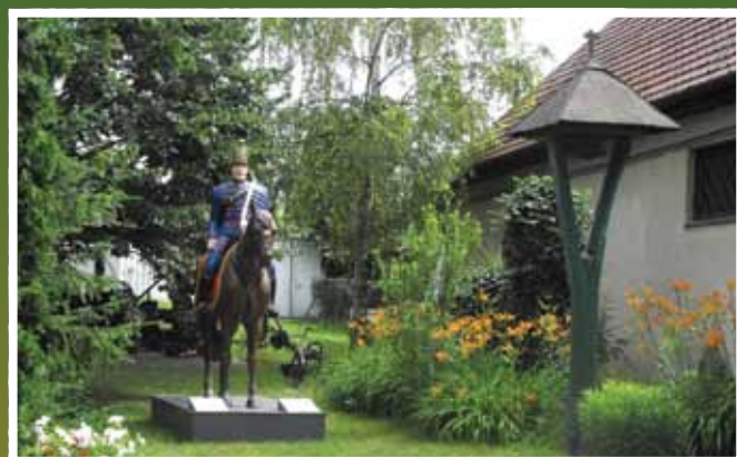
A Pest megyétől átvett „Falumúzeum” udvara