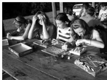
A Klapka iskola fotói