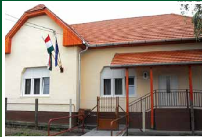
A felújított bölcsőde