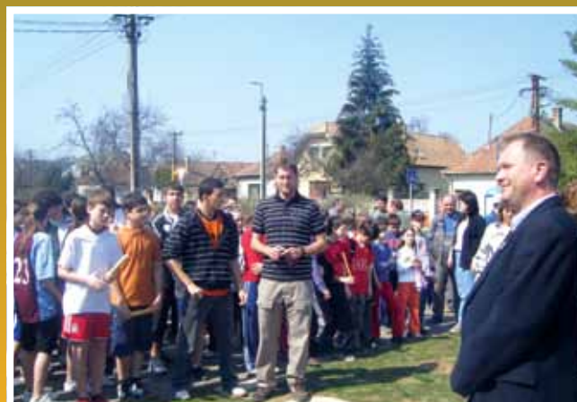
1849 méteres futás