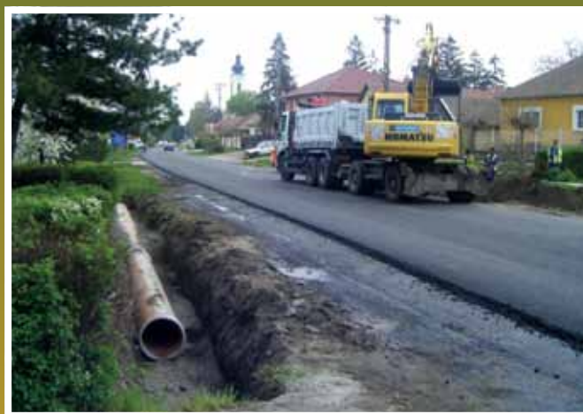
A főút vonal felújítása parkolókkal, buszvárókkal