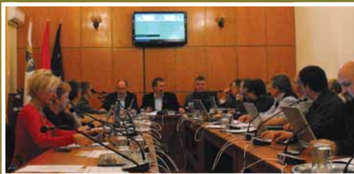
Testületi ülés a régi és a korszerűsített Nagyteremben