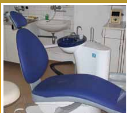
Az új fogorvosi szék