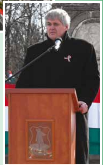
fotók: dr. Székelyné Opre Mária