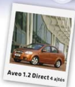
Aveo 1.2 Direct 4 ajtós

Felszereltség: ABS, 2 légszák, szervokormány, CD-s rádió, elektromos ablakemelő elől, központi zár, indításgátló, stb. már 2.159.000 Ft-tól! Még 8 autó készleten!