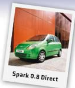
Spark 0.8 Direct

Felszereltség: ABS, légszák, indításgátló, 60/40 arányban dönthető hátsó ülés, stb. már 1.599.000 Ft-tól! Még 14 autó készleten!