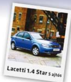
Lacetti 1.4 Star 5 ajtós

Felszereltség: ABS, légszák, szervokormány, mp3-as rádió CD, elektromos ablakemelő elől, központi zár, indításgátló, stb. már 1.829.000 Ft-tól! Még 12 autó készleten!