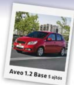
Aveo 1.2 Base 5 ajtós

Felszereltség: ABS, légszák, indításgátló, 60/40 arányban dönthető hátsó ülés, stb. már 1.599.000 Ft-tól! Még 14 autó készleten!