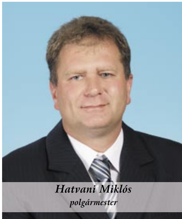
Hatvani Miklós polgármester