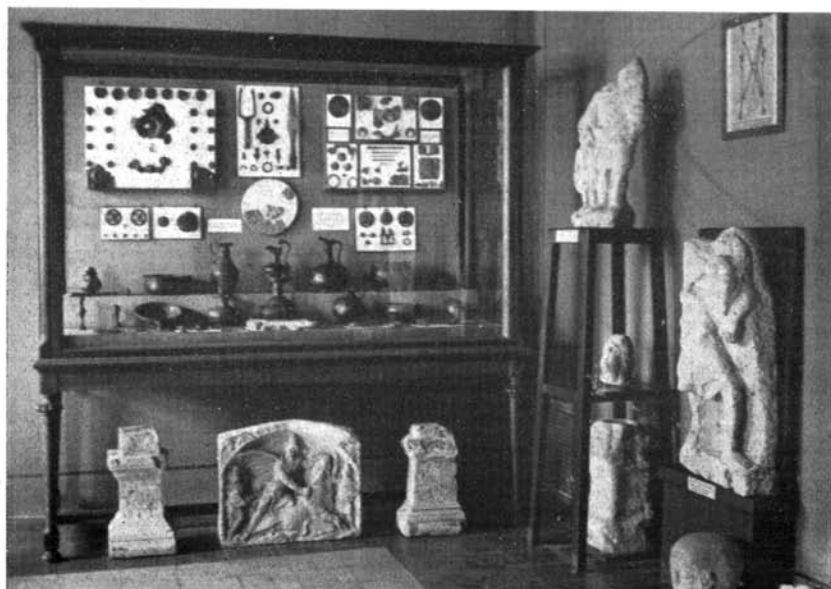
Római bronzedények és veretek, köemlékek.