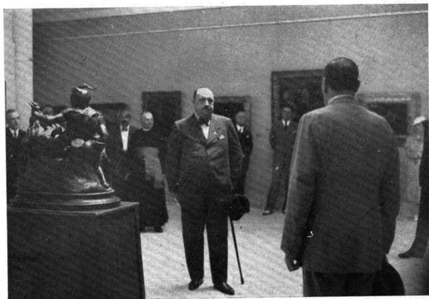
Dr. Hóman Bálint megnyitja a képtárt.