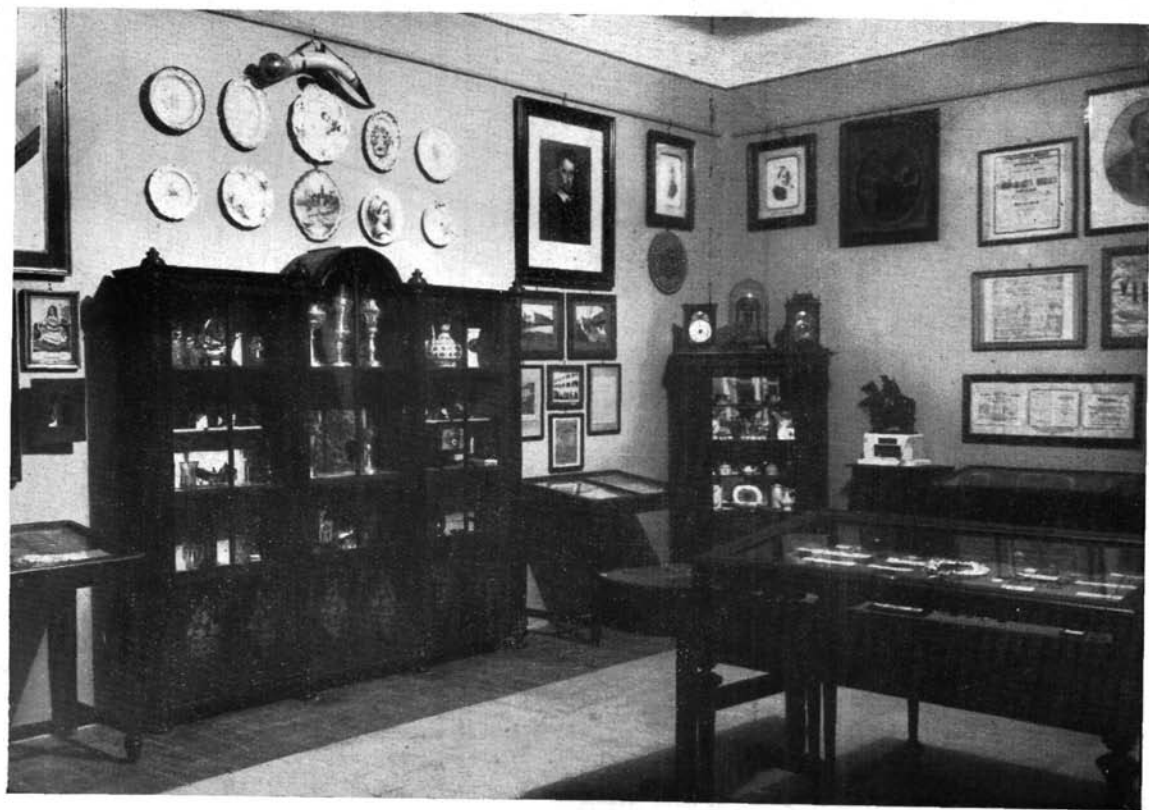
Iparművészeti tárgyak, irodalmi és színházi emlékek.