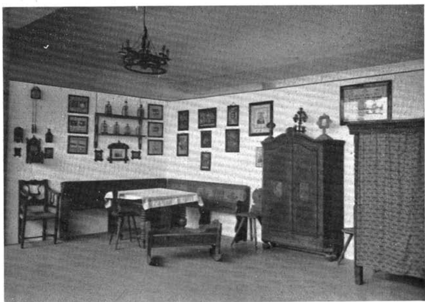
Részlet a néprajzi teremből.