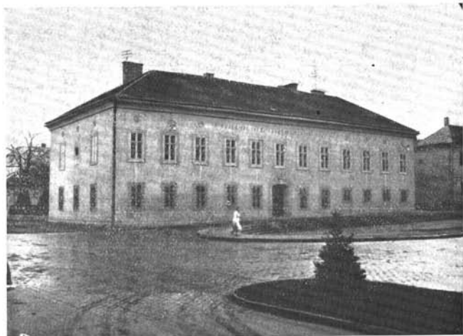
A muzeum új homlokzata.