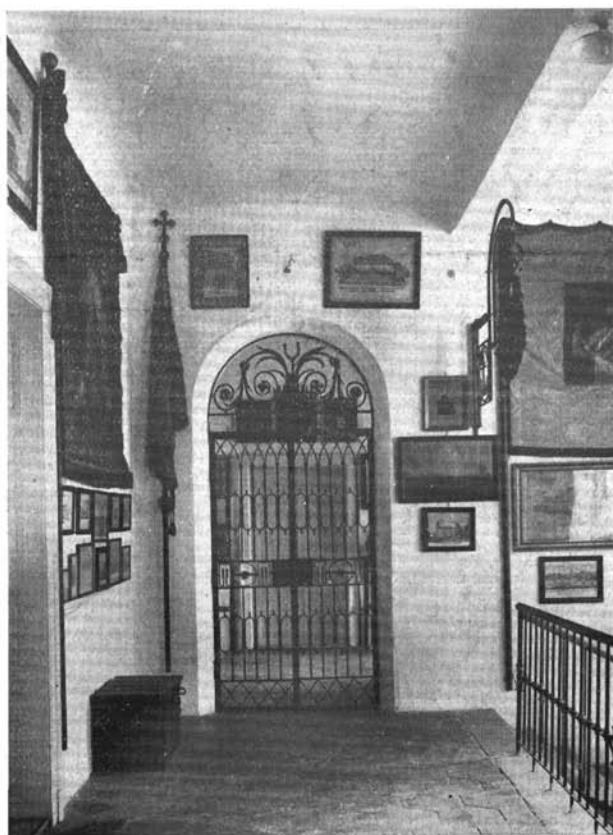
Részlet a lépcsőházból.