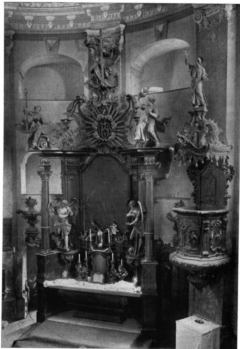
4. Az abai templom oltára és szószéke.