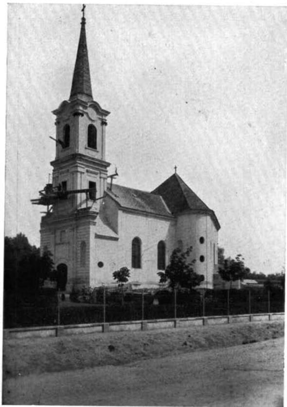
1. Az abai templom dél-nyugatról.