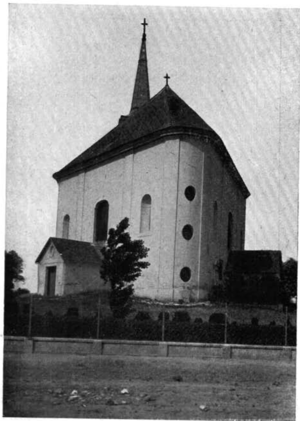
2. Az abai templom dél-keletről.