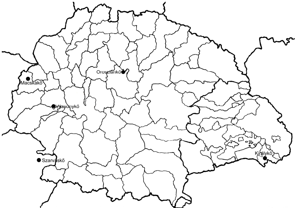
6. térkép. Az 1450 után adatható kő utótagú várnevek

A 15. század második feléből még kisebb számban vannak újabb adataink (6. térkép): Heves vármegyéből Oroszlánkő , Sopron vármegyéből Macskakő , Veszprém vármegyéből Vázsonykő , Erdélyi Fehér vármegyéből Királykő , illetve a délnyugati országrészből, Körös vármegyéből Szarvaskő . Látható tehát, hogy a 15. századtól ez a névforma olyan déli területeken is jelentkezik néhány példával, ahol nem csupán a kő utótagú hegynévi pár nem adatható, de magának a lexémának a hegynévalkotó szerepére sincs adatunk (vö. RESZEGI 2011: 119). Itt már nyilvánvalóan eleve várnévként jöhettek létre ezek a névformák, s nem is igen feltételezhetünk hegynévi előzményüket.