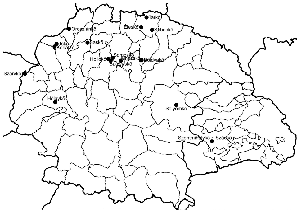
3. térkép. Az 1300–1349 között adatolható kő utótagú várnevek