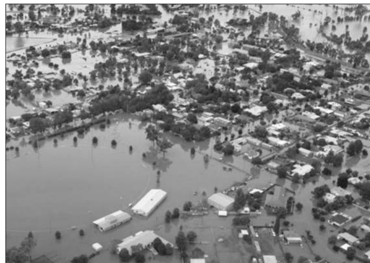
Délkelet-Ausztrália víz alatt. A helyzet Wagga Waggában a legsúlyosabb