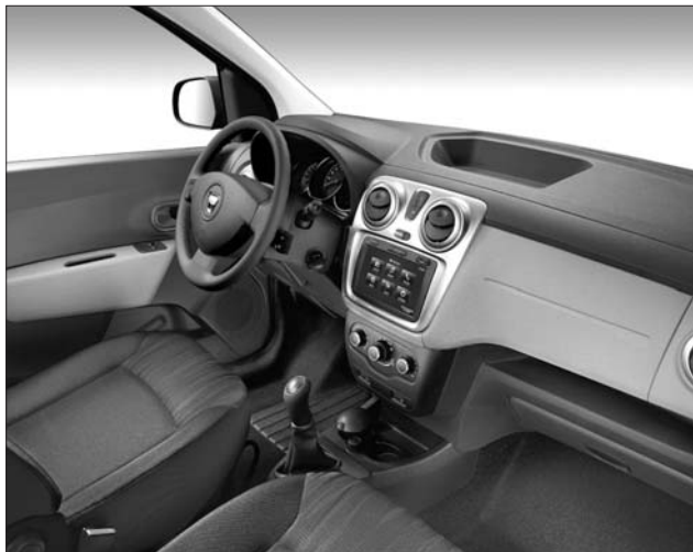
Érintőképernyős navigációval is megvásárolható lesz a Dacia Lodgy

A március 18-ig tartó Genfi Autószalonon egyik leginkább várt premierje az új Audi A3-as volt, amelynek most a háromajtós változatáról hullt le lepel. Bár elődénél nagyobb lett, a tömege mégis csökkent és az autó felszereltsége is gazdagabb lett. Noha ez egy teljesen új fejlesztésű modell, amelyet már az új moduláris padlólemezekre, az MQB platformra építettek, a jól ismert stíuselemek miatt a formaterv nem jelent igazi meglepetést. Egyelőre két benzin- és egy dízelmotorral lesz elérhető.