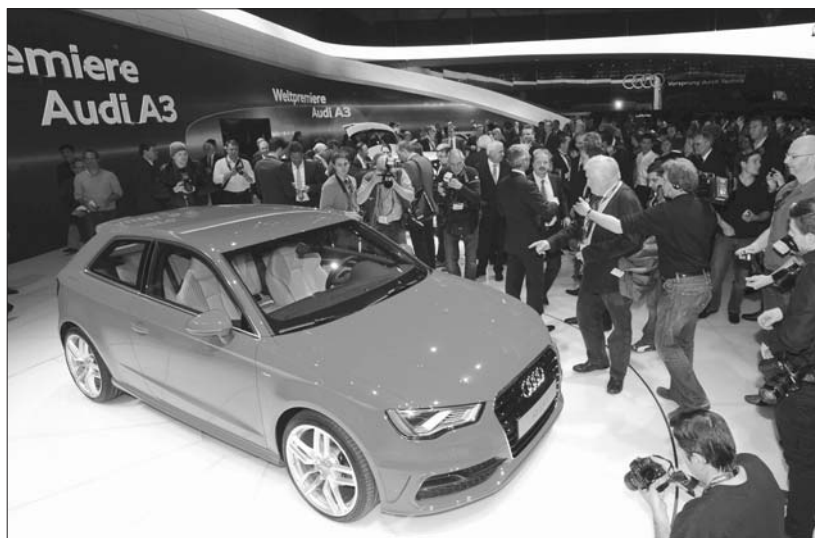
Az MQB platformra épült az Audi új A3-asa

A Lamborghini is kitűnik a kiállításon, hiszen Genfben egy olyan egyedi modellt vitt el, amelyből nem fog többet gyártani. Az Avantorok speedsterből még a múzeumuk számára sem készítenek el még egyet, pedig nem koncepcióautóról van szó. Egy olyan sportmodellről, amelynek egyetlen példányát 2,1 millió euróért meg lehet vásárolni. Persze a pénzért cserébe teljesítmény is jár: a vadászrepülőket idéző karosszéria egy hétszáz lóerős, 6,5 literes, V12-es motort rejt.