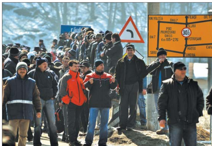
A fővárosba tartó menet Petrozsény kijáratánál torpant meg

▶ Nehezen állták útját a csendőrök annak az ötezer dühös bányásznak, akik tegnap Bukarestbe indultak Petrozsényből számon kérni a gazdasági minisztériumtól a be nem tartott ígéreteket. Az Országos Köszén Társaság alkalmazottai a veszélyességi pótlék megemelését követelik. 7. oldal ▶