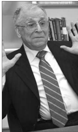
Ion Iliescu – hiába lusztálták, övé a múlt

Valójában, ha alaposabban szemügyre vesszük az 1990 utáni román társadalmat, a legtöbb rákfene, amelyet jogosan kárhoztunk – korrupció, a felebarátunkkal szembeni közöny, klientúra-építés, arrogancia, erkölcsatlenség, vak pragmatizmus, polgári öntudat hiánya, agresszivitás, cinizmus etc. – csak korlátozott mértékben tulajdonítható az „exek” közéleti és politikai jelenlétének. Nagy kiábrándulás volt látni, különösen az elmúlt egy évtizedben, hogy fiatal emberek, akik nem kapcsolódnak intézményesen a kommunizmushoz, semmiel sem – nevezük másként – „európaibbak”, mint szüleik voltak. Tulajdonképpen az történt, a hozzám hasonló idealisták legnagyobb megdöbbenésére, hogy a kommunizmus hibái nagymértékben újratemelődték, sőt mondhatni esetenként felerősödtek a kommunizmus utáni időszakban felnevelt és iskolázott generációkban.