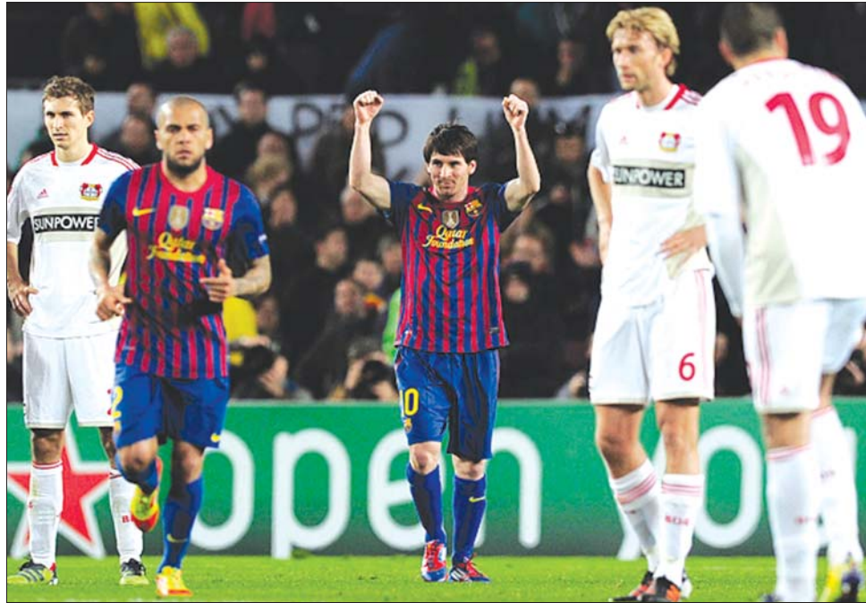
Nagy formában volt: Lionel Messi a leverkuseni „gyógyszergyáriak” hóhéranak bizonyult