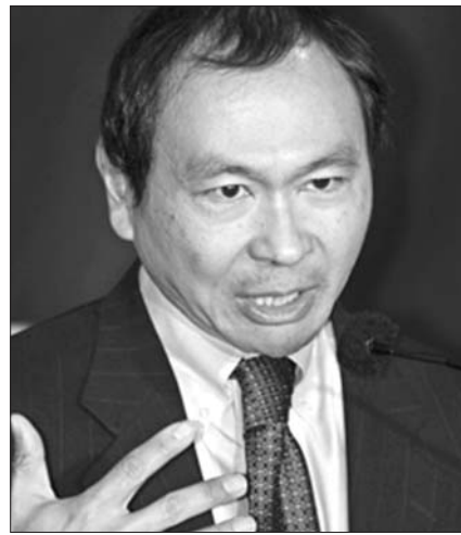
Francis Fukuyama – hiába nagy politológus, ha nem érti nagyszerűségünket

mi nagyon is megengedjük, hogy segítsen nekünk, csak aztán már ne próbálja előírni, mihez kezdünk szuverén módon a pénzünkkel;