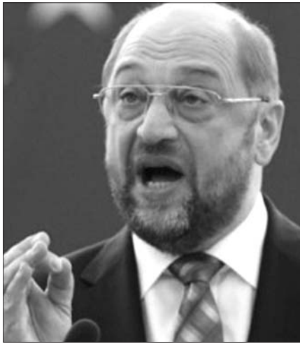
Martin Schulz, az Európai Parlament elnöke – jómadár, a kintiek bent embere