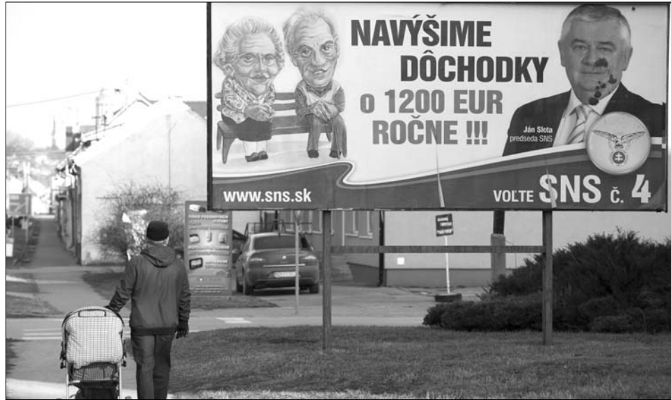
A Szlovák Nemzeti Párt óriásplakátja Párkányban. Szövege: Emeljük a nyugdíjakat 1200 euróval évente!!!

Ezeknek megfelelően egyébként közel 86 ezer tölténnyel működő lőfegyver található magántulajdonban, a nem halálosnak minősülő, légpuska száma több, mint 70 ezerre tehető. ◀