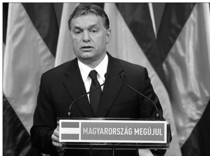
Orbán Viktor évértékelő beszédet tartott a Millenárison