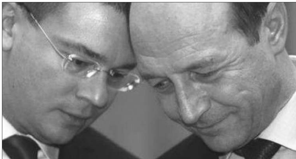
Mihai Răzvan Ungureanu kémfőnökből lett megbízott kormányfő. Traian Băsescu embere?

A Külső Hírszerző Szolgálatról 2010-ben 66 147 lej fizetést, a Bukaresti Egyetemről 28 547 lejt kapott. Emellett 2000 lejes juttatásban részesült az sajtóhordozó részéről. Felesége a fundeni-i kórháztól 45 ezer lejből részesült, az OMF-nek orvosi tanácsadást nyújtó cége viszont közel 356 ezer lejt hozott a családi költségvetésbe. ◀