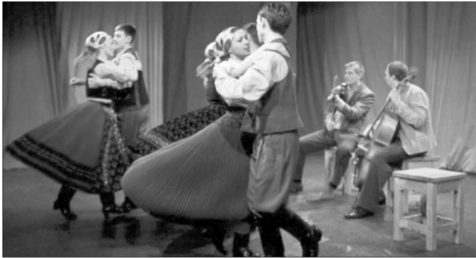
Túlvészelné a telet Szentestétől a farsangtemetésig – erre valók a rítusok