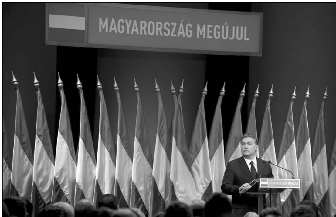
Orbán Viktor értékeli. Felesége azt tanácsolta, mondjon el mindent. „Abból baj lesz” – felelte a férj

A miniszterelnök hozzátette: a kormányváltáskor tudták, hogy nyolc év hibáit és mulasztásait nem lehet néhány hónap alatt jóvátenni; a szocialista kormányok ugyanis „mindent eltüntettek, ami sűrűbb a levegőnél”, és amikor jött a pénzügyi válság első hulláma, nem volt mihez nyúlni. Orbán Viktor azt mondta: ha most akkora volna az ország adósságállománya, mint 2002-ben volt, akkor „mi adnánk kölcsönt a Nemzetközi Valutaalaphoz”, és azon kellene vitakozni, hány új kórház és gyár épüljön. A szocialisták azonban visszanyomták az országot egy „adósságtetrecbe”, ezt pedig nehéz lesz megbocsátani – tette hozzá. Az államadósság csökkentése nélkül Magyarország ma ott tartana, ahol Görögország: elveszítette volna a függetlenségét. Orbán Viktor szerint azok kifogásolják az új alaptörvényt, akik itthon és külföldön Magyarország folyamatos eladósításában voltak érdekeltek, ebből húztak anyagi és politikai hasznot. Kifejtette: a január 1-jétől hatályos új alkotmány előírja az adósság csökkentését és a