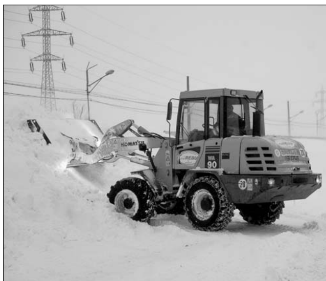
A hófúvások miatt több erdélyi országutat is lezártak a hatóságok

nokságával megbízott társaságokat, hogy a kritikus pontokon állítsanak fel hófogókat, ilyen módon előzék meg, hogy hófúvás esetén elakadjon a közlekedés. Elmondta, évekig használták a hófogókat, de az utóbbi időben ezek titokzatos módon eltűntek. Az országutakat felügyelő hatóság szerint, mintegy 20 kilométernyi hófogóra lenne szükségük, de jelenleg csak négy kilométernyivel rendelkeznek. Tegnap hajnalban egyébként a 13A jelzésű országút Csikszereda és Székelyudvarhely közötti szakaszán is akadozott a forgalom, a 12A országút Szépmező–Gyimesfelsőlok szakaszán súlykorlátozást vezettek be a hatóságok. ◀