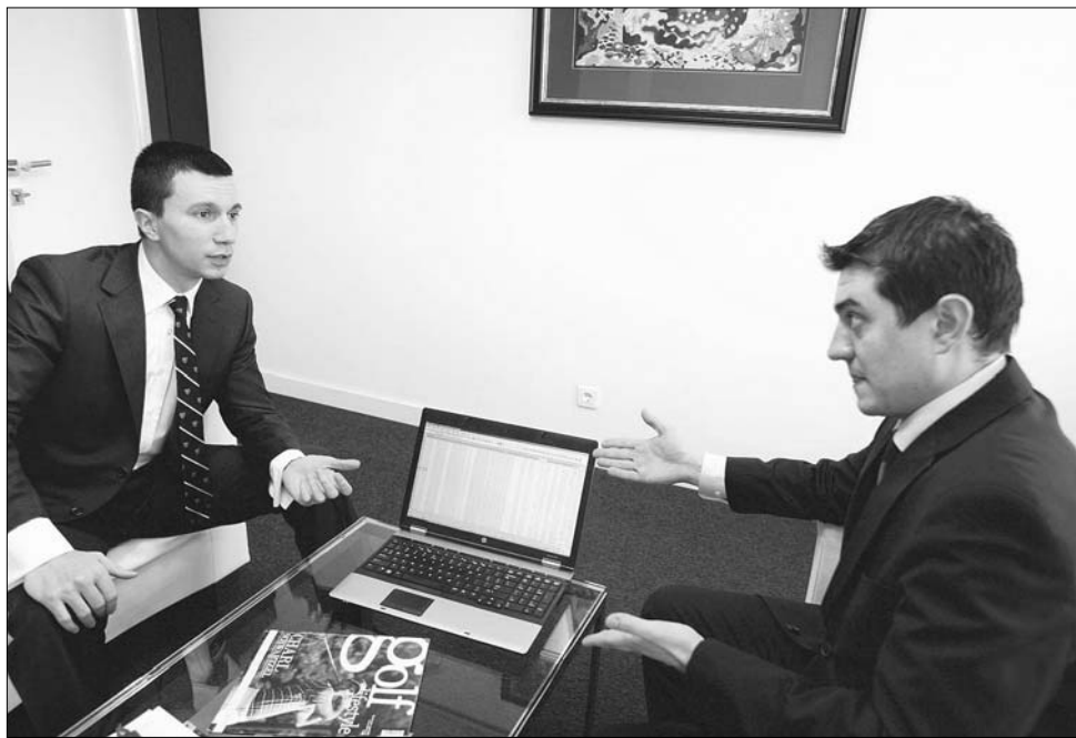
A jegybankelnök szerint hitelfelvétel előtt érdemes tájékozódni, mert a kamatpolitikák igen eltérőek

A tegnapi sajtótájékoztatón a jegybankelnök külön szövegben arról, hogy az utóbbi időben két tévhit is megjelent a BNR politikáját illetően. „Az egyik, hogy a központi bank erőlteti a hitelezés újraindulását, a másik pedig az, hogy a lejhitelket népszerűsítene a valutaköcsönökkel szemben” – fogalmazott a kormányzó, leszögezve, hogy nem ért egyet ezekkel a vélekedésekkel. ◀