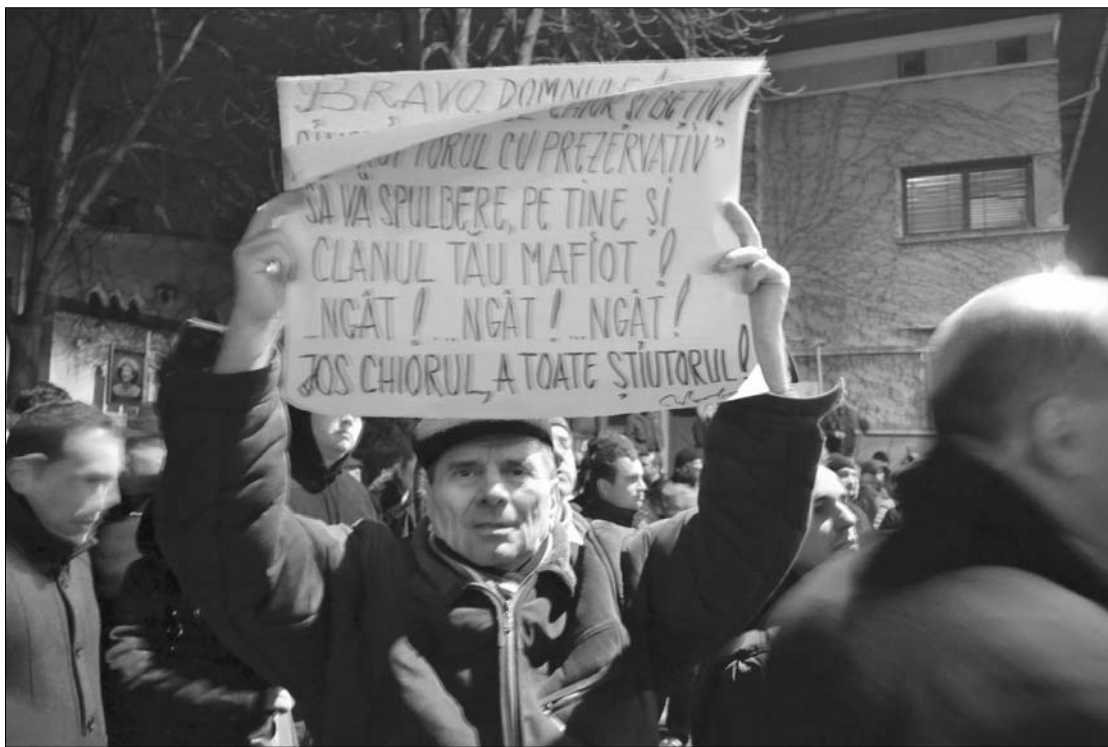
A Cotroceni-palota előtt még békésen tüntettek az elégedetlenkedők, Băsescu lemondását követelve.

Mint arról korábban tájékoztattunk, az országos tiltakozáshullámot az váltotta ki, hogy Traian Băsescu államfő múlt hétfőn a Realitatea hírtélevízió élő adásában éles szóváltásba keveredett Raed Arafattal, a SMURD köztszerteletnek örvendő alapítójával az egészségügyi törvénytervezet sürgősségi mentőszolgálatra vonatkozó részéről. A vita nyomán Arafat lemondott a szaktárcában betöltött helyettes államtitkári tisztségéről. ◀