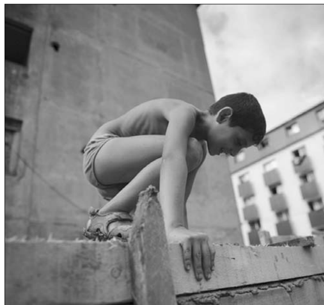
A nagybányai fal után lakópark épül a nehéz szociális helyzetűeknek

Amint arról lapunkban már beszámoltunk, Nagybánya nemrégiben azzal került az érdeklődés középpontjában egy ötven méter hosszú és másfél méter magas falat építettek egy többségében romák lakta tömbház és az előttük lévő forgalmas út közé, amely ellen több emberjogvédő szervezet is tiltakozott. „Nem falat, kerítést építünk, hogy elválasszuk az utat a tömbházaktól, mivel gyakoriak a balesetek, és több olyan bejelentés is érkezett az önkormányzathoz,