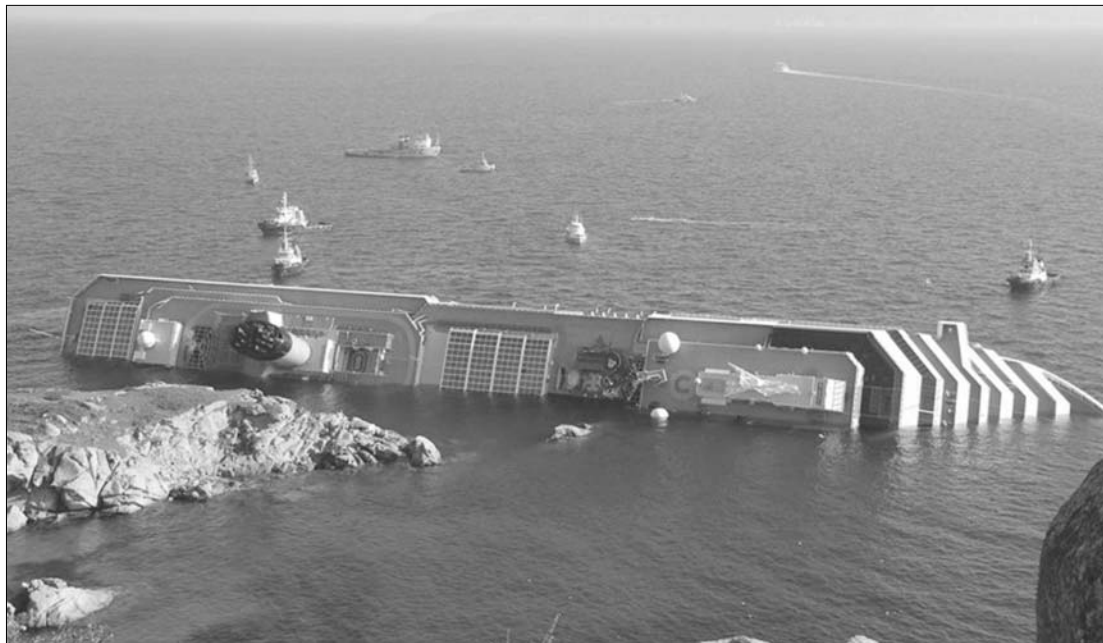
A Costa Concordia a toszkán partoknál. Romániai és magyar állampolgárok is voltak a fedélzeten, két magyar eltűnt

Francesco Paolillo, a parti őrség parancsnoka szerint elképzelhető, hogy a luxus-hajó belsejében rekedt az a mintegy 70 ember, akiket a hatóságok még mindig eltűntként tartanak nyilván. A bukaresti Külügyminisztérium közölte: 29 román állampolgárságú utas és 27 olyan – ugyancsak román állampolgárságú – sze-