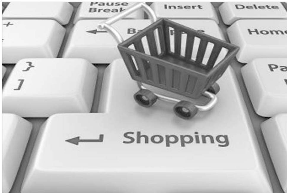
A kényelem és kedvezményes ajánlatok egyre több vevőt csábítanak internetes vásárlásra Romániában is