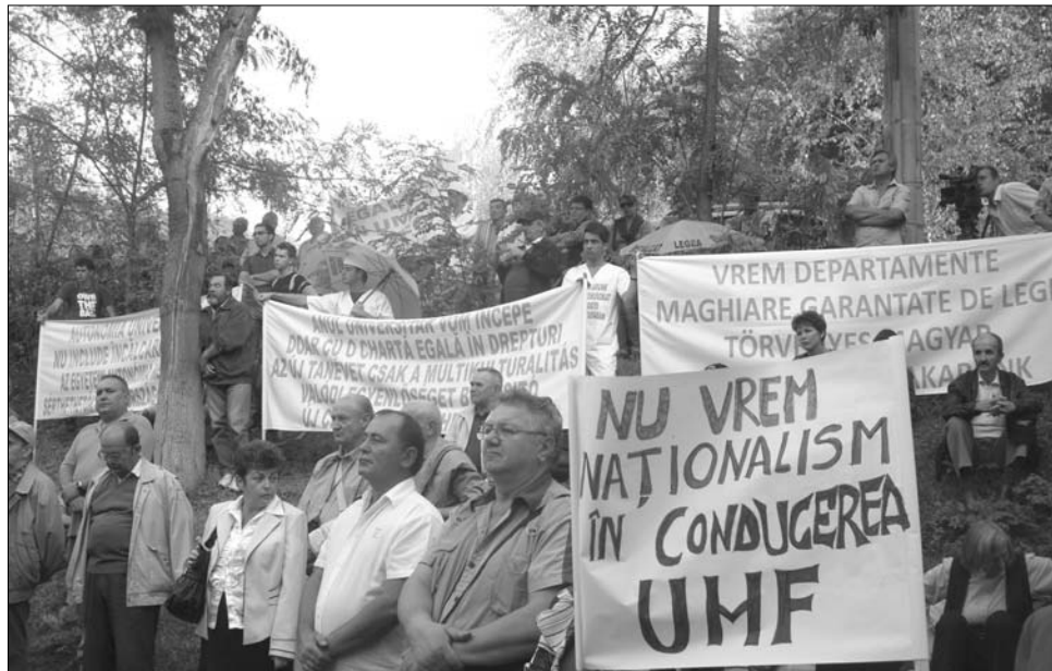
A MOGYE magyar tanszékeinek megalapítása mellett tavaly több tüntetést is szerveztek Marosvásárhelyen

Amint arról lapunkban már beszámoltunk, az új tanügyi törvényt szerint magyar intézeteket kell létrehozni a multikulturális egyetemeken. A jogszabály három ilyen hazai felsőoktatási intézményt nevez meg, a MOGYE-n kívül a BBTE-t és a Marosvásárhelyi Művészeti Egyetemet. A MOGYE román többségű szenátusa már kétszer utasította el a magyar intézetek megalapítását az egyetemi autonómiára hivat-