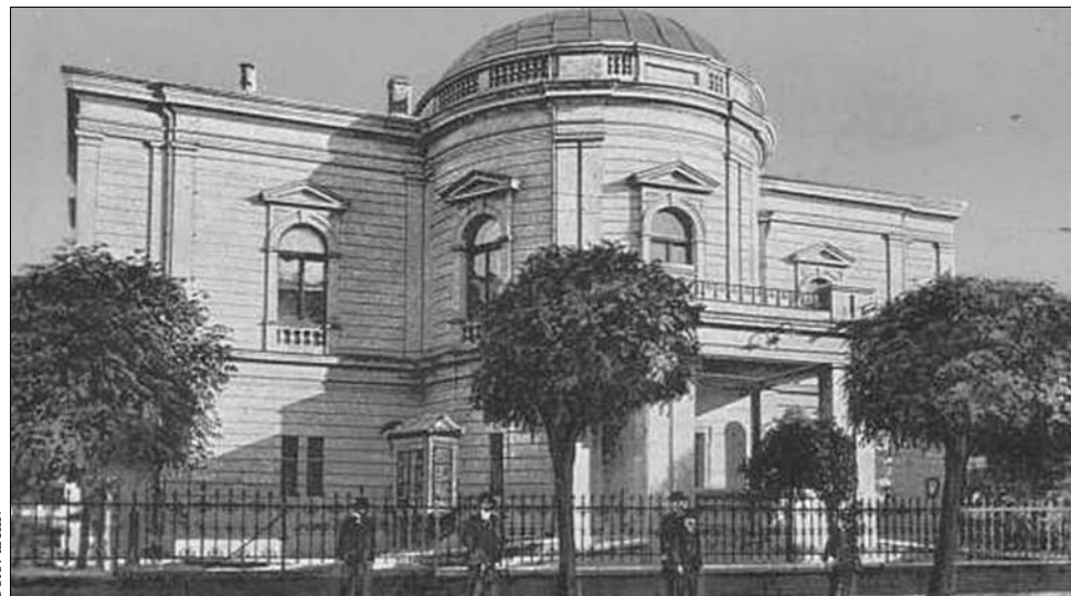
1889-ben néhány pénzérmét és a városi tisztikar és képviselőtestület névsorát beépítették a falba