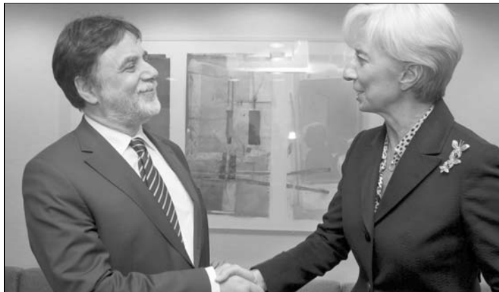
Fellegi és Lagarde valójában a semmiről állapodott meg

Az Erdélyi Magyar Nemzeti Tanács (EMNT) kezdeményezésére erdélyiek is részt vesznek a Fidesz-kormányral szolidaritást vállaló demonstráción, amelyet több magyarországi közéleti személyiség és civil szervezet hirdetett meg január 21-re Budapestre. A Békemenet Magyarországért elnevezésű tüntetésre az EMNT – 50 lejes díj ellenében – autóbusszokkal szállítja majd a résztvevőket Kolozsvárról, Nagyváradról és Sepsiszentgyörgyről. A Magyar Polgári Párt (MPP) pedig január 21-én szolidaritási nagygyűlést szervez Székelyföld több városában, hogy – Szász Jenő pártelnök szavai szerint – az erdélyiek támogatásukról biztosíthassák Magyarországot és a jelenlegi magyar kormányt. Egyelőre a marosvásárhelyi, a székelyudvarhelyi, a gyergyószentmiklósi, a csíkszeredai, a kézdivásárhelyi, a sepsiszentgyörgyi és a baróti MPP-szervezetek vállalták a rendezvény megszervezését.