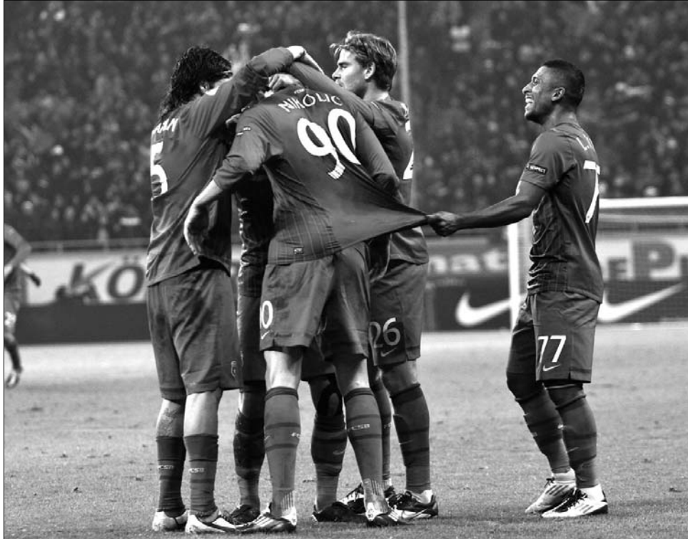
A Steaua és a Twente korábban már találkozott egymással az Európa Ligában

A B csoport ból a belga Standard Liege (1-0 a dán København otthonában) és a német Hannover 96 (3-1 az ukrán Vorskla Poltavával) jutott tovább, az I betűjelűből pedig az Atlético Madrid (3-1 a Stade Rennes-nel) és az Udinese (1-1 a Celtic Glasgow-val).