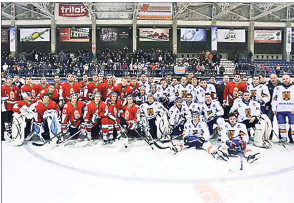
A magyar himnuszt együtt énekelte végig a csíki és a magyarországi csapat, a román alatt hallgattak