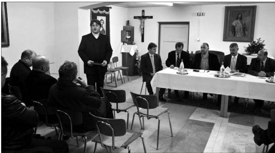
Az egyház képviselőivel is egyeztettek az RMDSZ politikusai a civil konzultációk keretében.

zetének elnöke az önkormányzati vezetőkkel Árkoson tartott találkozón rámutatott: amióta az RMDSZ kormányon van, a magyarlakta településekre nagyobb mértékben érkeznek kormánytámogatások. Kelemen Hunor, az RMDSZ elnöke kifejtette: a gazdasági válság miatt a 2012-es költségvetés nem lesz nagyobb, mint az ideje volt, ám kiemelt figyelmet fordítanak arra, hogy az elkezdett beruházások a településeken folytatódjanak. Tamás Sándor szerint „a megye méretéhez képest” kielégítő a költségvetés-kiegészítésből kapott összeg. Kovászna megyében összesen hat települést érint a költségvetés-kiegészítés: Árkosnak csatornázásra és szennyvíztisztító állomásra összesen 700 ezer lejt, Dálnok esetében vízvezeték építésére 800 ezer lejt, Gelencének kanalizálásra 1, 1 millió lejt, Lemhénynek 700 ezer míg, Rétynek 23 ezret infrastruktúra-kiépítésre, ezenkívül Zabolának, a szennyvízelvezető hálózat kialakítására 816 ezer lejt utaltak. A Kovászna megyei tanácselnök arról is beszámolt, hogy Háromszéken minden második község rendelkezik saját sportcsarnokkal, Antal Árpád sepsiszentgyörgyi polgármester pedig arra hívta fel a figyel-