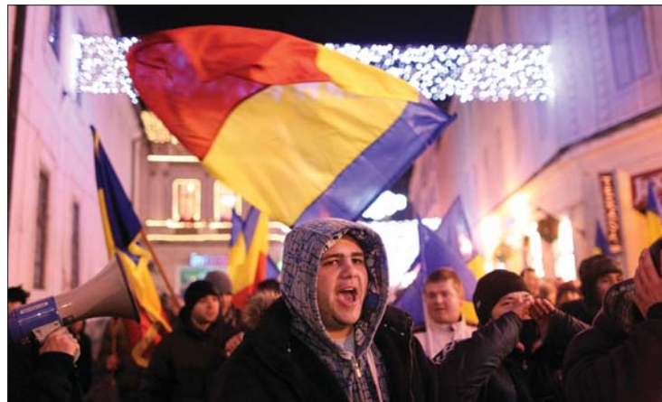
Kormányellenes jelszavakat skandáltak a temesvári évfordulón