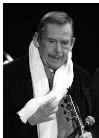
Václav Havel (1936-2011)

A „bársonyos forradalom” előestéjén, 1989 novemberében még börtönben volt, de rövidesen a mozgalom élére állt, majd a még szocialista csehszlovák szövetségi állam köztársasági elnökévé választották. Havel személyében így Csehszlovákiának újra „börtönviselt” államfője lett. (Elődjét, a kommunista Husákot, saját elbarátai tették hűvösre az ötvenes