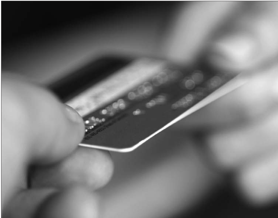
A karácsonyi bevásárlást egyre többen bonyolítják le otthonról, ám kényelem és veszély együtt jár

Vásárlás előtt a legfontosabb dolog, hogy a kiválasztott online médiumot, áruházat, weboldalt illetően ki nyomozzuk: mennyire elé-