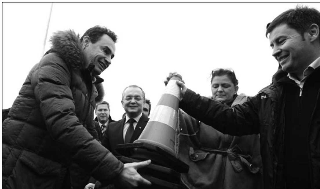
Gheorghe Falcă aradi polgármester, Emil Boc, Anca Boagiu és Traian Igaș belügyminiszter az avatáson

A 33 kilométeres sztrádaszakasz mellett az autópályának megfelelő aradi gyűrű 12,25 kilométeres szakaszát is átadták a forgalomnak. Ezen egyelőre csak egy sávban zajlik mindkét irányban a forgalom, és óránként 60 kilométeres sebességkorlátozás van érvényben (miközben az autópályán pillanatnyilag 100 kilométer a megengedett óránkénti sebesség, mivel az út mentén még folynak a munkálatok). A pálya-