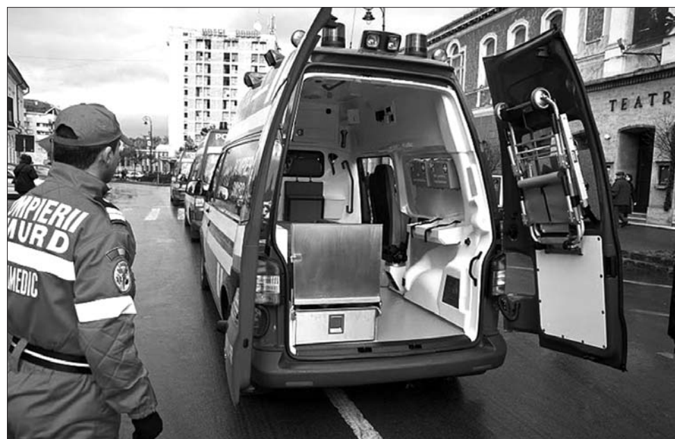
A három rohammentő-autó Szentgyörgy, Kézdivásárhely és Bodzaforuló körzetét fedi le.

látást a lehető legnagyobb szakmai igényességgel. A SMURD-központ avatását követően Ritli László meglátogatta a sepsiszentgyörgyi kórházat, ahol átadták a térség legkorszerűbb komputeromográf készülékét is. A gépet az Egészségügyi Minisztérium által kiutalt pénzből, a Kovászna Megyei Tanács rész támogatásával vásárolta a kórház, egy olyan képalkotó csomag részeként, amelynek összértéke 2,5 millió lejt. A szaktárca idén 4 millió lejjel támogatta a Kovászna Megyei Kórházat, amiből 1,3 millió lejt fordítottak a betegellátó osztályok korszerűsítésére. ◀