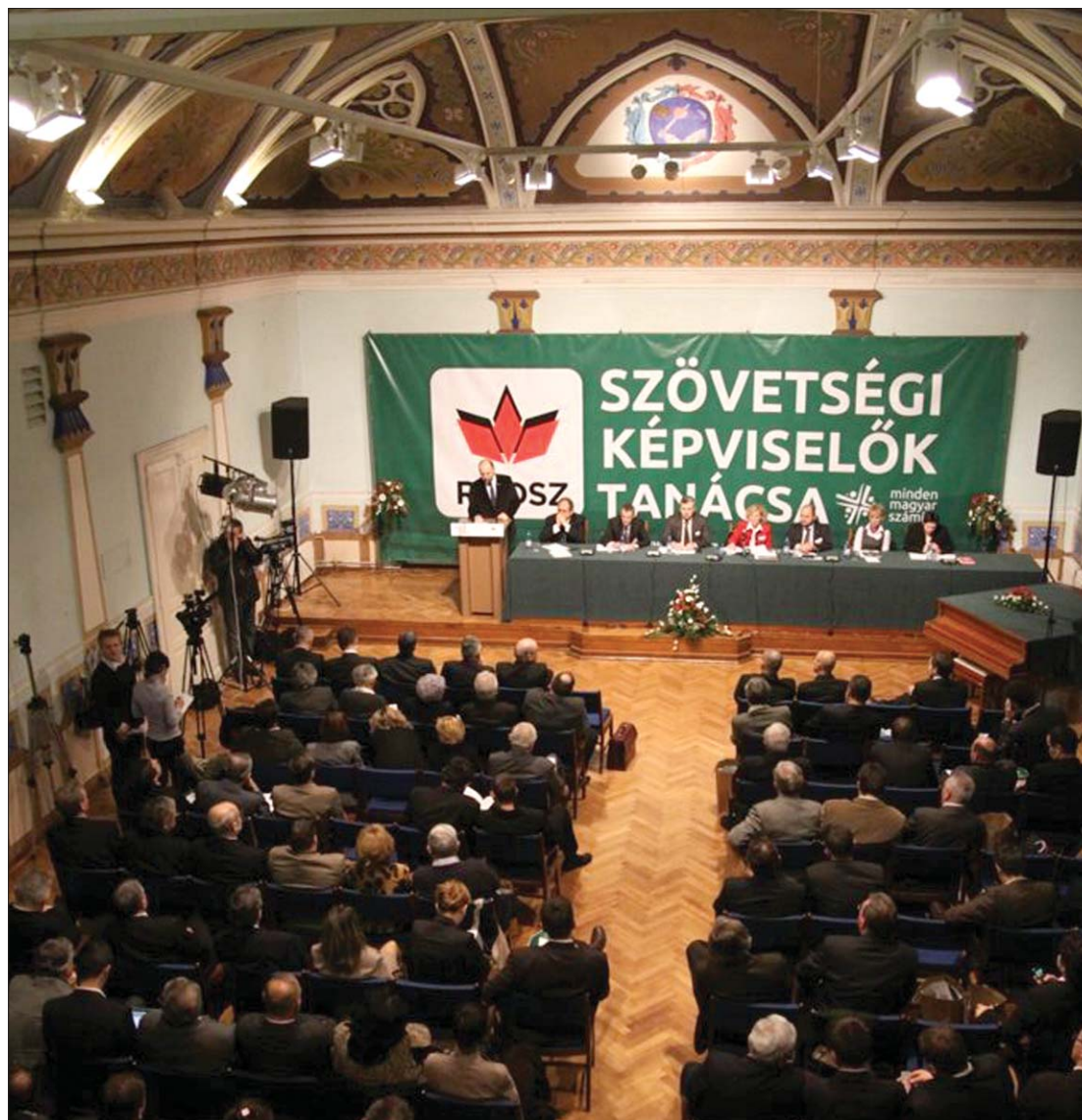
A sepsiszentgyörgyi Bod Péter Megyei Könyvtár Gábor Áron terme igencsak szűknek bizonyult

Ezüstfenyő-, illetve a Téglás Gábor-díjakat adták át az RMDSZ „miniparlamentjeként” működő Szövetségi Képviselők Tanácsának szombaton, Sepsiszentgyörgyön tartott ülésén. A tizenhat év után Háromszékre visszatért SZKT-n elfogadták az RMDSZ szórványstratégiáját és a szövetség családpolitikájának gyakorlatba ültetését célzó cselekvési tervet. Egy nappal korábban, szintén Sepsiszentgyörgyön, az RMDSZ tisztségviselői civilekkel konzultáltak. 3. és 7. oldal ▶