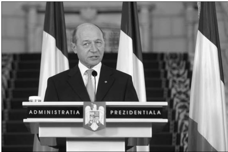
Traian Băsescu további költségvetési megszorításokat kért

Emil Boc kormányfő tegnap arról tájékoztatta a jövő évi költségvetés iránt érdeklődő szenátust, hogy a büdzsétervezetést csak azt követően nyújtja be megvitatásra, hogy a sarokszámokat áttekintette az Európai Bizottság (EB) és a Nemzetközi Valutaalap (IMF) mától Romániában tartózkodó küldöttségével. A miniszterelnök azt követő-