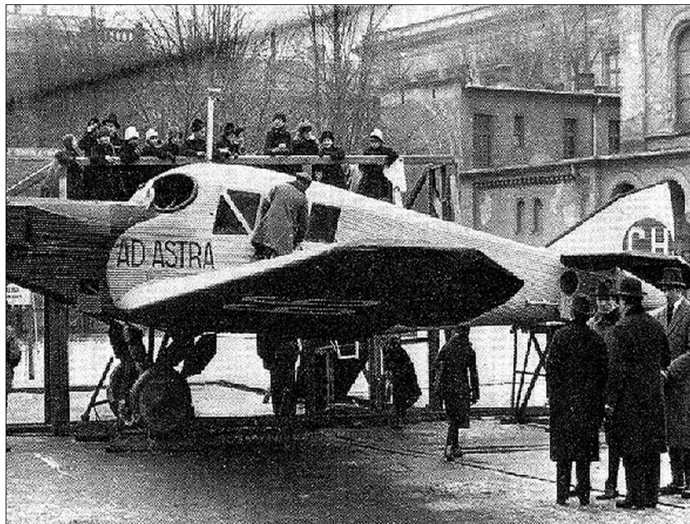
A királypuccs repülőgépe: IV. Károly a világ első merevszárnyú gépevel próbált „visszarepülni” trónjára

Április 3-án a nagyhatalmak közös jegyzékben szögezték le: nem tűrik el a Habsburgok restaurációját, s a hadsereg hamarosan az országon belül is Károllyal szemben lépett fel. Károly