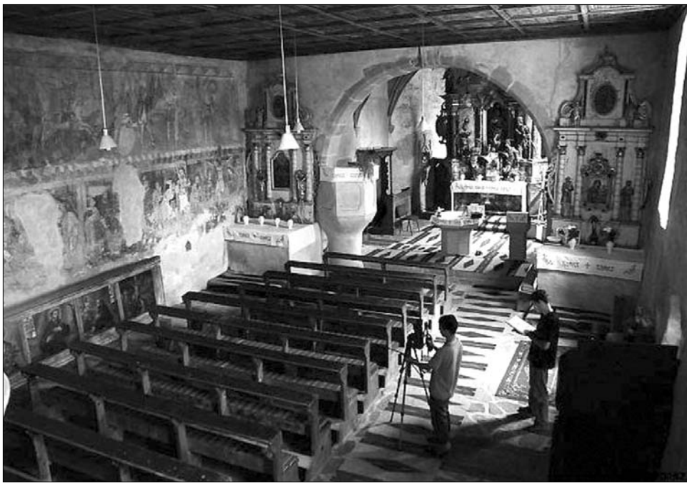
A Retropolisz második, kastélyokat bemutató évada a modern dokumentumfilmek trendjeit követi

A műsor második évada az udvarházak, vasúti épületek, fürdővárosok, templomok, kastélyok és várak ismertetése után ezúttal kizárólag az erdélyi kastélyokra összpontosít. Öt kastély bemutatásával azonban nemcsak az épített örökségre irányítja a figyelmet, hanem turisztikai, tudománytörténeti, művészettörténeti, kultúrtörténeti, gasztronómiai érdekességeket, ingyencségeket is a nézők elé tár. A sorozat egyenként 23 perces részei többek között a vajdahunyadi, bethlenszentmiklósi, alvinci, valamint a Teleki, Haller, Bruckenthal és Bánffy család kastélyainak titkait mutatják be. Mindegyik rész rövid család-történettel kezdődik, majd két-három kastély, középtétel, udvarház kerül közelképbe – tájékoztatta lapunkat Keresz-