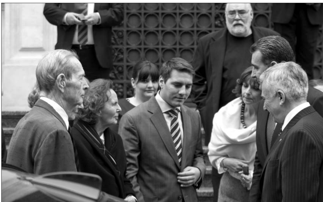
Mihály király (balra) tegnap családja körében érkezett a Román Nemzeti Banknál tartott ünnepi ebédre