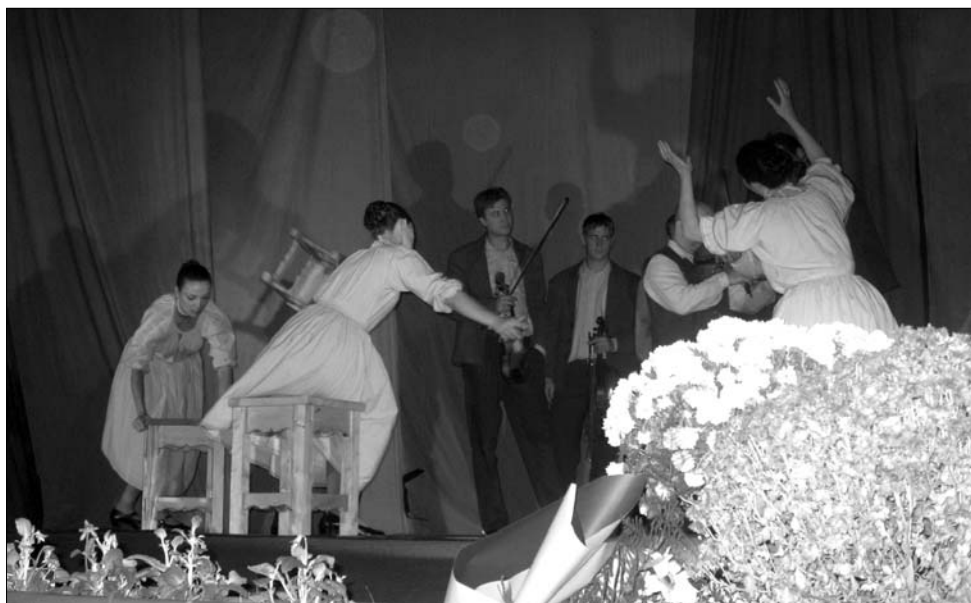
A Háromszék Táncegyüttes előadásával értek véget a 13. Szeben Megyei Magyar Napok