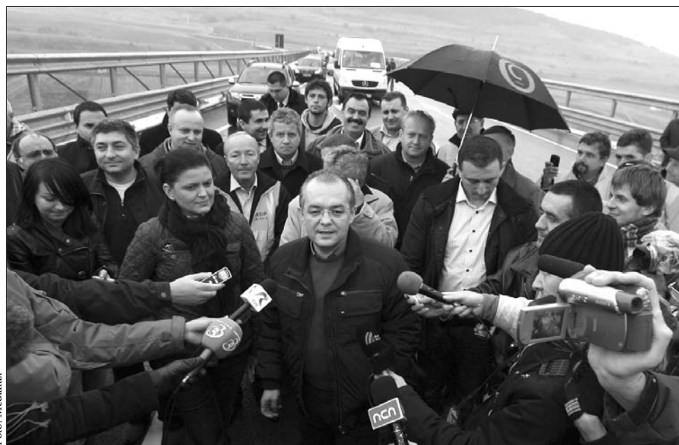
„Az autópályaprojektek folytatódhatnak” – jelentette be Emil Boc a kolozsvári körgyűrű felavatásakor

Megfigyelők szerint az uniós támogatás komoly átörökös lenne az évek óta „halódó” autósstráda-projektek számára. Gazdasági szakemberek már régóta figyelmeztetnek, hogy a hiányos útinfrastuktúra miatt az ország jelentős beruházástól esik el, ráadásul többletterheket ró a működő vállalkozásokra is. ◀