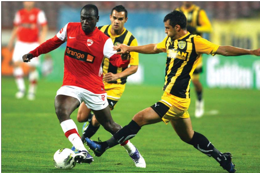
A „vörös kutyák” Bukarestben nem bírtak a bátran támadó brassóiakkal (sárga mezben)

A Liga-1 vasárnapi másik mérkőzésén, a Mioveni–Ploiești-találkozón sem esett gól, de annak eredményétől függetlenül a Dinamo még mindig őrzi vezető helyét a tabellán.