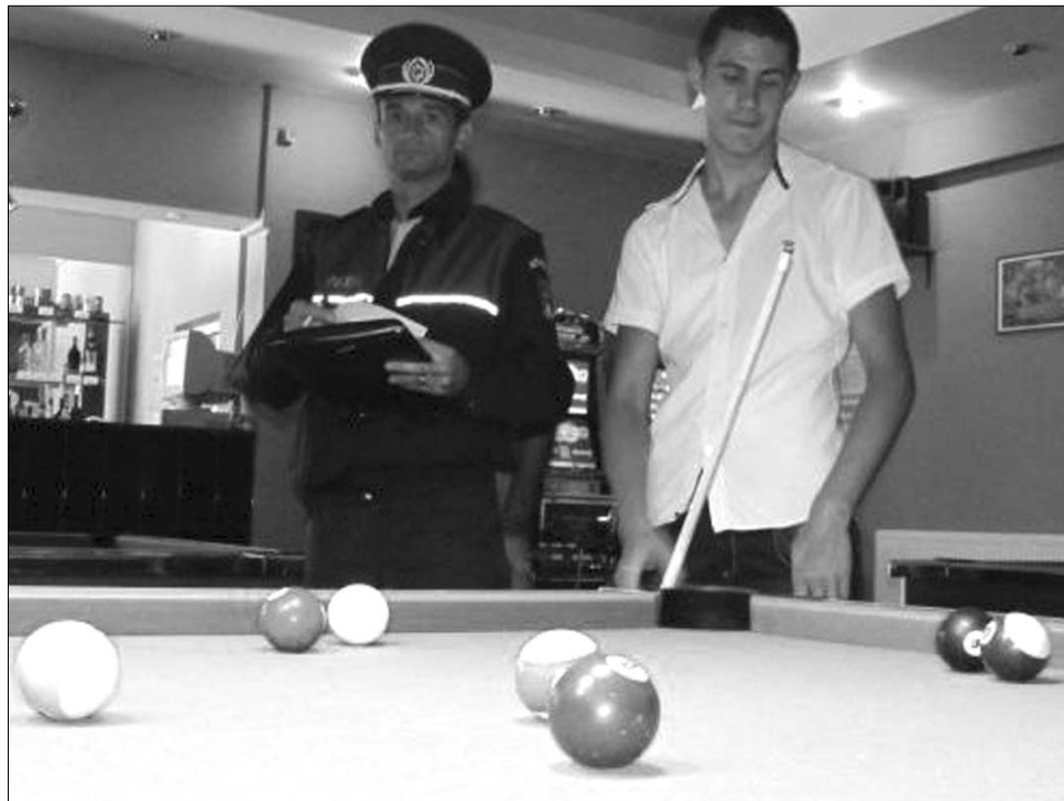
A tanügyminiszter tervei szerint rendőrök ellenőrzik majd az iskolából igazolatlanul hiányzó diákokat Zsebből lógók