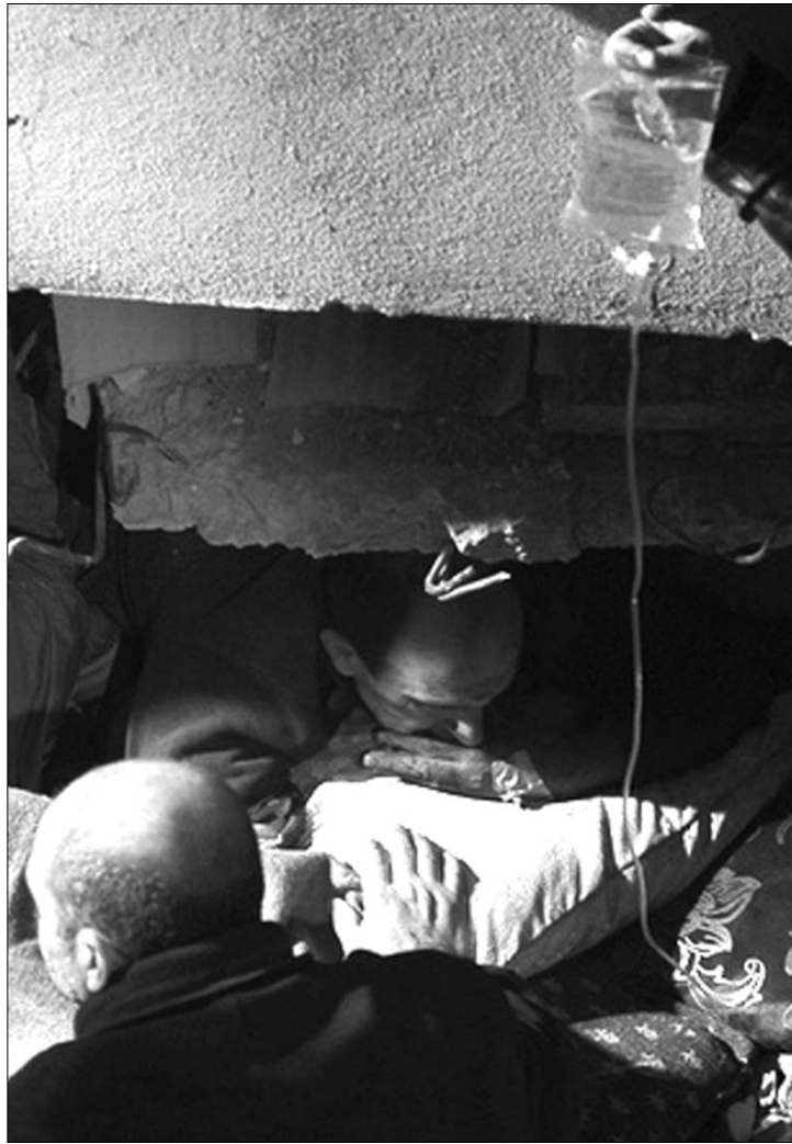
Mentésre váró túlélő a romok alatt a törökországi Van tartományban

Az amerikai geológiai intézet (USGS) közben 7,3-asról 7,2-es