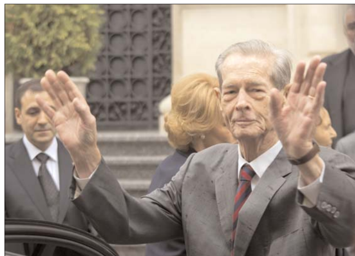
A kilencvenéves Mihály ma a parlamentből üdvözli „népét”

meghívni a törvényhozásba. A volt uralkodó tegnap a Román Nemzeti Bank központi székházának márványtermében adott ünnepi ebédet. 3. és 4. oldal ▶