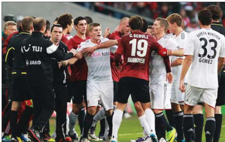
A Bayern (fehér mez) pont nélkül távozott Hannoverből

A Ferencváros 3-0-ra legyőzte a vendég Újpestet a magyar élvonalbeli labdarúgó-bajnokság 13. fordulójában, és így sikerült előrébb lépnie a tabellán. A többi eredmény: Honvéd–DVTK 2-1, Vasas–Paks 1-0, Zalaegerszeg–Siófok 1-1, Haladás–Kaposvár 1-1, Kecskemét–Pápa 3-0, Győr–Videoton 1-0, PMFC–Debrecen 0-0. A tabella élén: 1. Debrecen 33 pont, 2. Győr 31, 3. Honvéd 23. ◀