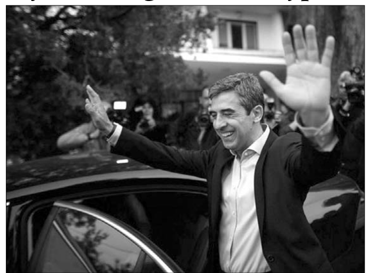
Roszen Plevneliev, a kormányzó párt elnökjelöltje 40 százalékot kapott