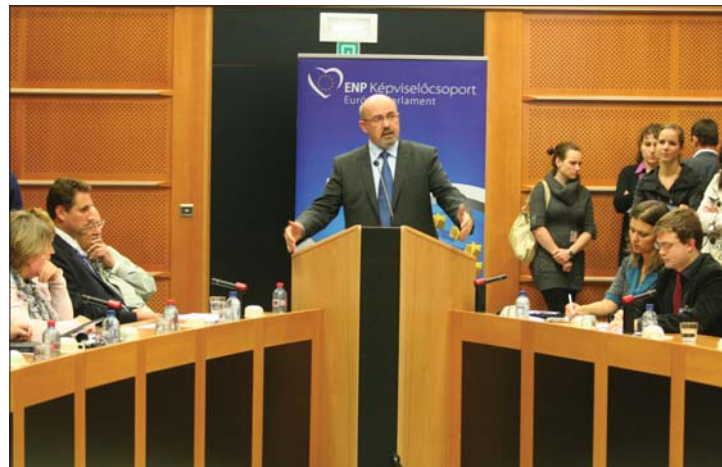
Markó Béla az etnikai autonómiák esélyéről beszélt az EP-ben.

lyettes tegnap este könyvbemutatóra is részt vett; a rendezvényt kínos incidens előzte meg: a könyvbemutatóra invitáló plakátokat Tőkés László EP-alelnök sértő felirattal ragasztotta le. 2. oldal ▶