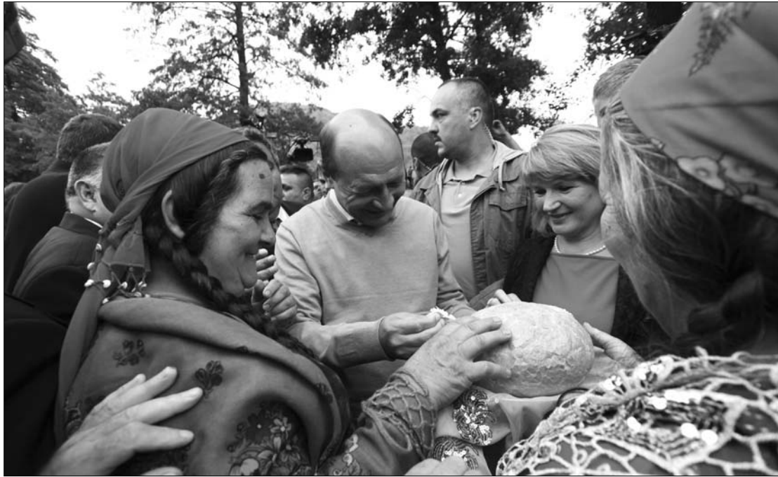
Traian Băsescu és feleségét kenyérral és sóval fogadták az államelnök által diszkriminált cigányok