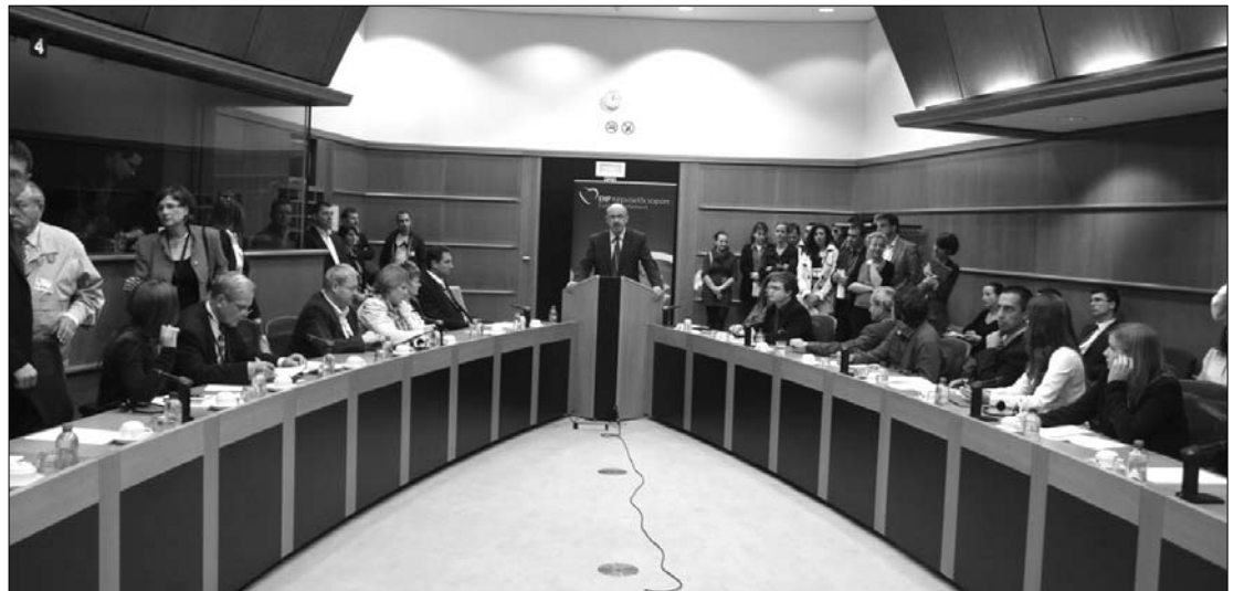
Markó Béla miniszterelnök-helyettes az Európai Parlamentben. Az európai autonómiákat hiányolta

Mint mondta, 1989 után a jogfosztott magyar közösségnek szinte a nulláról kellett kezdenie a kisebbségjogi keretek kialakítását. „Sokat léptünk előre főként az anyanyelvű oktatás, az államosított egyéni és közösségi tulajdonok visszaszolgáltatása, a magyar nyelv, illetve a nemzeti szimbólumok nyilvános használata terén. Ezzel szemben a kollektív jogok elfogadtatása és a különböző autonómia-formák kiépítése még mindig várat magára” – tette hoz-