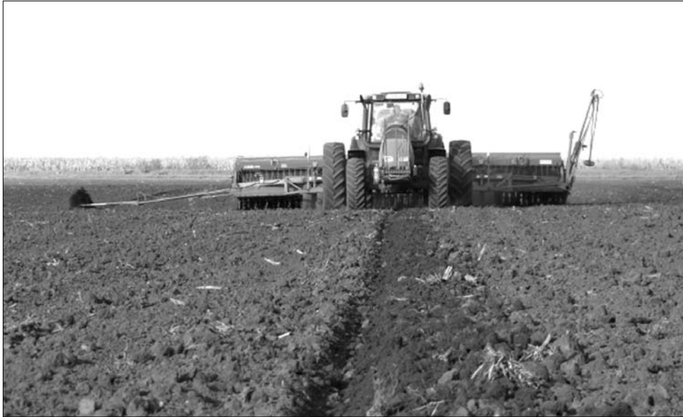
Fáradtságos, költséges, rizikós az idei őszi vetés. A szárazság megkérdőjelezi a jövő évi aratást

Kisebbségi eltéréssel ez a helyzet egész Nagykároly vidékén, amely az ország egyik legjelentősebb búzatermő övezetének számít. Mezőpetriben például 350 hektáron vetettek, további 150 hektáron most készítik elő a magágyat – a helyzetből adódóan a megszokottnál több munkával és anyagi ráfordítással, ami mindenképpen növelni fogja a jövő évi kenyérnekvaló