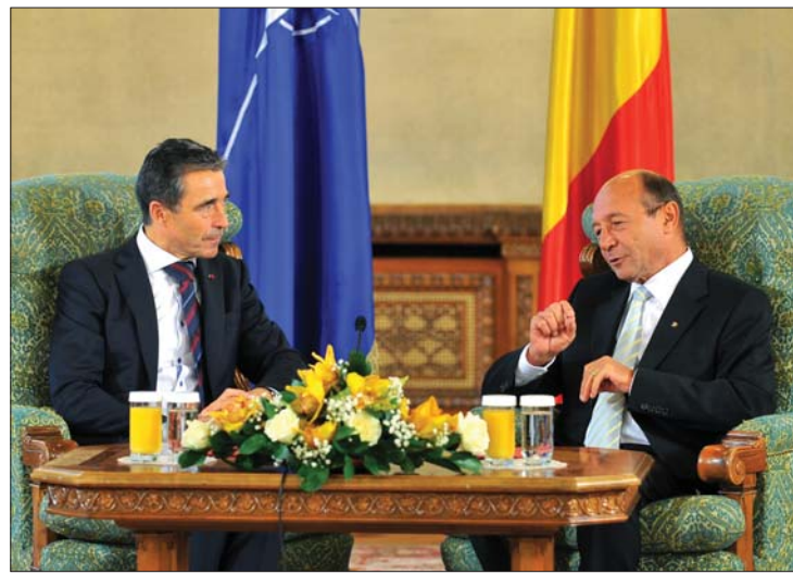
Anders Fogh Rasmussen NATO-főtitkár és Traian Bănescu államfő

partnerség keretében befogadott rakéta-pajzsot ért támadásokat, majd arra szólította fel Oroszországot, vonja ki katonáit Moldovai Köztársaságból. 3. oldal ▶