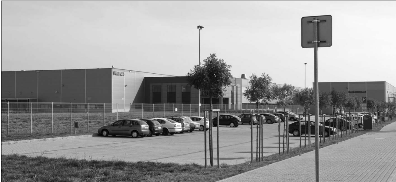
Végkielégítés, madártávlatban. A szakszervezetek szerint a tárgyalások hetekig elhúzódhatnak