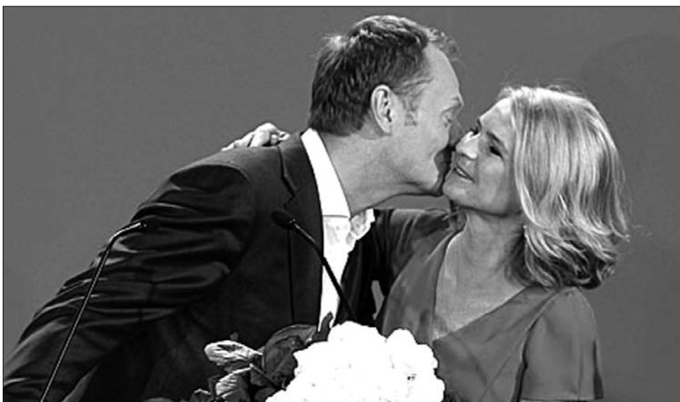
A lengyelországi választások győztese, Donald Tusk. Felesége hitvesi csókkal jutalmazta

A konzervatív Rzecznokpolitika kommentátora úgy véli: nem a PO kormányzása volt annyira meggyőző,