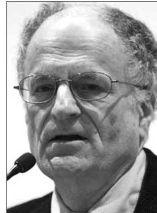
Thomas J. Sargent