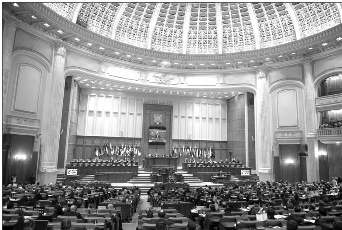
A NATO Parlamenti Közgyűlése tegnap Bukarestben határozatot hozott az afganisztáni átmeneti folyamat támogatásáról

A NATO Parlamenti Közgyűlése tegnap elfogadott egy határozatot, amelynek értelmében a testület támogatja az afganisztáni átmeneti folyamatot. Ez utóbbi révén olyan helyi rendfenntartó erőket kell létrehozni, amelyek képesek átvállalni a NATO-erők 2014-es kivonulása után az ország biztonságának megőrzését. A határozat szerint elsőbbséget élvez az átmeneti folyamatban a korrupció visszaszorítása, és biztosítani kell, hogy az e jelenség ellen küzdő szervezetek ne kerüljenek politikai befolyás alá. A határozat sürgeti az afganisztáni választási reformot is. ◀