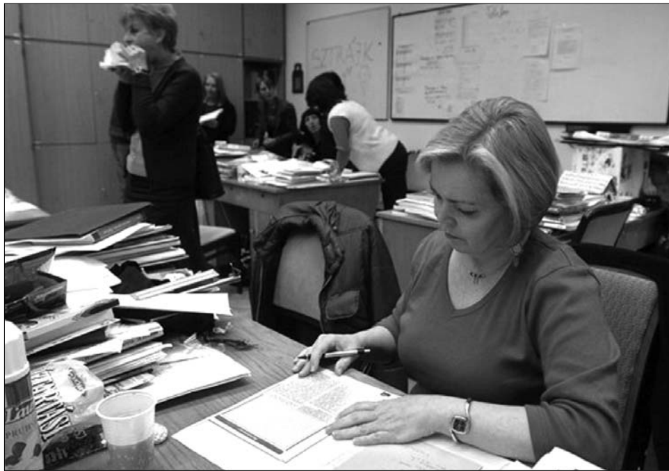
Nem csak a fizetés miatt elégedetlenek a tanárok: szerintük a pályakép sem biztató

„En azután mondtam fel, hogy kiderült, hol és milyen körülmények között kell ta-