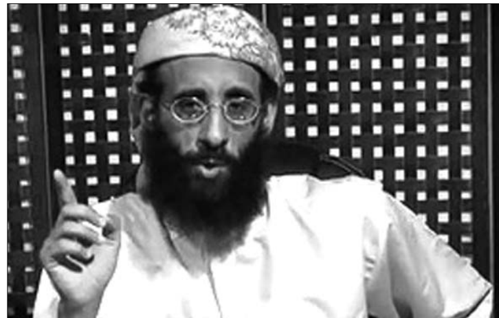
Awlaki megölése „törvényes” volt. Nem lehetett élve elfogni őt

Awlakival együtt egyébként életét vesztette egy másik amerikai állampolgár, Samir Khan is, aki az Arab-félszigeten működő al-Kaida angol nyelvű magazinját gondozta. Khan a lap szerint feltehetően nem szerepelt a célpontok között, az ő halála „járulékos veszteség” volt. A második megölt amerikai családja nyilatkozatban tiltakozott a likvidálás miatt. A The New York Times nem tudta megszerezni a memorandumot, cikke az azt „ismerő személyek” nyilatkozatain alapult. ◀