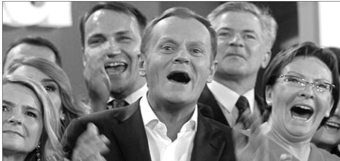
Donald Tusk kirobbanó öröme. Tovább nőtt pártjának előnye, csak az a kérdés: hol áll meg a „varsói gyors”?

százalékos volt. A kormányalakítási tárgyalások tegnap már meg is kezdődtek. Ezt megelőzően Donald Tusk miniszterelnök felkereste Bronislaw Komorowski államfőt. Grzegorz Napieralski, az SLD elnöke bejelentette, hogy az új parlament megalakulása után összeül a párt kongresszusa, és megválasztja az SLD új vezetőit. Közölte, hogy személy szerint ő nem indul újra az elnöki tisztrét. ◀