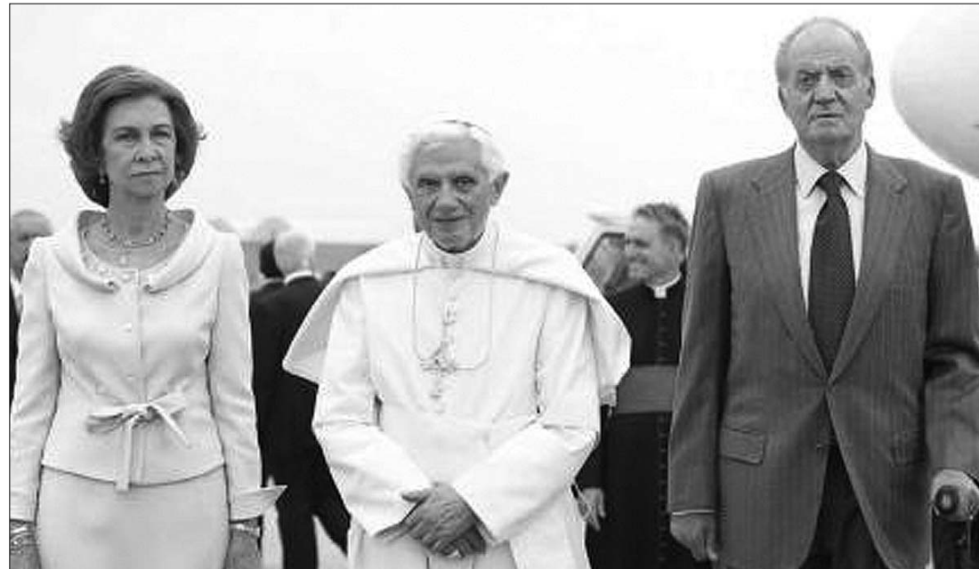
A pápa a spanyol királyi pár között. XVI. Benedek a Katolikus Ifjúsági Világtalálkozóra érkezett Madridba

A spanyol királyi pár fogadta XVI. Benedeket