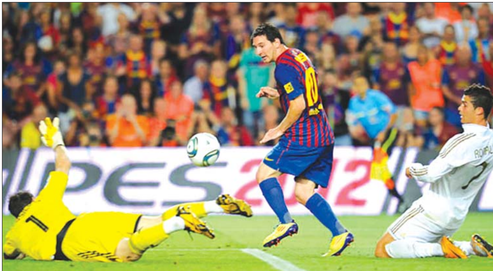
Lionel Messi ismét brillirozott az ősi vetélytárs ellen: két gólt is rúgott a Madridnak

A katalánok végig irányítottak, Iniesta góljára Ronaldo, Messiére pedig Benzema válaszolt, hogy az argentin sztár második találatát már felelet nélkül maradjon. A 82. percben cseréként pályára lépett a katalánok új szerzeménye, Cesc Fabregas. Az idei ötödik El Clásico botrányba fulladt, miután az utolsó másodpercekben Marcelo csúnyán felrúgta Fabregast. A tettet kiállították, de piros lapot kapott a kakaskodásban élen járó Villa (Barcelona) és Özil (Real) is. Mourinho Tito Villanova szemébe nyúlt, mire a Barcelona másod-