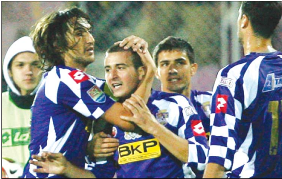
Alexa és Zicu nélkül is a másodosztályba száműzött Temesvári Poli célja a feljutás

Az élvonalból a temesváriakhoz hasonlóan licencproblémák miatt kizárt Besztercei Gloria Târgovișten kezd, a Chindia ellen. Ez a mérkőzés szombaton, 11 órakor kezdődik, csakúgy, mint a Nagyvárad Luceafărul–Dévai Mureșul-, Nagybányai Máramaros FC–FC Argeș Pitești-, CSM Râmnicu Vâlcea és CSM Slati-