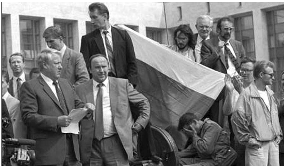
Elnöki beszédet tartott. Borisz Jelcin híressé vált, történelem-alakító „tankjelenet” 1991-ben

Máig tisztázatlan, hogy a puccsisták miért viselkedtek ennyire dilettáns módon, és augusztus 19. reggelén miért nem vették őrizetbe a dácsájában Jelcint. A ház mögött ekkor már néhány napja becsúsgók ógyelegek, köröskörül a KGB különleges egységei állomásoztak; Jelcin ennek