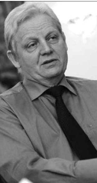
Tarlós István – a hős terminátor

lasolja a számtalan állam-polgári kérdést, amely nap mint nap az önkormányzathoz érkezett. Kollégáim között volt hithű szocialista, elvakult jobbkios, lángelkű liberális, mérsékelt jobboldali. Eltérő világnézettel, de köz-tisztviselői eskükhöz híven politikamentesen, békében dolgoztunk mi együtt, egymás mellett, egy célért. Nem szolgáltunk ki senkit, de szolgálói voltunk egy ügynek, Budapest ügyének. A városért dolgoztunk. És soha nem kérdezte meg feljebbvalóink közül senki, hogy kire szavaztam, melyik párttal szimpatizálok. Hagytak bennünket dolgozni. És így repült el fölöttem a Bajnai-kormány egy éve. Összességében 16 évet dolgoztam már le. Van elismerésem Göncz Árpádtól, Szekeres Imrétől, Katona Kálmántól, kitüntetésem Szalay Ferencről, Búsi Lajostól. El-