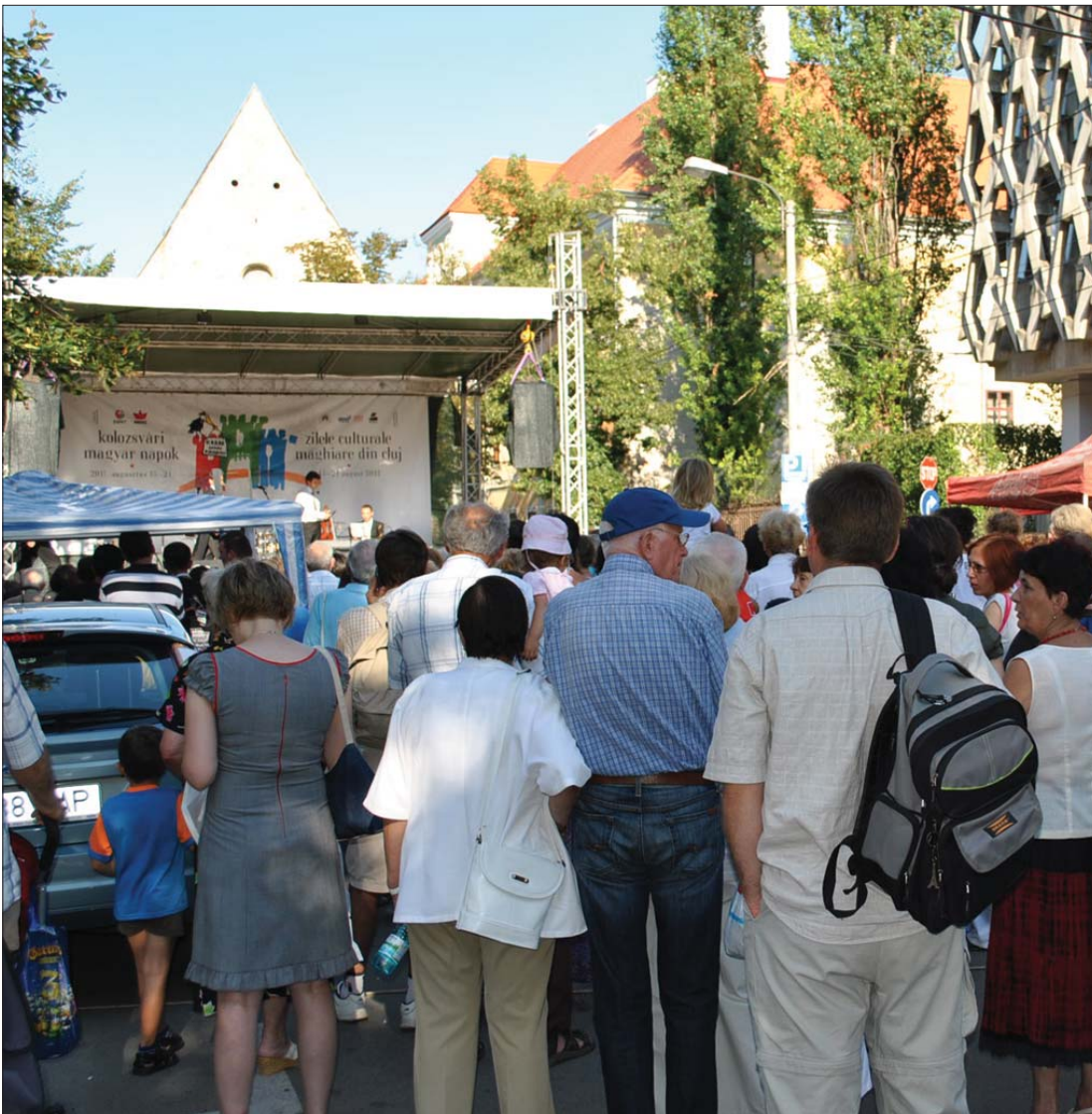
Igazi fesztiválhangulat. A Kolozsvári Magyar Napok rendezvényei a Farkas utcába költöztek

Napok vendégeként a kincses városba látogat Schmitt Pál. Magyarország köztársasági elnöke megkoszorúzza a főtéri Márton Áron-szobrot majd megnyitja a 100 Tagú Cigányzenekar koncertjét. 6. oldal