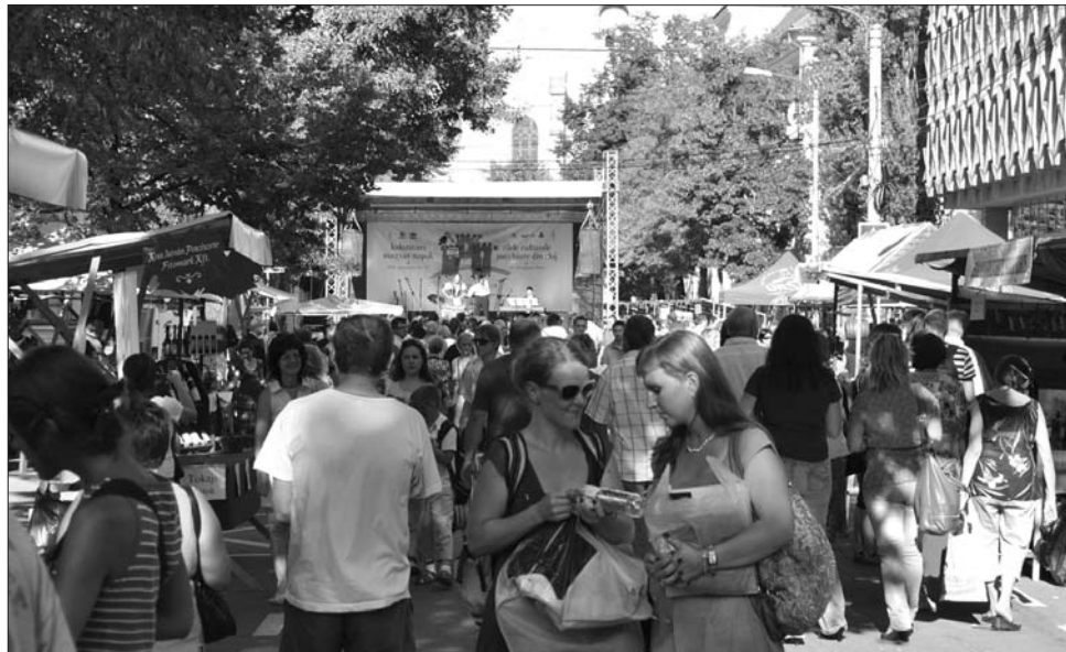
Az utcára költözött rendezvény igazi fesztiválhangulatot kölcsönöz a városnak