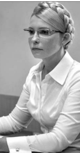
Julija Timosenko – utána több is jön talán?

Bírószá elé állították Julia Timosenkót. A volt ukrán kormányfőt azzal vádolják, hogy visszaélt hatalmával, mivel 2009-ben a kormány jóváhagyása nélkül túl magas áron kötött gázvásárlási szerződést Oroszországgal. Timosenko tagadja a vádat, bilincsben vezetik el. Hívei Kijev főutcáján, a Krescsatikon zajosan tüntetnek mellette. A másik szerződő fél, Oroszország tiltakozik. Külügyminisztériumi nyilatkozatok szerint a szerződés a két ország törvényei és a nemzetközi normák megtartásával kötötték meg.