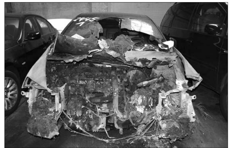
Egy roncs a sok közül. A titokzatos berlini gyújtogató drága kocsikban utazik

Az autógyújtogatás nem új keletű bűncselekmény Németországban, immár évek óta sújtja elsősorban Berlint és Hamburgot, de az ország más városait is. A német fővárosban ismeretlen tet-