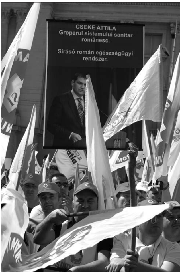
Cseke-ellenes tüntetések. Hasonló sors vár Ritlire is?

Cseke Attila úgy fogalmazott: azt sajnálja, hogy hivatali ideje alatt nem tudta megszüntetni az egészségügyi finanszírozásának kettősségét. „Hivatalba lépésem pillanatában jeleztem, hogy a legnagyobb problémák az Országos Egészségbiztosítási Pénztár működtetésével és nem az egészségügyi minisztériummal kapcsolatban merülnek fel. Ma a biztosító nem írhat ki közbeszerzési eljárást az országos gyógyszer-programok működtetéséhez” – tette hozzá Cseke Attila, utalva arra hogy a gyógyszerek beszerzéséhez szükséges pénzről viszont az egészségbiztosító dönt. A politikus szerint a következő időszakban az lesz a legfontosabb változás, hogy a CNAS működését az egészségügyi minisztérium koordinálja, így a minisztériumnak meg lesznek a szükséges eszközei a rendszer átalakításához.