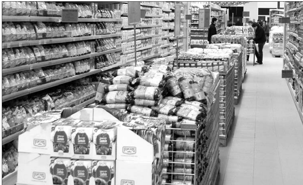
▲ Az infláció lassulása júniusban az élelmiszerek árcímkein volt leginkább „tettenérhető”

A dezinfláció esetében az árak szintje emelkedik ugyan, de ez a növekedés az időben lassul, egyre kisebb mértékű lesz. Jelen helyzetben az élelmiszerárak 1,3 százalékkal lettek olcsóbbak, amelyet az egyéb fogyasztási cikkek 0,2 százalékos, illetve a szolgáltatások 0,7 százalékos drágulása kísért. Az élelmiszerek árát a mezőgazdaságban most kezdődő betakarítási szezon befolyásolta leginkább – ennek követke-