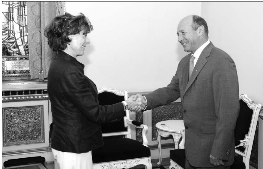
Traian Băseșcu államfő tegnap hivatalában fogadta az Európai Bizottság alelnökét, Nellie Kroest

A kormánypalotában tartott találkozón részt vett Valerian Vreme távközlési miniszter is. A tárcavezető ismertette a biztossal Románia 2020-ig terjedő informatizálási stratégiáját, amely szerinte az uniós digitális politikájához igazodik. ◀