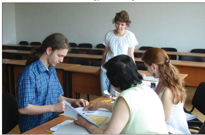
Kolozsváron 71 szakon tanulhatnak magyarul a diákok

magyar szakon várják a felvételizőket: mindenhol indult anyanyelvű képzés, ahol erre igény mutatkozott, és ahol az oktatás minősége biztosítható. 7. oldal ▶