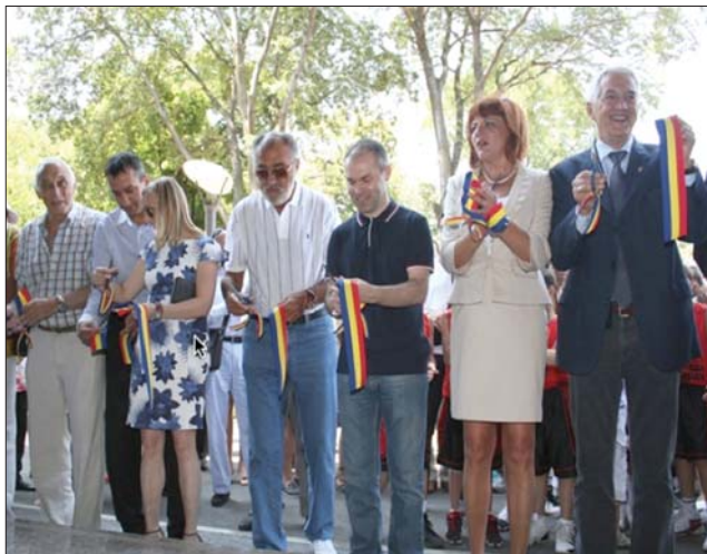
Az avatáson a román sport jeles személyiségei vettek részt

Anton Neto-litzchi sem. A 2011/12-es belföldi idény első sorsolásait már az új székházban ejtették meg tegnap. A férfi bajnokság október elsejei nyitófordulójában az alábbi párosításban játszanak: Bukaresti CSA Steaua–Marosvásárhelyi Maros KK, Medgyesi Gaz Metan–Energia Rovinari, Csíkszeredai Hargita Gyöngye KK–BCM U Pitești, Craiovai SCM CSS–CSS Giurgiu, Bukaresti Dinamo–CS Otopeni, Szebeni Atlissib ESK–Nagyvárad MSC, CSU Ploiești–Koloșvári U-Mobitelco BT, Temesvári BC–Bukaresti CSM. Mindjárt a nyitófordulóban tehát Ploiești–Koloșvári-csúcsrangadó, miután a két gárda vívta a legutóbbi kiírás döntőjét. ◀