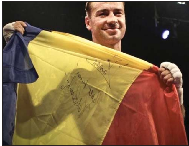
Lucian Bute 4,5 millió hazai nézőt vonzott a képernyők elé

Lucian Bute győzelmének nem mindenki örült, Leonard Doroftei például élesen bírálta honfitársát. Az egykori profi világbajnok szerint látszott, hogy a szorítóban és azon kívül is mindenki várta a kiütést, még Mendy is, s a KO érkezett is – nem az ötödik menetben, ahogy ő jósolta, hanem egyvel hamarabb. „Nem volt egy látványos mérkőzés. Bute üzletet csinál az ökölvívásból” – állítja Doroftei, aki szerint Bute eddig gyenge ellenfelekkel bokszolt a nagyon gyenge IBF-verzióban. ◀