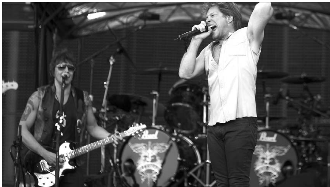
A csapat frontembere, John Bon Jovi csúcsmódban volt, egy hónappal ezelőtti térdműtete ellenére

„De megérte!” – vélekedtek egyhangúan a vasárnap éjjel körül az Alkotmány térről a metrólejárók irányába igyekvők, akik közül többen a „bálványaik” által éppen előadott számokat dúdolták: a Raise Your Hands -et, a Bed of Roses -t, az It's my life -ot. A városközpont felé hömpölygő tömeg nyomában pedig lassan megérkeztek a köz-tisztasági vállalat szemeteskoscsijai, és a hatalmas színpadot lebon-