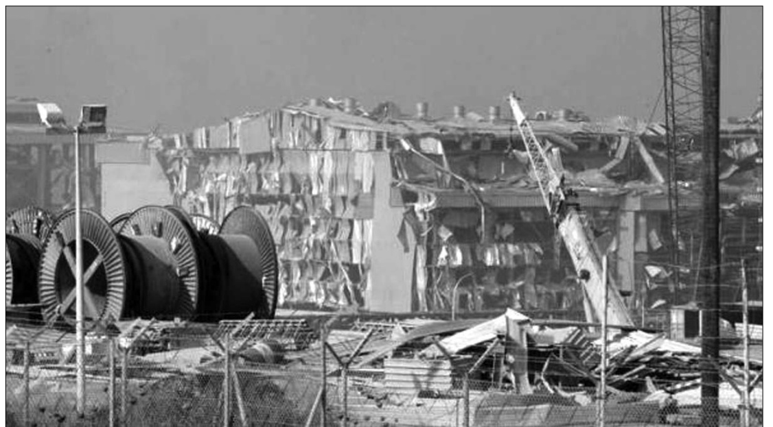
Ciprus válságos helyzetbe került. A robbanás számos épületet, szolgáltató intézményt romba döntött

A hatóságok hosszabb távra szólóan feltételezik, hogy gondok lesznek a közszolgáltatásokkal. A kiesett erőmű ugyanis a sziget áramigényeinek mintegy a felét látta el, s az ellátás most két kisebb berendezéstől függ. A fővárosban, Nicosiában és a legna-