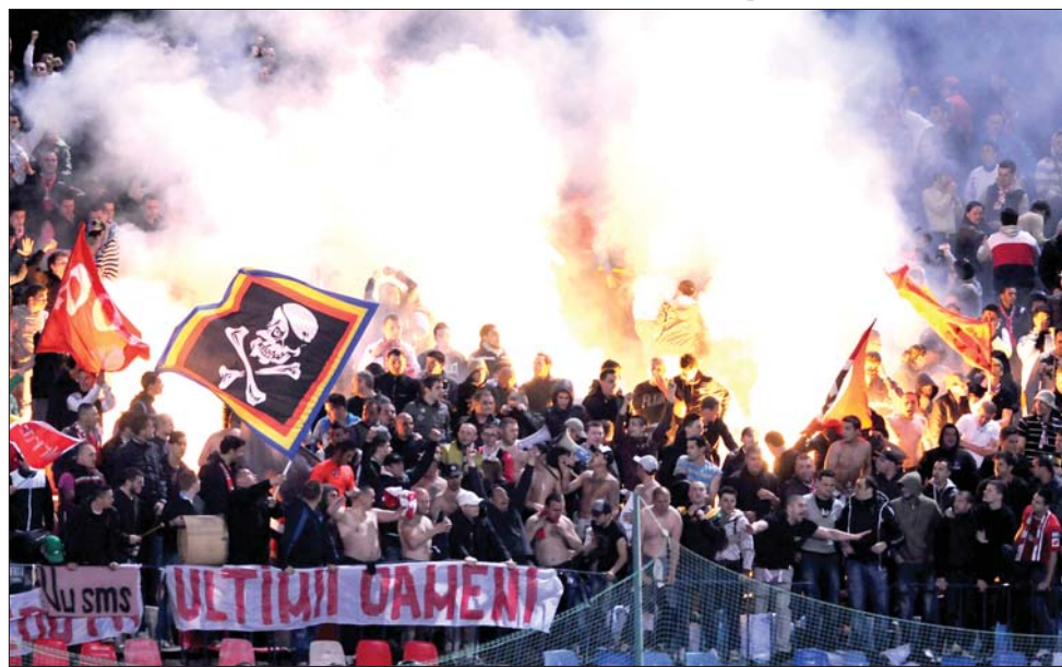
Az első negyedóra végén a Steaua stadionjának vendégszektora kis híján felgyúlt

Metan (2-0) – 16 óra, GSP Tv, Pandurii–Steaua (0-2) 18 óra, Digi Sport, Kv. U–Temesvár (2-2) - 20.30 óra, Digi Sport. ◀