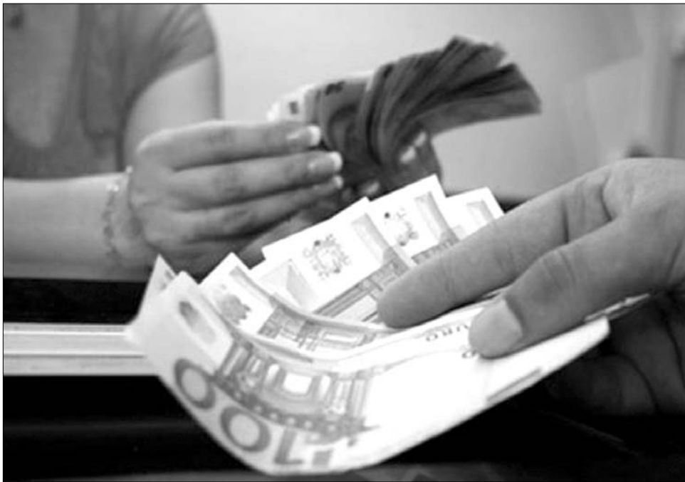
Nem sietik el. Szakértők szerint mindenkinek jó lenne az euróvezetési csatlakozás halasztása

„Az euró bevezetése egy ambiciózus terv, de egy Romániához hasonlóan, lába-