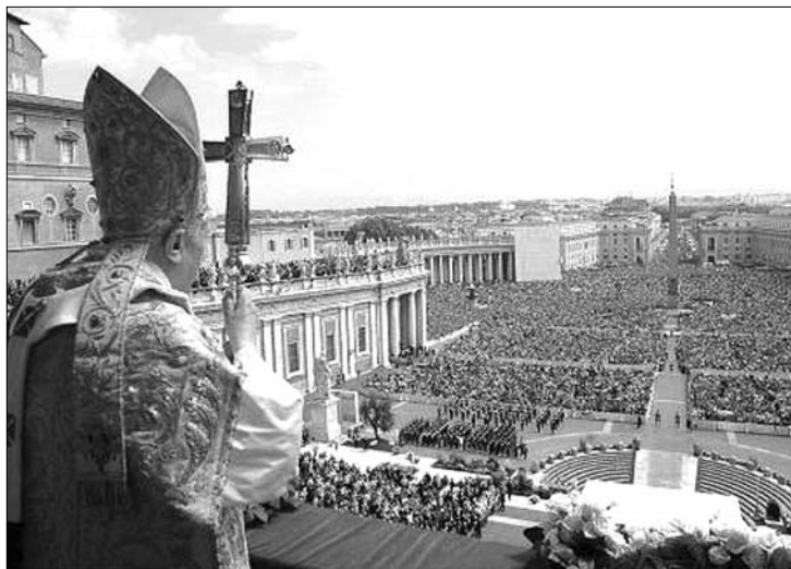
Urbi et orbi. Áldást osztott és Líbiában békét sürgetett a pápa

Vasárnap a Szent Péter téren Urbi et Orbi (Róma városáért és a világra) áldást osztott a pápa a hívek és a turisták hatalmas tömege előtt. Szentbeszédében XVI. Benedek a líbiai harcok befejezését, párbeszédet és a diplomácia szerepvállalását sürgette. ◀