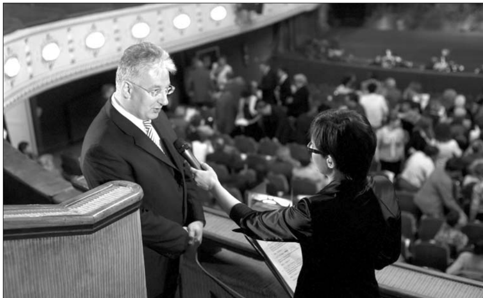
Semjén Zsolt magyar miniszterelnök-helyettes a kolozsvári galaest vendége volt

Az új magyar alkotmányt számos kísérő rendezvény köszöntötte. Az alaptörvény tiszteletére ünnepi bé-