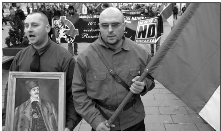
Leossák a gyalázatot? Avram Iancu éltették a szélsőjobbok.