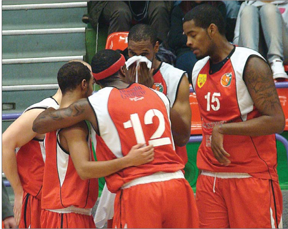
A csíkszeredai csapat játékosainak temesvári bravúrja bentmaradást jelenthet

71, Gyulafehérvári LPS-Nagyvárad CSM U 68-45. A Politehnica Iași-Brassói Galactica-találkozót ma délután pótolják. ◀