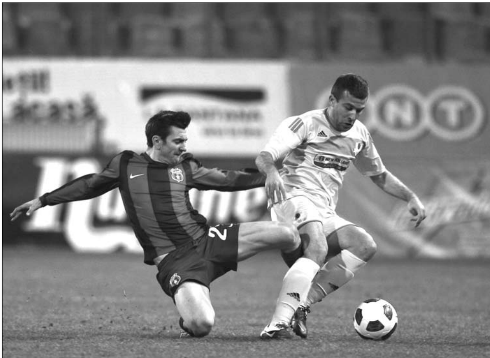
A Vaslui játékosai (fehér mez) sikerült Bukarestben sakkban tartaniuk a steauásokat