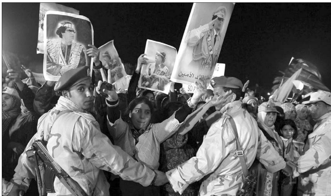
Élő pajzs katonákból és Moammar el-Kadhafi híveiből. A líbiai diktátor föld alatti titkos bunkerében rejtőzködik

Párizsban szombat délután vészérintkezlet kezdődött a líbiai helyzetről az Európai Unió, az Egyesült Államok és az Arab Liga tagjainak részvételével az ENSZ BT határozatának érvényesítése érdekében. A találkozó 22 résztvevője arról döntött, hogy azonnal katonai akció indul a líbiai polgári lakosság védelmében. Ezt követően szinte késedelem nélkül francia harci gépek repültek be az észak-afrikai ország légtérébe, és felderítő repüléseket végeztek, majd 17.45-kor megsemmisítették az első líbiai célpontot,