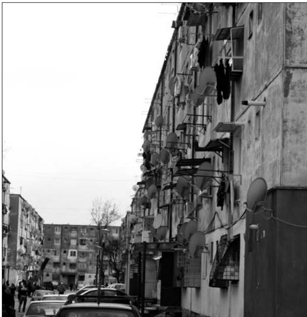
Ferentari lakónegyed, a román főváros legendás híru nyomortelepe

Azt kérdezzük mindenkitől: miért kezdett el drogozni? A legtöbben a környezet okolják. Itt a családtagok, szomszédok, barátok, mindenki drogozik. nehéz „tisztá-