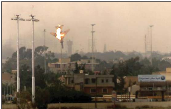
A líbiai felkelők egyik vadászgépét lelőtték a Kadhafi-hű kormányerők

válaszul működésbe léptek a líbiai légvédelmi ütegek. Tévészédében Kadhafi „hosszú háborút” ígért, és bosszúval fenyegetőzött. 2. és 4. oldal ▶