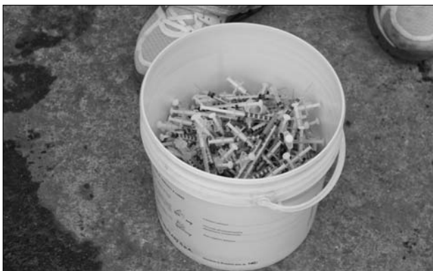
Az akció során begyűjtött használt fecskendőket dobozostól elégetik