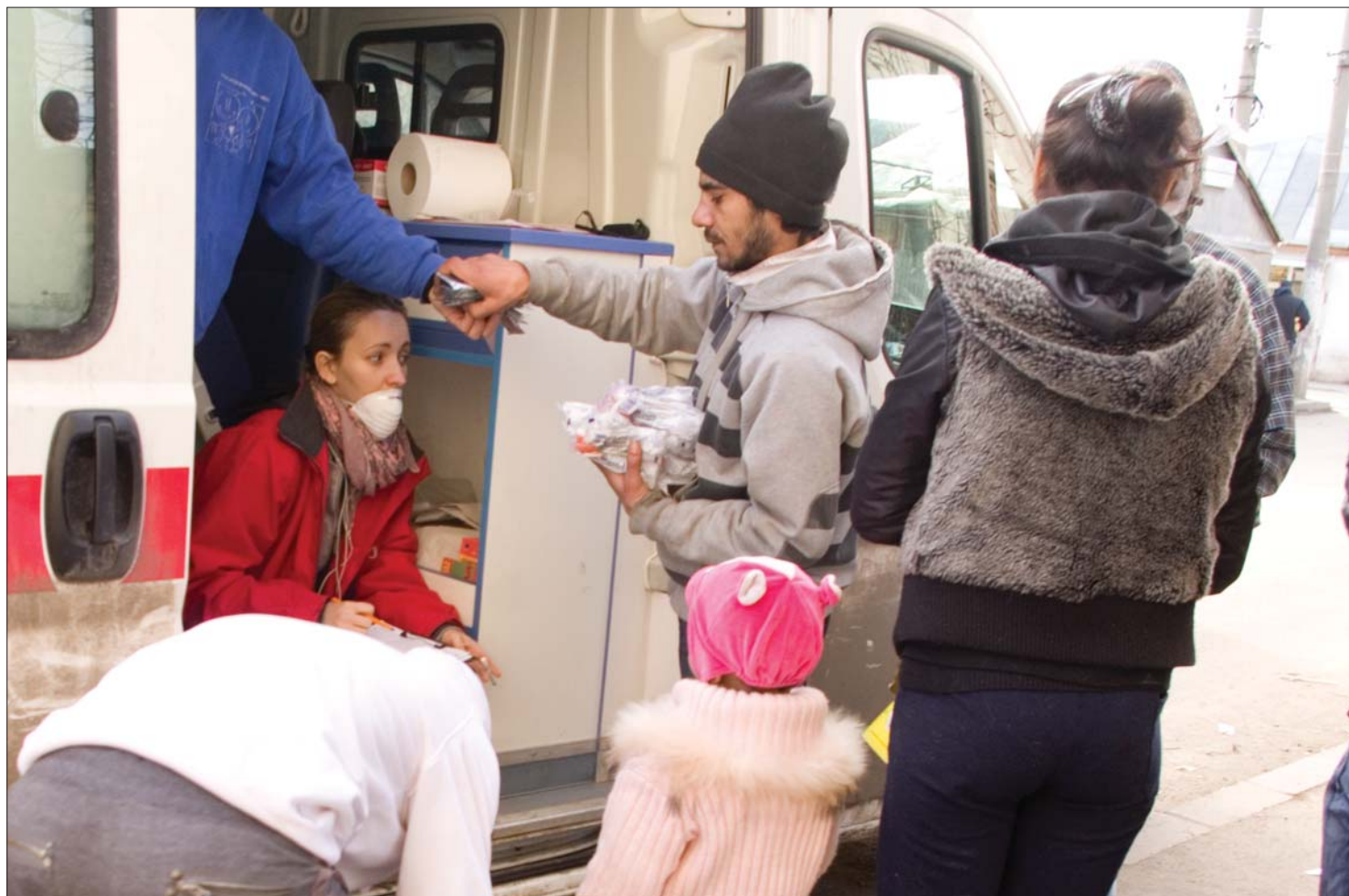
A ferentari-i gettó kábítószer-fogyasztói fertőzésveszélynek teszik ki magukat a drog befecskendezésére szolgáló tűk újrahasználása miatt.

Helyszíni riport a román főváros Ferentari lakótelepének kábítószerfüggőiről