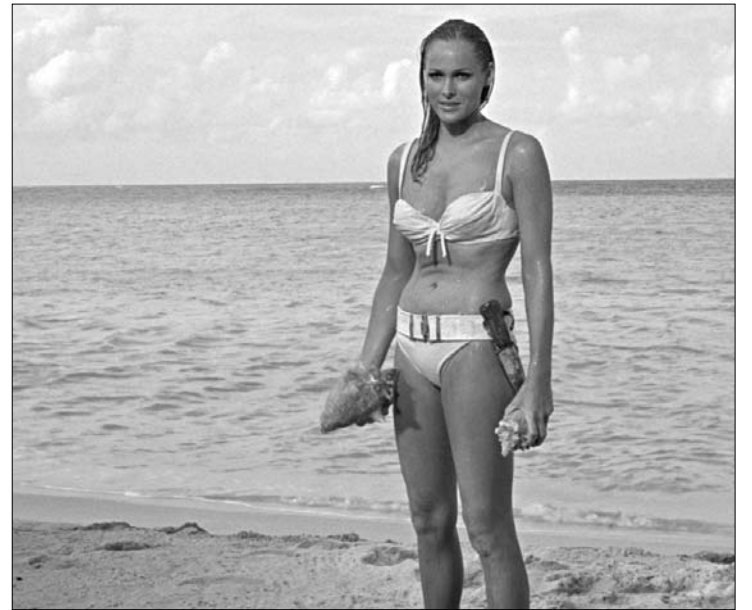
Ursula Andress, a Dr. No-s James Bond „üdvöskéje”