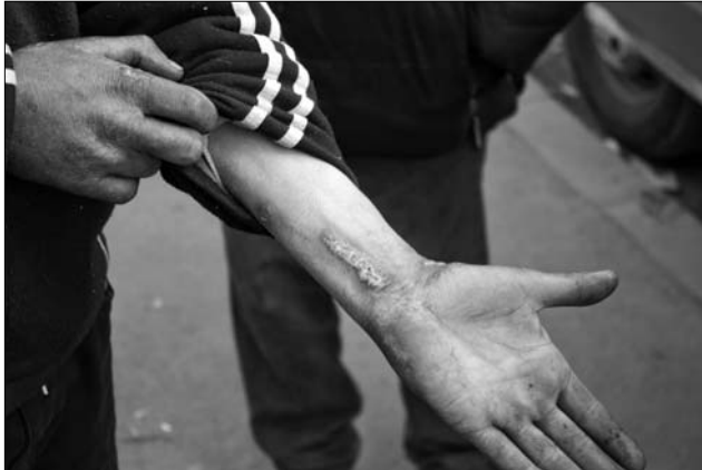
A heroingtól eltérően legális szerektől kisebesedik a szúrások helye