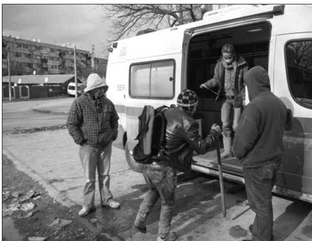
Az egyik „veterán”: 35 évesen ő az egyik legidősebb még élő drogos