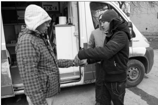
A testi fejlődés is leáll. Jobbra egy 15 évesnek látszó, 18 éves függő