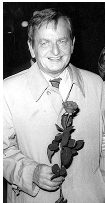
Olof Palme, a meggyilkolt kormányfő

A tegnapi évfordulóra időzítve jelent meg Henrik Berggren történet és újságíró átfogó életrajzi kötete erről az összetett emberről, Olof Palméről: az arisztokrátáról,