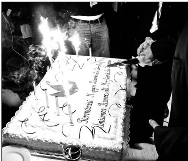
Ünnepi RMDSZ-habostorta. Kinek jut majd a nagyobb szelet?