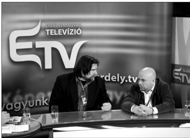
Kell egy kis áramszünet... Meghívott újságírók az ETV élő adásában