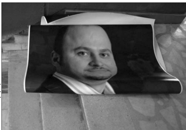
Tájkép csata után. Az egyik jelölt, aki gyűröttén került ki a harcból

A dohányosok előnyben voltak nem dohányzó kollégáikkal szemben, mert az éle- sebb fülűek a szakszervezeti palota lépcsőin „füstölgő” küldöttek beszélgetéseiből kulisszatitkokat tudhattak meg. Például azt, hogy Eckstein-Kovács Péter előre lefoglalta a termet és megrendelte a pezsgőt is a győzelmi ünneplésre, ám arra végül csak alig húsz szabadelvű ment el szombat este. A győztest, Kelemen Hunort nem ott, hanem a Moszkva nevű kocsmban ünnepelheték: a zsűfolt nagyváradi mulató vendégei soha láttak anynyi minisztert, államtitkárt, szenátort egy rakáson.