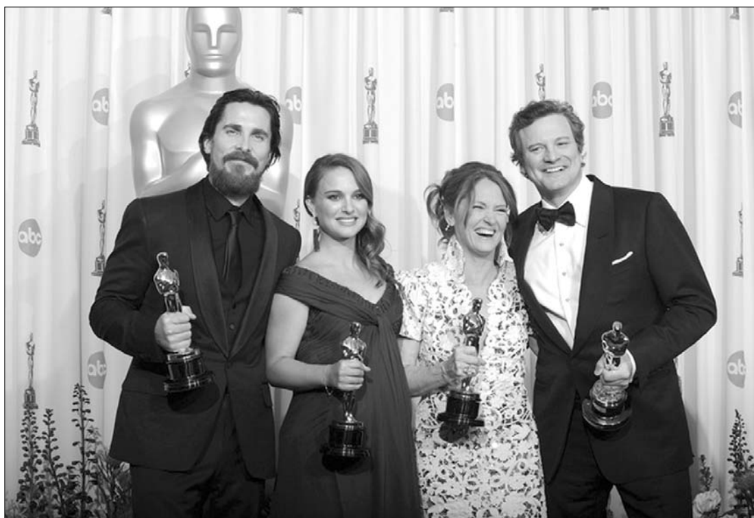
Christian Bale, Natalie Portman, Melissa Leo és Colin Firth – a 83. Oscar-gála legjobb színészei