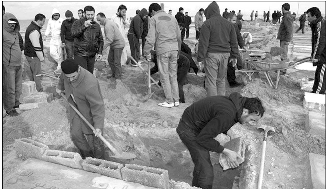
Már ezrekre rúg a halottak száma. Az emberek kalákában ássák a líbiai városokban a tömegsírokat

A Tripolitól 50 kilométerrel nyugatra lévő az-Záviya várost birtokló líbiai felkelők arra számítanak, hogy a Kadhafihoz hű katonák megostromolják a települést. Mintegy kétezer katona veszi körül az-Záviját. A líbiai vezetőhöz hű erők egyik