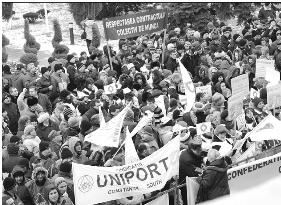
Konstanca mintegy háromszáz szakszervezeti tag tüntetett a prefektúra épülete előtt

Hasonló tiltakozásra került sor Botoșani-ban, Konstanca, Krassó-Szörény megyében és Vranceában is. Botoșani-ban hatszáz ember vett részt a demonstráción, a tüntetők végigvonultak a belvárosban, és követeléseiket írásban adták át a prefektusnak. Krassó-Szörény megyében szintén a megyeszékhely kormányhivatala előtt gyülekeztek a szakszervezeti tagok. Bár a tegnapi tüntetésen csupán százötvenen jelentek meg, a résztvevők figyelmeztettek: március 7-én több megyei kisvárosban újabb de-