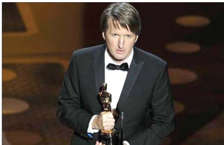
Tom Hooper, „A király beszéde” című film Oscar-díjas rendezője

► Virtuális díszletek között, interaktív filmbejátszások kíséretében adták át helyi idő szerint tegnap hajnalban az idei Oscar-díjakat, melyen a papírforma győ-