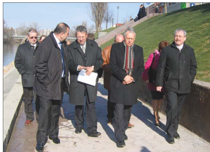
Miniszteri séta: középen Fazekas Sándor és Borbély László

▶ A természeti katasztrófák dacára jó évet zártunk – értékelte Borbély László környezetvédelmi miniszter a román-magyar környezetvédelmi vegyesbizottság munkáját Nagyváradon. 6. oldal ▶