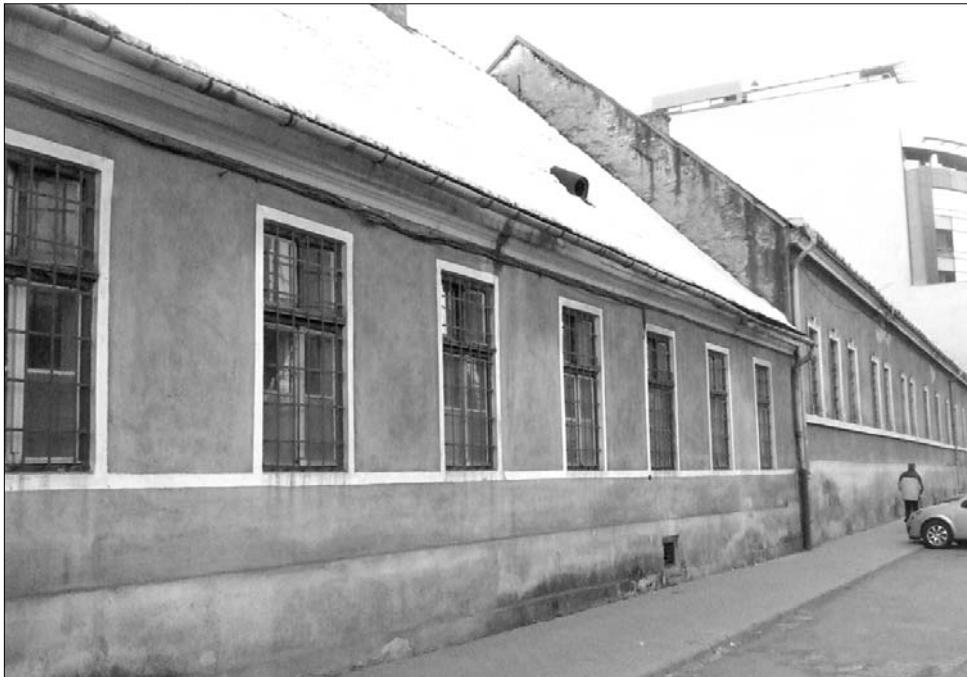
A kolozsvári régi kaszárnya helyére épülő ingatlanban zenélnék majd a filharmonikusok

A Transilvania Kulturális Központ megépítését a kincses város komolyzenei társulata már jó ideje várja. Mint ismeretes a nemzetközi hírnévnek örvendő