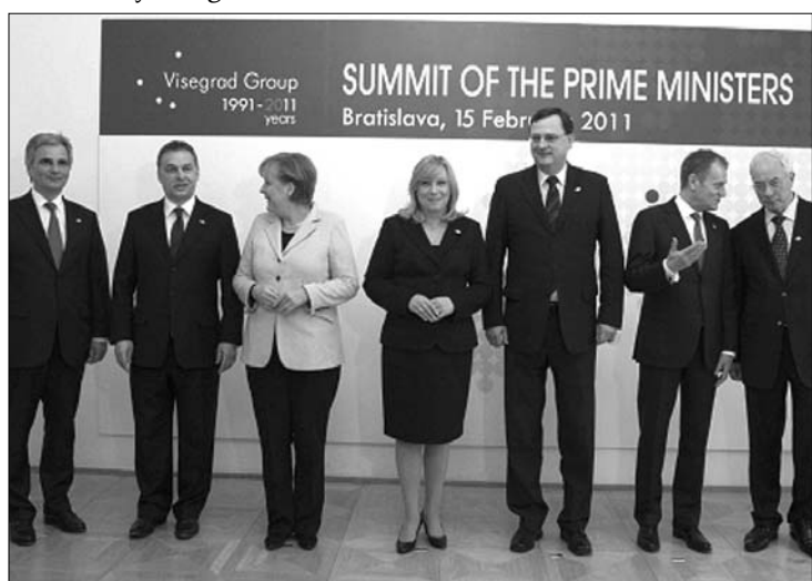
A V4-ek kormányfői és vendégeik. Aggódnak a világméretű áremelkedésekért

Tavaly július elsejétől idén június 30-ig Szlovákia tölti be a visegrádi csoport elnöki tisztségét, ezért tartják a jubileumi ülést a szlovák fővárosban. ◀