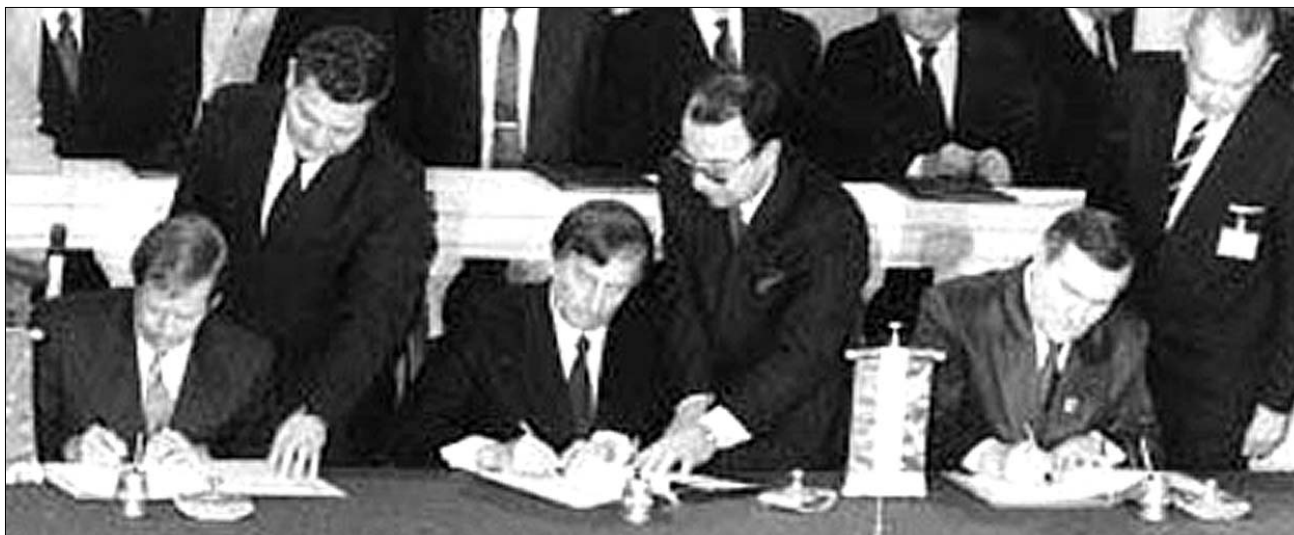
Vaclav Havel, Antall József, Lech Walesa. Megszületik a „Visegrádi négyek” születési okmánya

A visegrádi vár egykoron a magyar királyok székhelye volt, 1335-ben itt tartott találkozókat a három ország uralkodója. Károly Róbert magyar, János cseh és III. Kázmér lengyel király – valamint mai kifejezéssel élve „megfigyelőként” a Német Lovagrend, Károly morva őrgróf, I. Rudolf szász és III. Boleszló sziléziai-legnicai