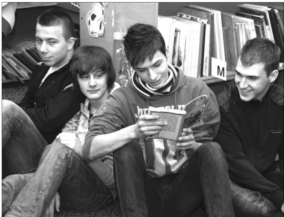
Az idei Mesemaronon közel ötezer diák forgatta közösen Jókai Mór közismert műveit