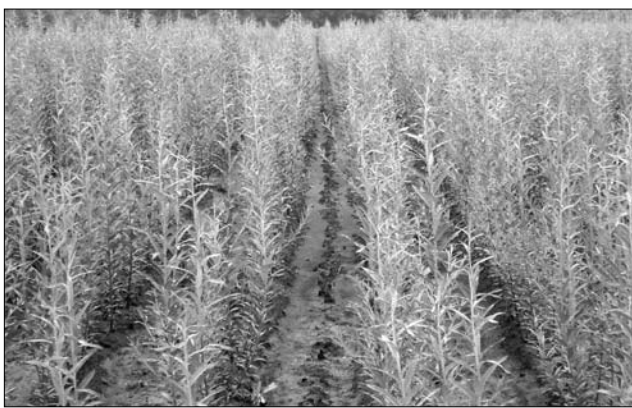
Energiafűültetvény – kevés munka, nagy haszon