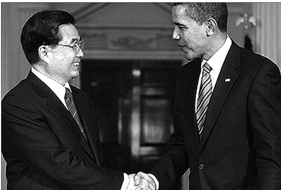
Hu Csin-tao és Barack Obama. Barátok vagy ellenségek?

Kína és az Egyesült Államok egymás második legnagyobb kereskedelmi partnere, mindkét ország számára