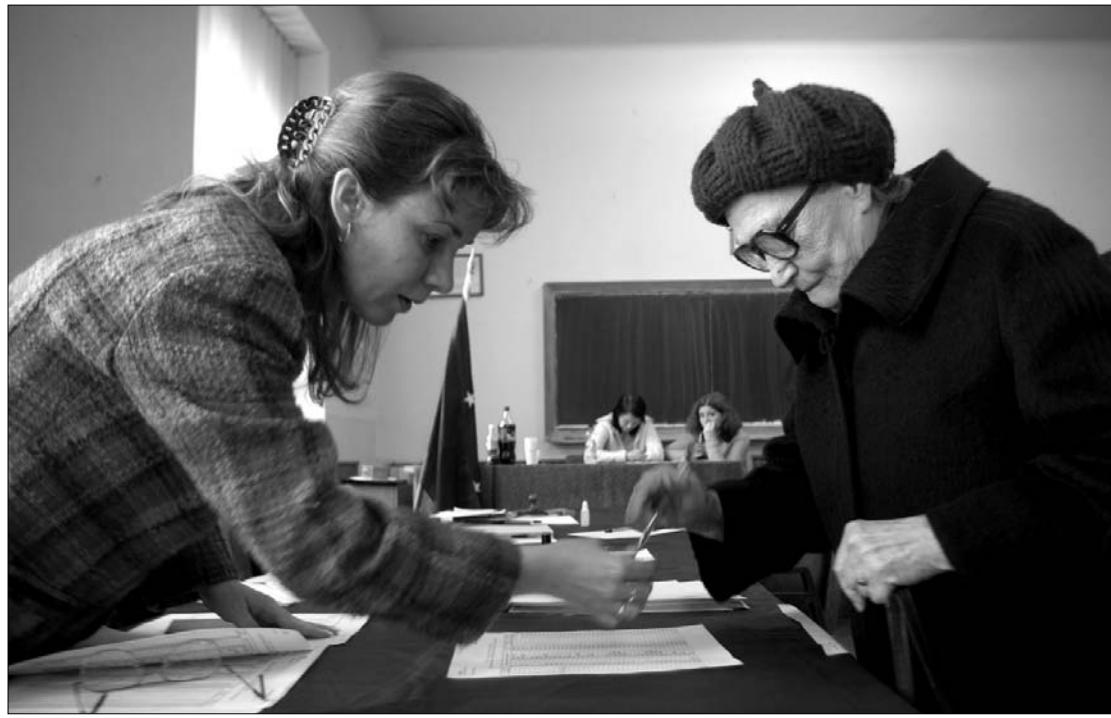
Ha a kormánykoalíció elfogadhatja tervét, jövőre csak egyfordulós helyi választásokat tartanak

Teodor Baconschi külügyminiszter a TVR Internațional nak adott interjúban reményét fejtette ki, hogy a távszavazást lehetővé tevő törvényt még idén elfogadja a parlament, így azt már a jövő évi helyhatósági és parlamenti választásokon alkalmazni lehet. A demokrata-liberális politikus úgy vélte, hogy így elkerülhető lesz majd a külföldi szavazókörzetekben tapasztalt tülekedés. Szerinte a távszavazócédulát el kellene látni olyan biztonsági elemekkel, amelyek lehetetlenné tennék a voksolási csalást. ◀