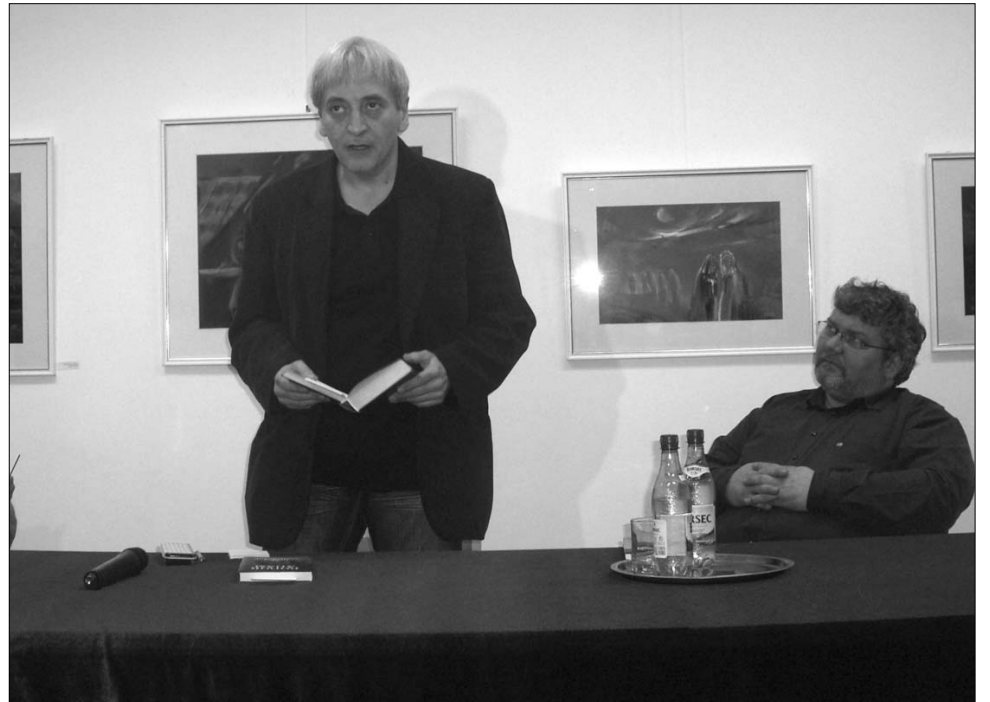
Kovács András Ferenc költő előadójaként is a szerepjátás mesterének bizonyult

ahogy egy regénynek kell befejeződnie, mert az olvasó csak a kötet végén léphet vissza saját világába. A Kovács András Ferenc költészetét meghatározó szerepjátásról is szó esett. A költő úgy fogalmazott, hogy ez egy ajándék, amit a költő kap, hogy más „bőrébe bújva” írja meg verseit. Kovács András Ferenc azt is elmondta, hogy egy „stiláris vágyat” érez magában arra, hogy mikor hogyan szólaljon meg. Ezért más és más szerepeket ölt magára, amikor Jack Cole néven írja verseit, vagy Lázár René Sándor által jegyzi azokat, és megint más most Asztrovként. Azt is megtudtuk, hogy a költő alteregójának egy egészen pontosan kidolgozott biográfiája van: „Alekszej Pavlovics Asztrov 1894-ben született Szentpétervárott, és Moszkvában halt meg 1985-ben, átélte az orosz irodalom sor-