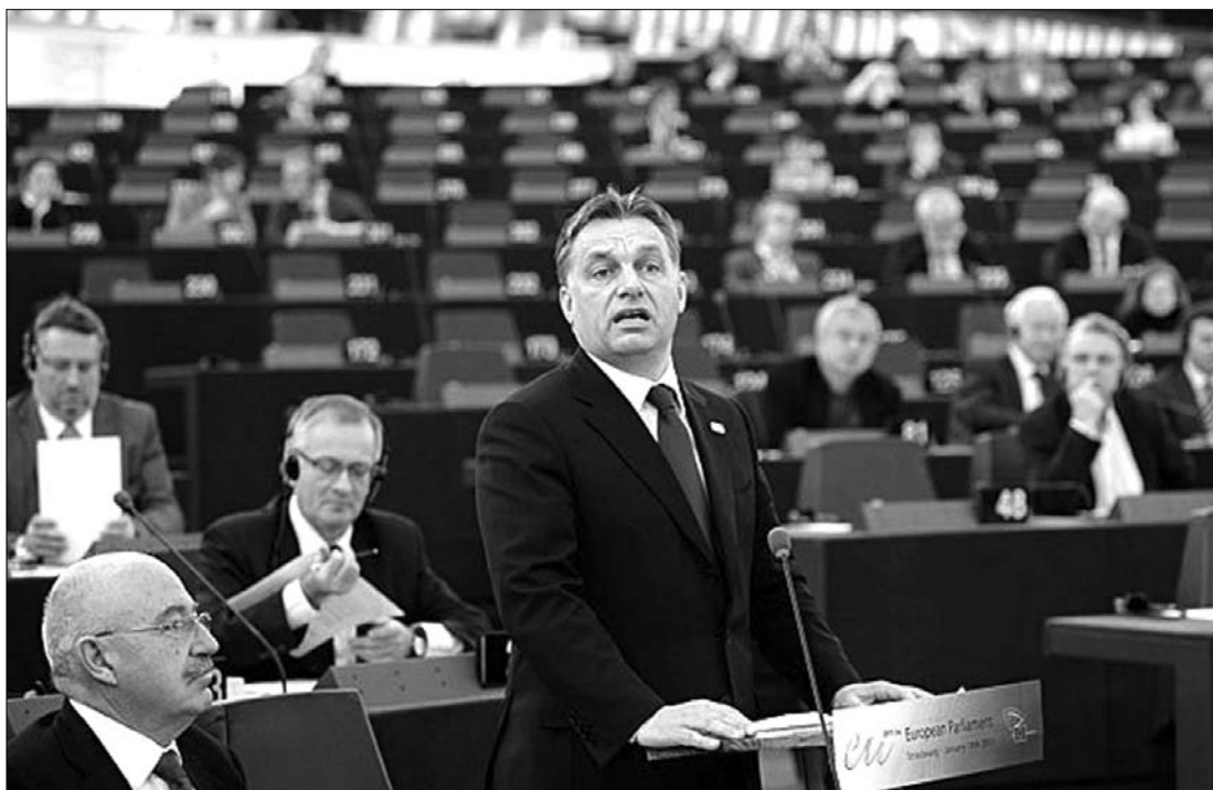
Orbán Viktor ismertette az elnökség programját. A képviselőket jobban érdekelte a médiatörvény

Guy Verhofstadt, a liberálisok, Lothar Bisky, a radikális baloldaliak vezetője, valamint Daniel Cohn-Bendit, a zöldszépek társfrakcióvezetője szerint a törvény nem felel meg a médiaszabadság követelményeinek, utóbbi „Chaveznek” titulálta Orbánt. A magyar kormányfő leszögezte: nem presztízskérdés az ügy. Ha az Európai Bizottság elemzése alapján módosítani kell a médiatörvényt, akkor az meg fog történni. Arra kérte az EP-képviselőket, hogy lehetőség szerint ne keverjék össze a magyar belpolitika vitás kérdéseit az EU-elnökség ellátásával kapcsolatos közös feladatokkal. Szavai tapsot váltottak ki a képviselők soraiban. ◀