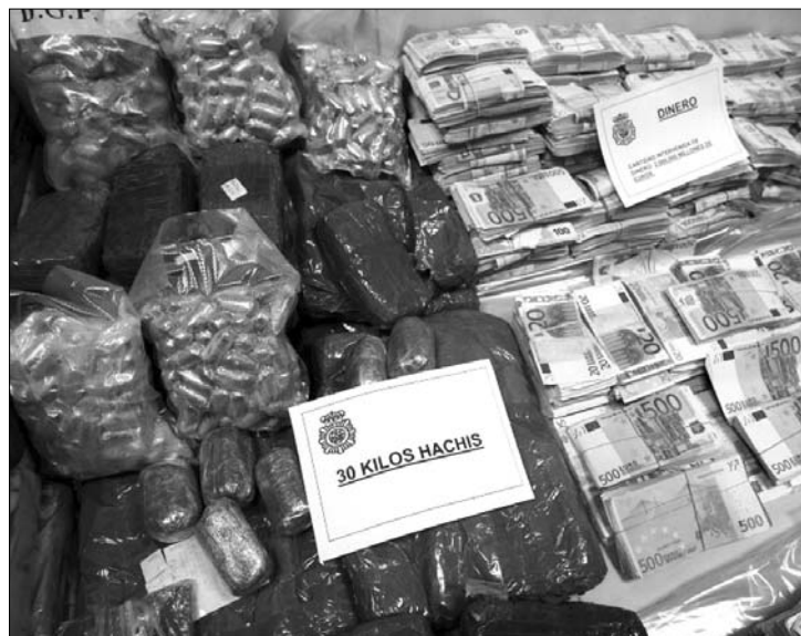
A rendőrség sem hitt a szemének a hasis és a pénz mennyisége láttán

A nyomozás jelenlegi állása szerint a drogmaffia gondoskodott arról, hogy a kokain előállításához szükséges anyagot Spanyolországba csempésszék, ahol feldolgozták, és terjesztették a kész kábítószer. Az így szerzett pénzt pedig tisztára mosták. Zaragozában a rendőrség lecsapott egy másik bandára is, amelyről feltételezik, hogy kokaint csempésszett, itt 15 gyanúsítottat vettek őrizetbe. ◀