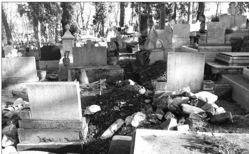
Folytatódik a műemlék értékű sírok rongálása a Házsongárdi temetőben

alakuláson megy át, olyan ismeretanyagot kívánnak kialakítani, amely a múzeum minden kiadványán megjelenik, még a belépőjegyeken is. Az intézményvezető azt is elmondta: a belépőjegyek hátoldalát reklámfelületnek tekintik, és már meg is hirdették, várják különböző cégek, intézmények jelentkezését, amelyek kihasználnák ezt a hirdetési lehetőséget. Az ebből származó bevételt célirányosan régészeti légi fotózásra kívánják fordítani, ennek eredményét augusztusban mutatná be a múzeum, részletezte Miklós Zoltán. Az újdonságok közül talán legfontosabb a két, igen lerobbant állapotú terem felújítása, hisz így most már összesen tíz kiállításra alkalmas helyiség van az épületben. Ezekben a termekben harminc évvel ezelőtti felszerelés és bútorzat volt található, ami nagyon is időszerűvé tette a felújítást, összegzett az igazgató. ◀