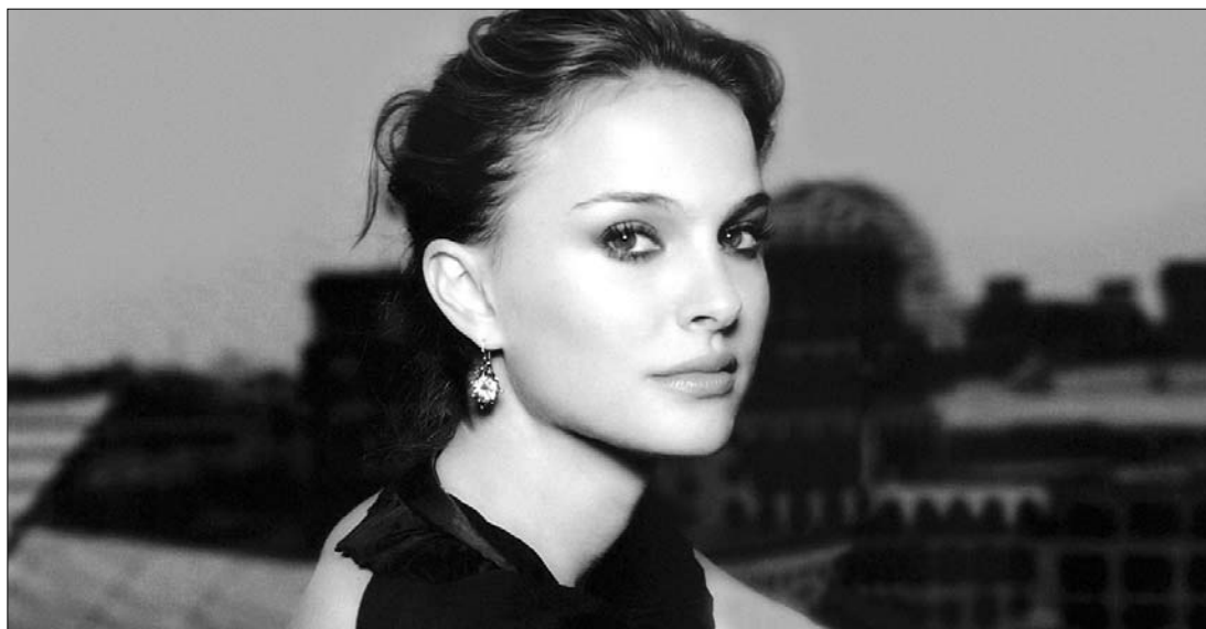
A romániai felmenőkkel rendelkező Natalie Portman Aranyglóbusza Oscart érhet