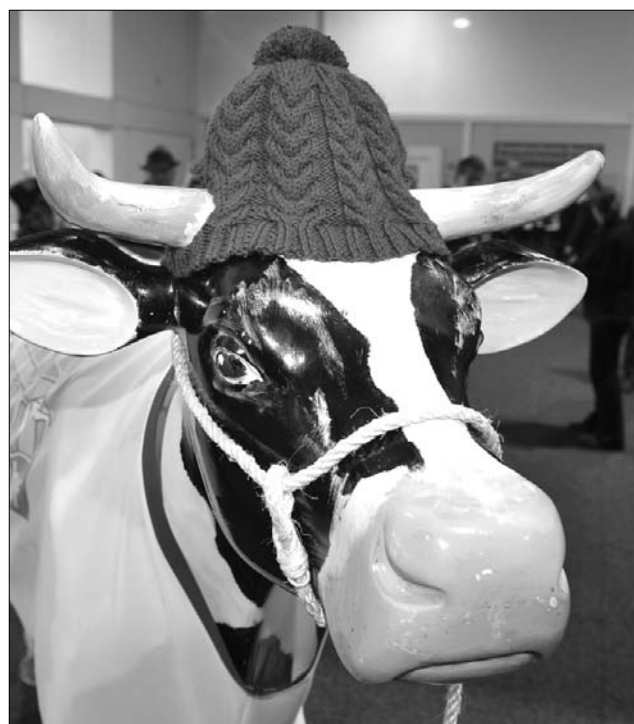
A Zöld Hét a globális élelmiszerbiztonság kérdését tematizálja

Az idén 76. alkalommal megrendezett Berlini Zöld Hét a világ legnagyobb „fogyasztói szemléjének” számít: a rendezvény tíz napja