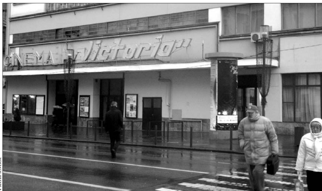
Kolozsvár második legnagyobb filmszínháza, a Győzelem mozi meghatározatlan időre bezár

Idén márciusban a kolozsvári ítéletábra döntése értelmében az Egyetem tér 3. szám alatti Se-