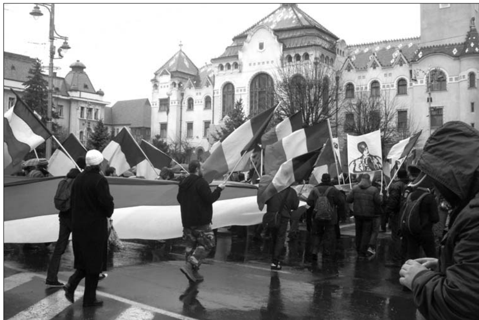
Az Új Jobboldal tüntetői a Kultúrpalota és a régi városháza között álltak sorfalat

A magát a Vaszárda utódjának tartó Noua Dreaptă száz-százötven tagja a Hősök temetője előtt indult. A tüntetők piros-sárga-kék sállal a nyakukban, nemzeti színű lobogókkal és transzparenssekkel vonultak végig a városon a főtérről, a Kultúrpalota és a régi városháza között sorfalat állva vettek részt a december elseji