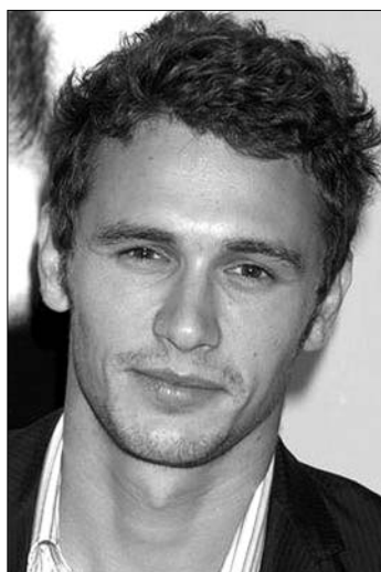
James Franco és Anne Hathaway, a 83. Oscar-gála házigazdái

„James Franco és Anne Hathaway Hollywood soron következő csillagai, akik izgalmasak és sokoldalúak. Reméljük, hogy változatossá tudják várszolni az Oscar-díjátadót, és jól elszórakoztatják az egész világot” – indokolták választásukata producerek, hozzátéve: bíznak abban, hogy a két sztár boldogan csatlakozik a kreatív Oscar-csap-