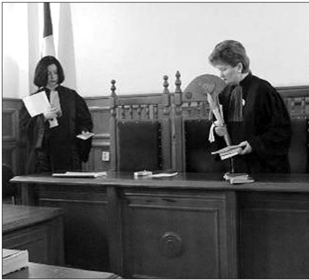
Rosszhiszeműség? A bírák saját fizetésük emeléséről ítélik

Mint ismert, elsőként a Vâlcea Megyei Törvényszék ítéltékett ügy, hogy törvénytelen a közalkalmazottak 25 százalékos fizetéscsökkentése. A bírák azzal érveltek, hogy korábbi – hasonló tárgyú perekben hozott – ítéleteiben a strasbourgi igazságszolgáltatási intézmény megállapította: a bérek megvonása a tulajdonjog (azaz egy emberi jog) megsértését jelenti. Ezzel szemben a kormány jogászai azzal érveltek: egy korábbi ítéletben (Eskelinen vs. Finnország) az Emberjogi Bíróság leszögezte, hogy a tulajdonjogot csu-