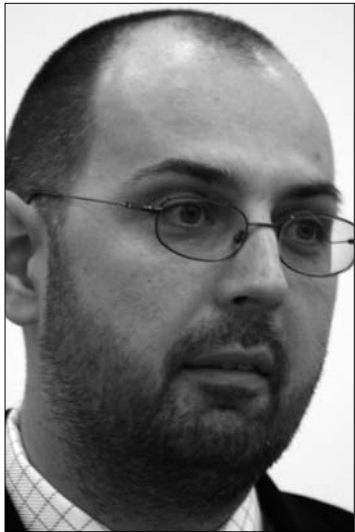
Ioan Botiş munkaügyi miniszter (középen) elképzelését Kelemen Hunor (balra) és Raluca Turcan is kritizálta

A kulturális miniszter hozzátette, ma vagy jövő hétfőn a koalíciós egyeztetések során mindenképpen terítékre kerül ez a kérdés, addigra az RMDSZ szakemberei is összeállítanak egy törvénymódosítási javaslatot, amely az említett feltételeket tartalmazza. „A Demokrata-Liberális Párt Ioan Botiş munkaügyi minisztert bízta meg ezzel a törvénymódosítással, ez azon-