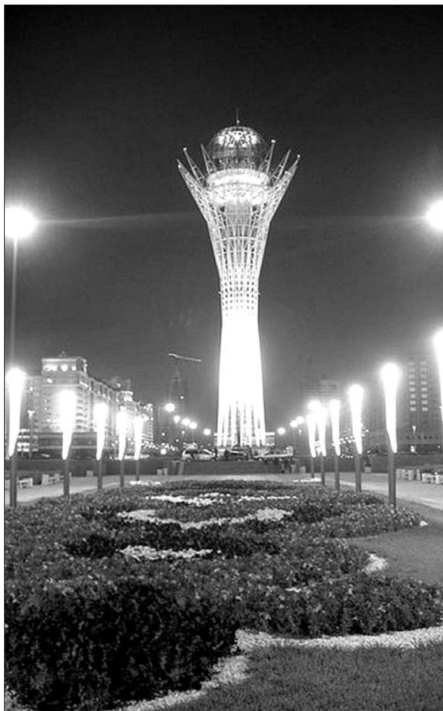
A Bayterek-torony. Legfelső emeletén a nemzetvezető kézlényomatával

Az EBESZ most ismét hallat magáról: tegnap és ma Kazahsztán futurisztikus fővárosában, a hétszáz ezer lakosnak otthonul szolgáló Asztanában adtak egymásnak randevút az 56 tagállam és 12 partnerország vezető politikuskai. Ez azért nagy szó, mert a szervezet legutóbb 1999-ben Isztam-