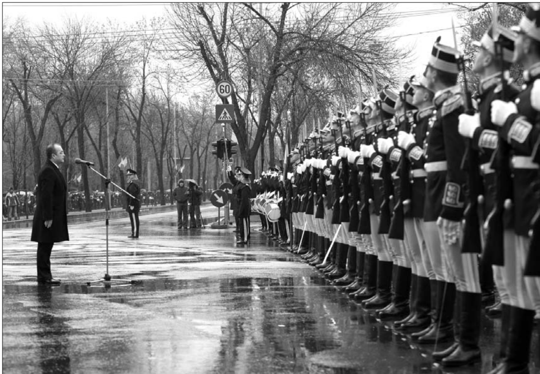
A katonai tiszteletadásra válaszoló Emil Boc kormányfő „Jó napot!”-ja is alkotmányossági vitát váltott ki

neppel kapcsolatos teendőket. „Egy eseményen való képviselői volt szó, nem pedig az államfői teendők ideiglenes átruházásáról, ezért alaptalan Mircea Geoană felháborodása” – fogalmazott a Gándul kérdésére Valeriu Turcan. ◀