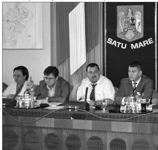
A Szatmár megyei önkormányzat 13 millió lejt szavazott meg