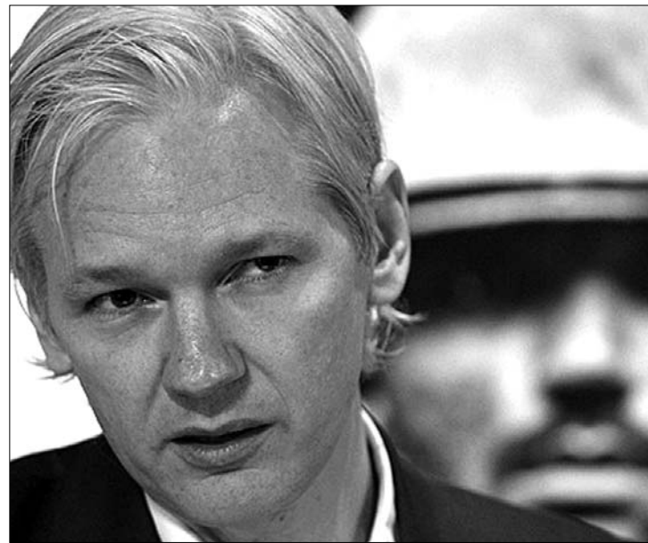
Julian Assange-t 188 országban körözik. Menekülnie és rejtőzködni kell

a legutóbbi WikiLeaks-kiszivárogtatásokhoz hasonló esetek előforduljanak. A szóban forgó adatbázishoz egy titkos katonai hálózatról nem lehet átmenetileg hozzáférni – tünt ki a nyilatkozatból. Szakértők szerint a SIPRNET-ről van szó, amely a védelmi minisztériumnak szinte az egész világot behálózó belső internetes hálózata (intranetje), ahonnan vélekedések szerint a WikiLeaks oknyomozó portál által megszerzett és kiszivárogtatott, katonai információkat is tartalmazó, az amerikai diplomáciát felettlőbb kínosan érintő külügyi dokumentumok származnak.