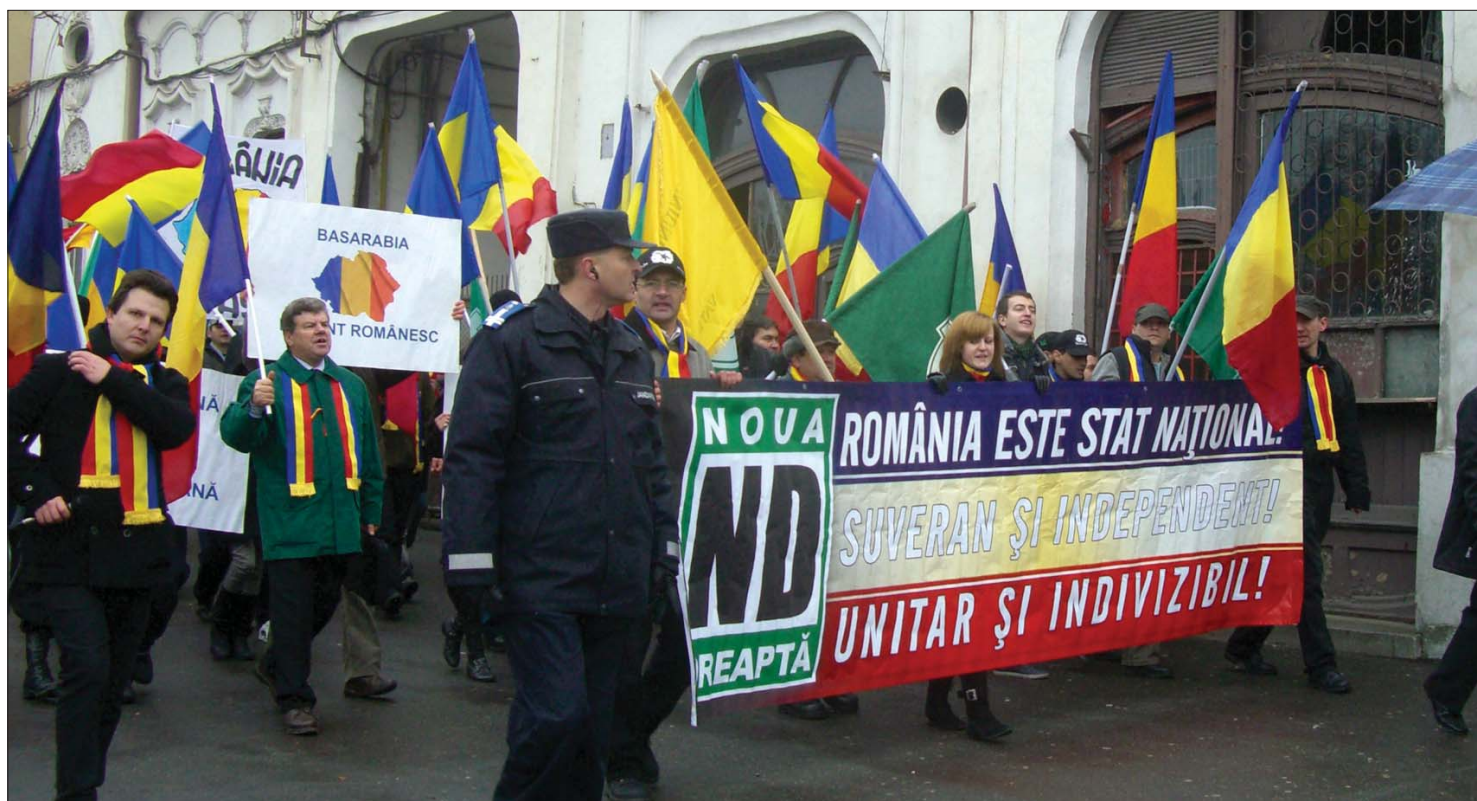
Maroknyian vonultak utcára. A Noua Dreaptă tüntetőinek nem sikerült mozgósítaniuk Marosvásárhely román lakosságát

Vásárhelyen tüntetett a Noua Dreaptă, Kolozsváron bekísérték a székely gárdásokat