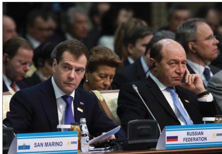
Dmitrij Medvegyev és Traian Băsescu az EBESZ-csúcson. 2. és 4. oldal