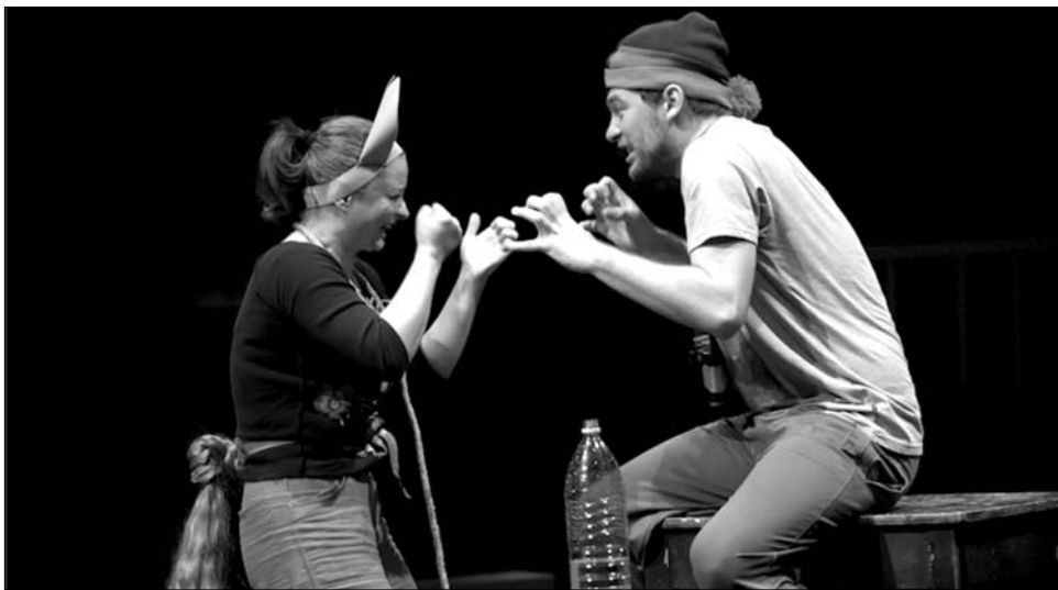
A színészek sorra több szerepet is játszanak, csábítót és elcsábítottat is