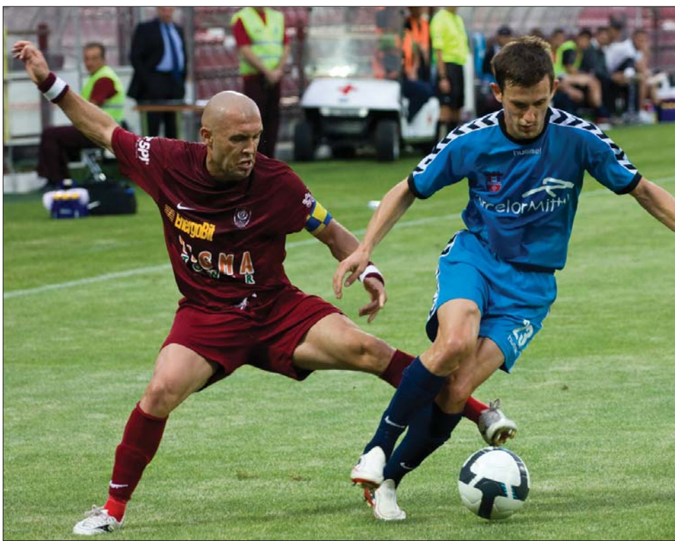
A galaciak (kék mez) mérkőzésről mérkőzésre egyre jobban játszottak az őszi idényben

A Szolnok nagy hajrával 70-69-re nyert, hazai közönsége előtt a francia Gravelines Dunkerque együttese ellen a férfi kosárlabda Eurochallenge Kupa harmadik fordulójában, ugyanakkor a Steaua Turabo 78-59-re kikapott Krasznodarban az orosz Kubantól.