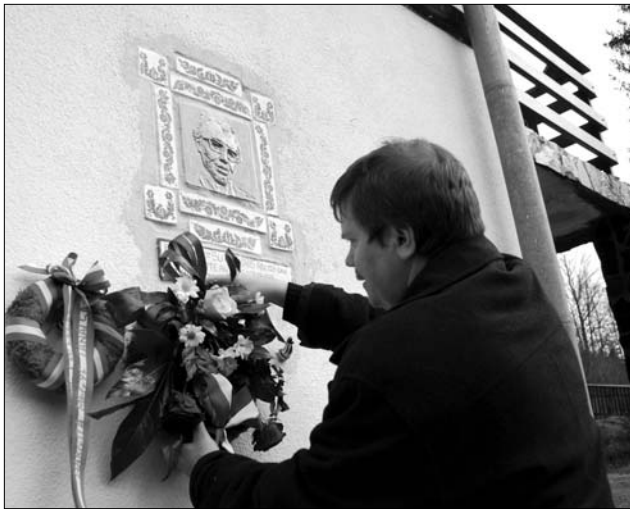
Szilágyi Mátyás főkonzul koszorút helyez el az emlékkplakettnél

Sütő András emlékkplakettet avattak kedden Sikaszóban, Erdély írófejedelmének egykori nyaralójánál. Az András-napra időzített ünnepségen a hideg, szeles idő ellenére, mintegy száz meghívott, családtagok, tisztelők, egykori barátok és közéleti személyiségek emlékeztek a Hargita aljában lévő nyaraló udvarán. Az ünnepség ökumenikus istentisztelettel kezdődött, a szertartást Demeter József református lelkész, az író unokatestvére tartotta, majd az alkotóra és munkásságára emlékező köszöntőbeszédekkel folytatódott az esemény. Szilágyi Mátyás főkonzul a Herder- és Kossuth-díjas erdélyi magyar író szellemiségét idézte beszédében. „A XX. századi magyar irodalom egyik legnagyobb alakját, Sütő Andrást nemcsak magas színvonalú prózai és drámai művei emelték az írók élvonalába, de a közösségért való bátor kiállása is öregbítette hírnevét. Most, belépve az advent ünnepkörébe a készülődés, az elhalkulás, a múlt és jövő feladatai számbavé-