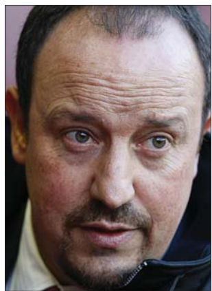
Rafa Benítez, az Inter edzője

A B jelű négyesben az Olympique Lyon Gelsenkirchenbe látogat, a Schalke