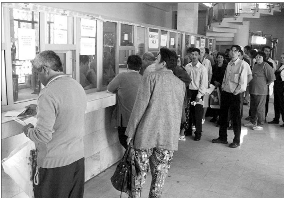
Mivel Románia még nem érett meg az adócsökkentésre, az állam továbbra is kasszához tessékkel

Szerinte olyan körülményeket kellene biztosítani, amelyek Romániát vonzó-