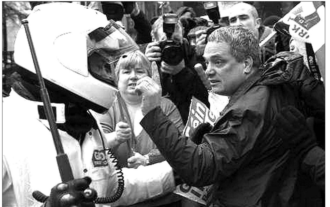
Dublinban a korábban szélsőséges ír mozgalom, a Sinn Fein aktivistái és hívei csaptak össze a rendőrökkel

ni. Diplomatakorökből 80-90 milliárd eurós hitelről beszélnek, amelyet a közös valuta védőerőjének irányelvei alapján az EU és IMF közösen nyújt. Az ír polgárok „csalódottak és elárvultak” érzik magukat, a Sinn Fein aktivistái és hívei máris az utcára vonultak Dublinban. ◀