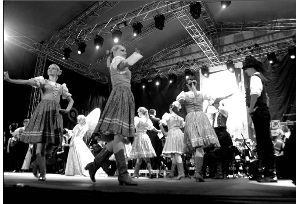
Igény van Nagyszebenben a magyar kultúrára, ezt bizonyítják a mindig telt házak is

A holnap kezdődő fesztivál első fellépője a Nagyszebeni Balett Társulat este héttől a Szakszervezetek Művelődési Házában várja a közönséget. Pénteken délelőtt a kispiacra Alsócsernátont bemutató óriásfotókból nyílik kiállítás, a Habitus Galériában pedig Nagyszeben – Pécs, Párhuzamok két Európai Kulturális Főváros között címmel nyílik Moraru Victor építész fotókiállítása, aki fényképezőgéppel végigkísérte a szebeni építkezése-