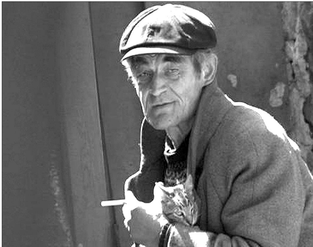
Az Emmy-díj ítéseihez szemével nézve is megkapó a Ion B. szemével bemutatott világ

A legjobb vígjátéknak a Közlekedési lámpa (Traffic Light) című izraeli alkotás bizonyult. Argentin műsor, a heti rendszerességgel jelentkező CQC szatirikus hírkomentáló adás nyerte az előre megírt forgatókönyv nélküli legjobb szórakoztatóműsorok járó díjat. A dél-amerikai országból érkezett vendégcsereg üdvözléssel fogadta a bejelentést, a műsört 1999 óta minden évben jelölték, de csak most ka-