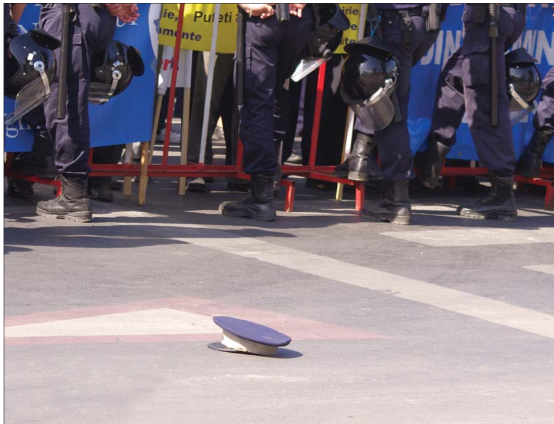
Lefejezett karhatalom. Belügyminisztériumi államtitkárt és országos főkapitányt is menesztettek

▶ A legmagasabb szintű menesztésekhez vezettek tegnap a múlt héten kirobbant rendőrségi korrupciós botrányok: Traian Igaș belügyminiszter felmentette tisztségéből