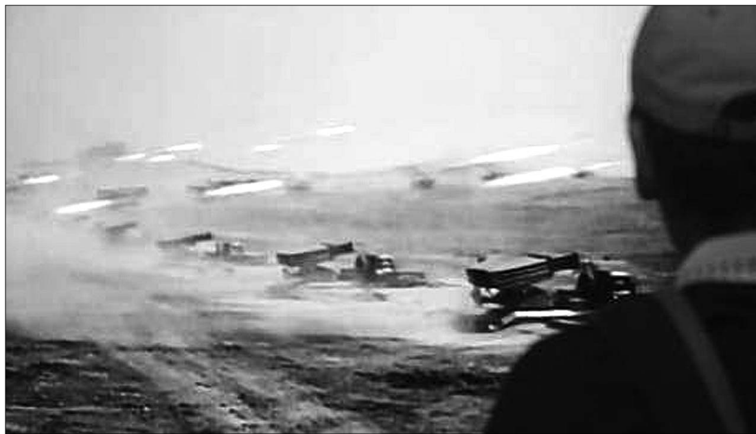
A dél-koreai televízió élőben közvetítette a támadás képsorait. A járókelők hatalmas képernyőn figyelték az eseményeket