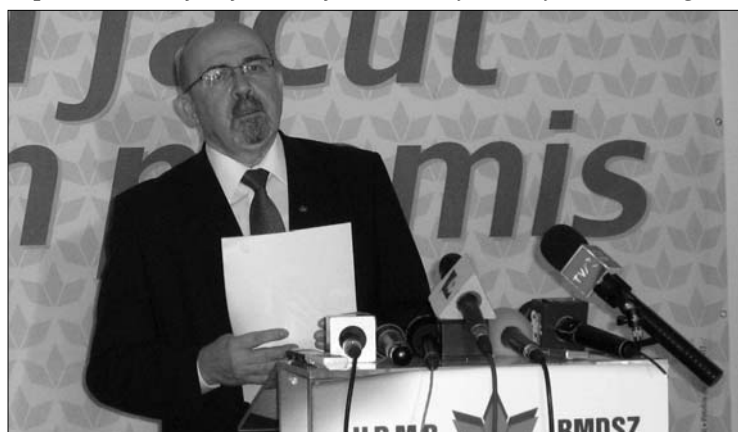
Markó tegnapi sajtótájékoztatóján élesen bírálta az ellenzékét.

Markó Béla RMDSZ-elnök tegnapi bukaresti sajtótájékoztatóján