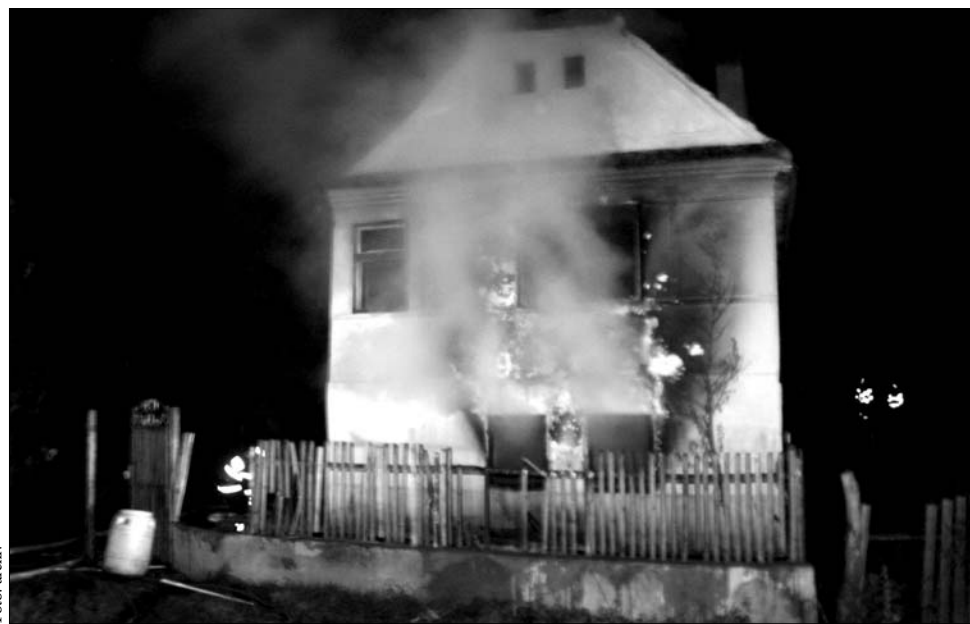
A Gábor porta egy hónappal ezelőtt, október 22-én gyulladt ki. Azóta nincs nyugta Recsenyédek...

Most a falubeliek interneten gyűjtenek aláírást a helyzet rendezése érdekében. A petíció szerint azért alakult ki évekként elzárva, és tart ma is a konfliktussorozat, mert „az illetékes állami szervek nem voltak hajlandók beavatkozni többszörös felkérés nyomán sem, így az elmúlt