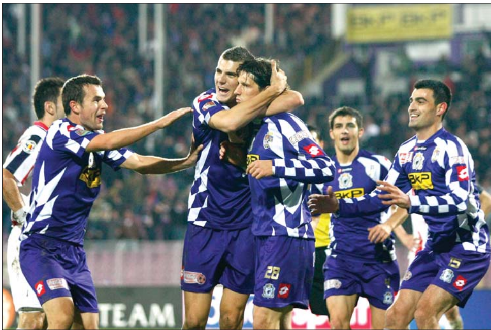
A rangadón győztes temesváriak egy pontra közelítették meg a listavezető Galacot

A 16. fordulóban egyébként a kolozsvári döntetlen mellett négy-négy hazai, illetve vendégsiker született, s a 22 gólból tizet a látogatók szereztek. A gólok száma